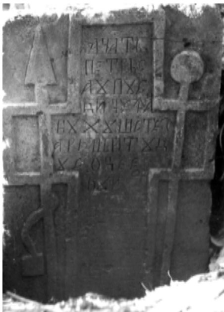
Fig. 1. Piatra de mormânt a familiei Buhuș. 1848 mai 14