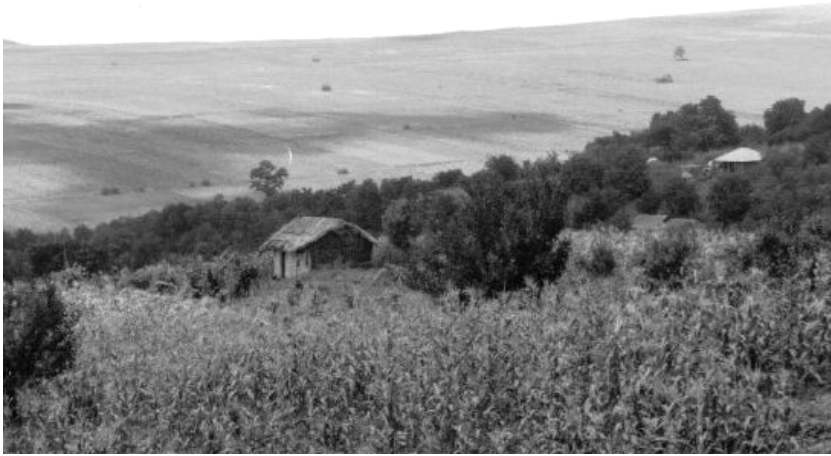
Fig. 4. Adăpost în bulgărie; Duda – Vaslui