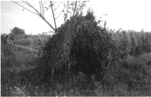
Fig. 5. Colibă ridicată pe un copac tânăr în Cucuteni – Iași