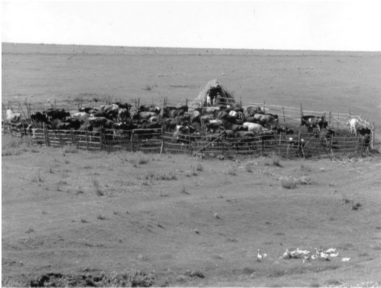
Fig. 7. Adăpostul la văcăria din hotarul satului Butucăria – Vaslui