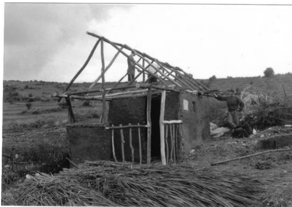
Fig. 1. Adăpostul din bulgăria lui Gheorghe Furnică; Zăpodeni – Vaslui