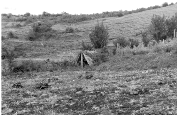
Fig. 2. Adăpostul din bulgăria lui Costică Iloaiei; Băiceni – Vaslui