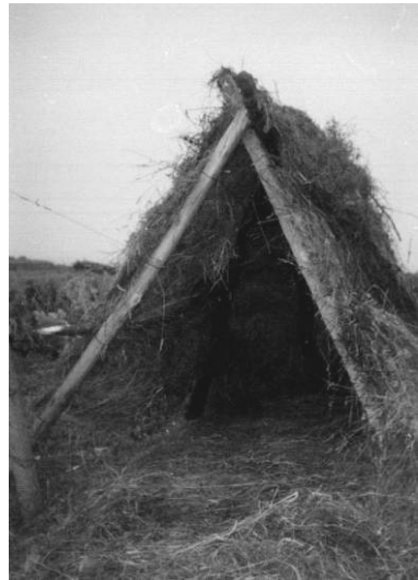
Fig. 6. Coliba din via lui Costică Miron; Cucuteni – Iași