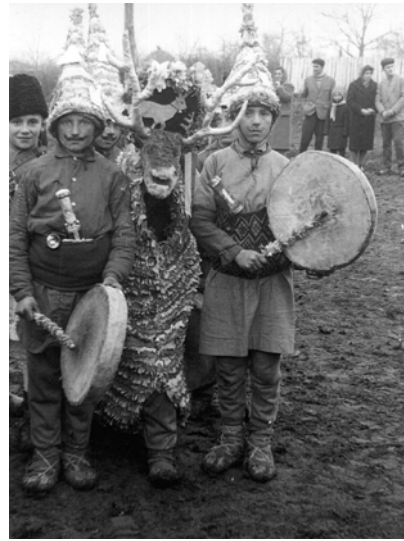
Fig. 5. Cerbul, Popești – Iași, 1967