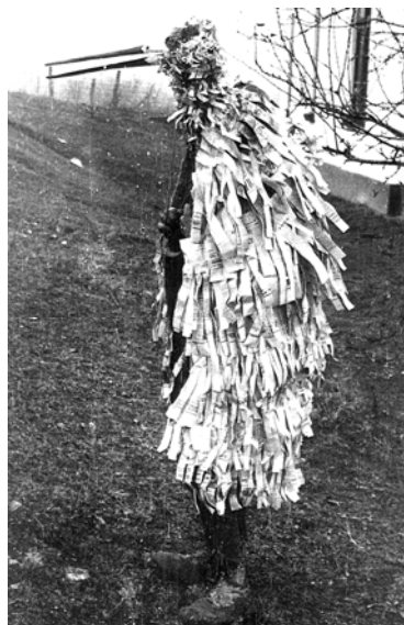
Fig. 9. Cocostârcul, Budești – Mogoșești – Iași, 1967