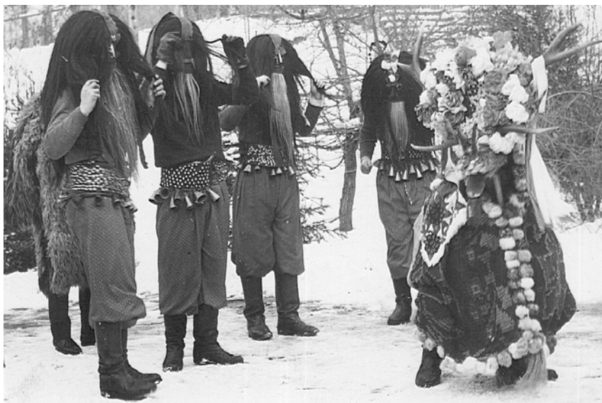
Fig. 7. Cerbul și „dracii”, Belcești – Iași, 1967