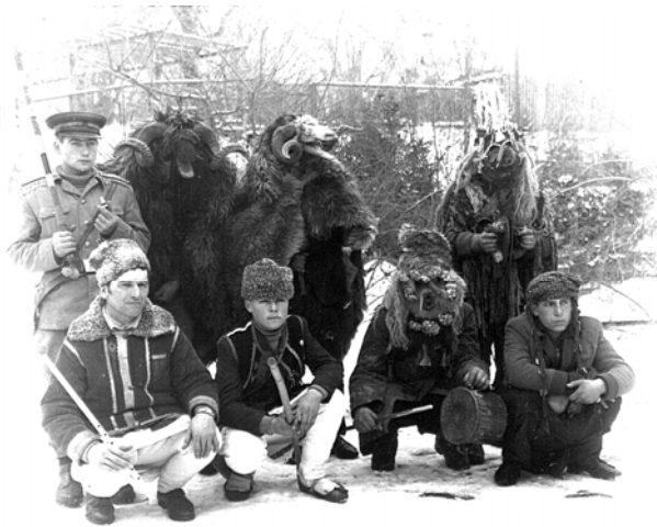
Fig. 10. Berbecii, Trifești – Iași, 1968