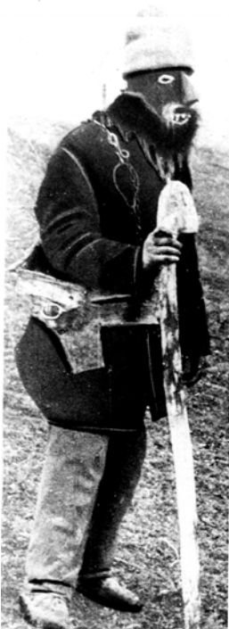
Fig. 11. Mască de bătrân, Budești – Mogoșești – Iași, 1967