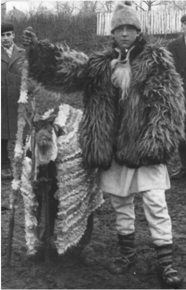
Fig. 1. Ciobanul și capra, Popești – Iași, 1967