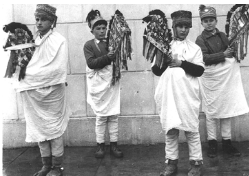
Fig. 12. Caii, Andrieșeni – Iași, 1968