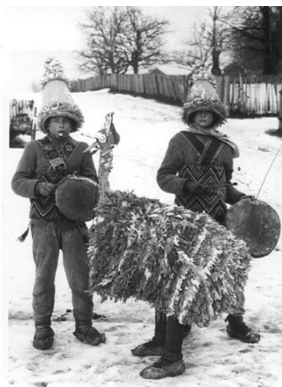
Fig. 8. Struțul, Mădărjac – Iași, 1967