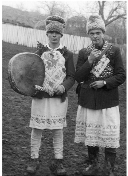
Fig. 2. Arnăuț și irod cu toba, Popești – Iași, 1967