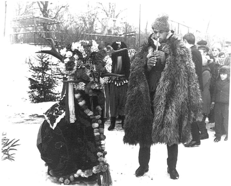
Fig. 6. Cerbul, Belcești – Iași, 1967