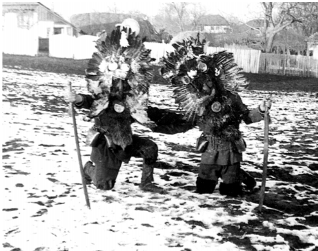
Fig. 3. Moșnegi la capră, Popești – Iași, 1967