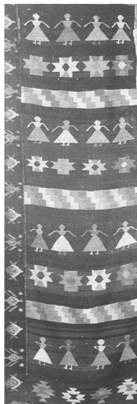
Fig. 5. Scoarță

Figura umană este redată în diferite ipostaze, fie sub forma horei în care fetele poartă fustă clopot (fig. 5), apoi călărețul, o atenție deosebită acordându-se reprezentării în