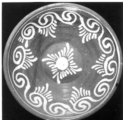
Fig. 4. Strachină, Mihăileni

Unele centre de olărie se remarcă și prin vasele de provizii de mare capacitate, cum a fost de pildă centrul ceramic de la Tudora, unde s-au confecționat oale de mari proporții, ce atingeau capacitatea de 30 l sau chiar mai mult și care, pentru a putea fi realizate, necesitau de obicei munca a doi meșteri olari.