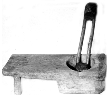
Fig. 1. Pivă, Coșula

Referindu-ne la agricultura ocupația de bază a locuitorilor din zonă, aceasta este reprezentată, pentru lucrul pământului, prin unelte de săpat (unele cu întrebuințare specială, cum este de pildă, lucratul viilor), apoi, unelte pentru sfărâmarea bulgărilor și netezirea solului înainte și după însămânțare (tăvălug de lemn din Tudora, numit în partea locului „vălătuc”), unelte de recoltat, de vânturat și selecționat semințele, precum