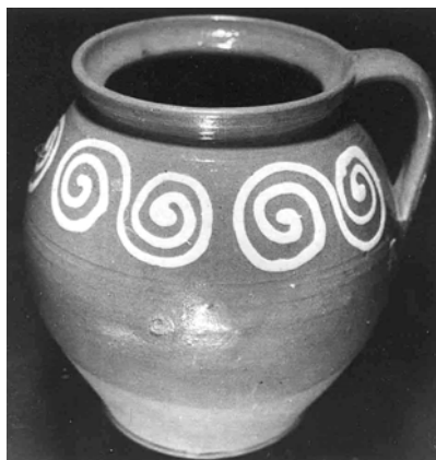
Fig. 3. Oală, Mihăileni

răspândirea olăritului în diferite localități din Moldova și chiar în alte zone ale țării. Muzeul Etnografic din Iași posedă o bogată colecție de ceramică provenită din centrul Mihăileni, interesantă prin formele sale variate, smalțul de bună calitate, ornamentația policromă de largă inspirație vegetală, ce mai păstrează în decor și elemente de veche tradiție, cum sunt, de pildă, valul, spirala în formă de „S” (culbec), triunghiul etc., motive decorative ce se întâlnesc și în producția olarilor plecați în alte localități mai apropiate sau mai îndepărtate din Moldova (fig. 3 și 4).