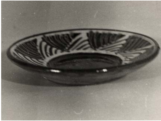
Fig. 4. Farfurioară cu motivul „coasta vacii

Privită în ansamblul ei, creația lui Ion Diaconu se individualizează prin armonia formelor și a culorilor, prin efectul contrastelor cromatice utilizate în relația fond – motiv decorativ, modul ordonat de distribuire a ornamentelor și evident prin compoziția ce angajează un dialog expresiv între formă, motiv și culoare.