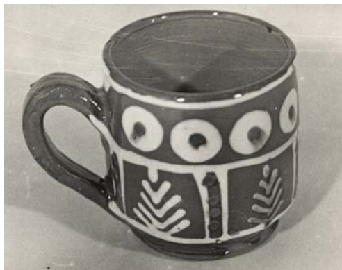
Fig. 2. Căniță cu motivul „brăduț”