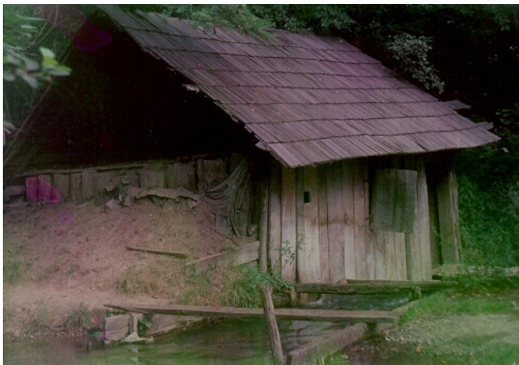
Piua lui Constantin Bistriceanu. Vedere dinspre lăptoc

terminologia prin care sînt desemnate părțile componente corespunde, în bună măsură, cu cea utilizată în locuri mai îndepărtate 14 : apa este îndiguită, formînd un iaz , din care parcurge cu viteză lăptocul , construit din scînduri, lung de 4 m și lat de 2 m. Învîrtirea roții cu cupe se face prin aducție inferioară. Două fuse din fier, așezate pe broaște , sînt înfipte în capetele grindeiului octogonal. În interiorul bordeiului , se află dispuse celelalte componente ale instalației: butucul , avînd 70 cm în diametru, în care au fost scobite două găvane , cele 4 plesnitori care străpung dintr-o parte în alta grindeiul, obținîndu-se astfel opt capete care ridică alternativ cele patru ciocane cu coadă.