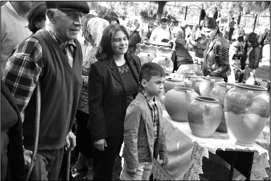
Fig. 8. Imagine de la bâlci (septembrie 2010)