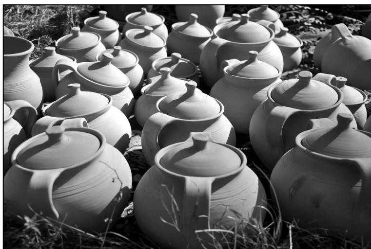
Fig. 6. Oale de sarmale (2010)