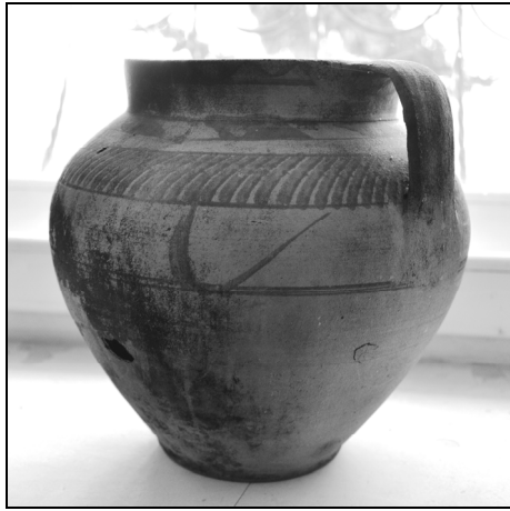
Fig. 9. Oală de sarmale