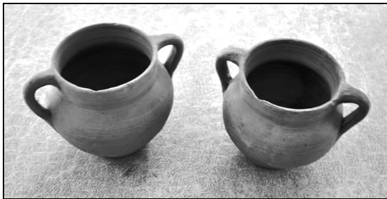
Fig. 12. Ulcele negre