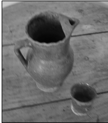
Fig. 2. Tocitoare cu punte