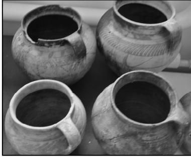
Fig. 1. Oale vechi nesmălțuite