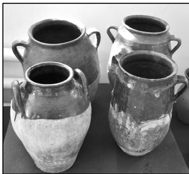
Fig. 4. Gavanoase din anii '30-'60 ai secolului al XX-lea