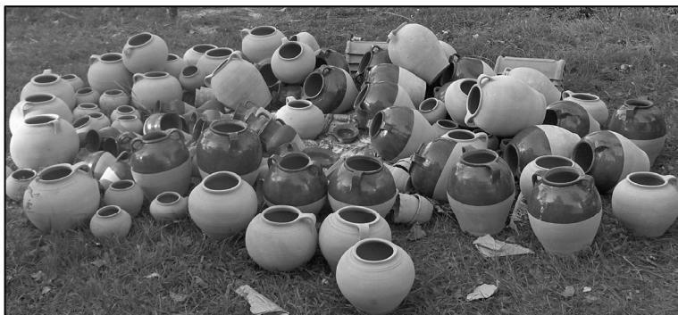
Fig. 5. Articole de olărie (2008)