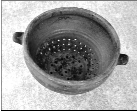
Fig. 11. Strecurătoare