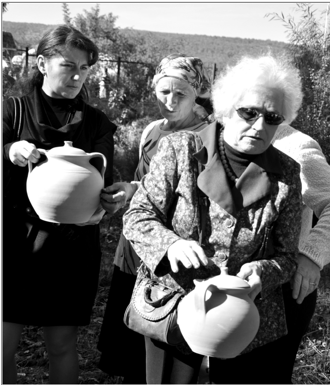
Fig. 10. Oale de Iurceni