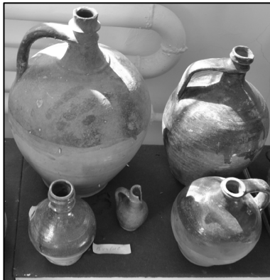
Fig. 3. Ulcioare strâmte vechi