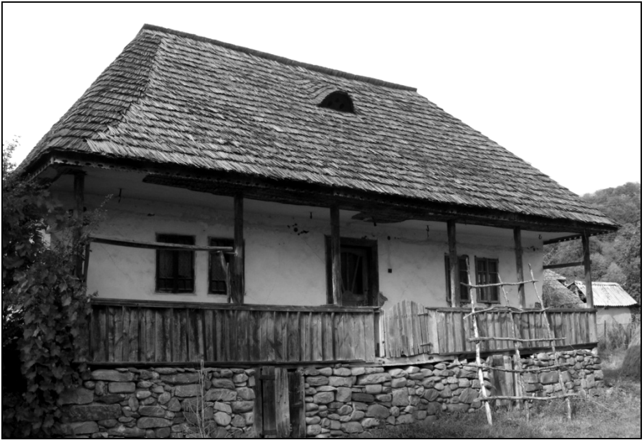
Fig. 13. Casă din județul Argeș