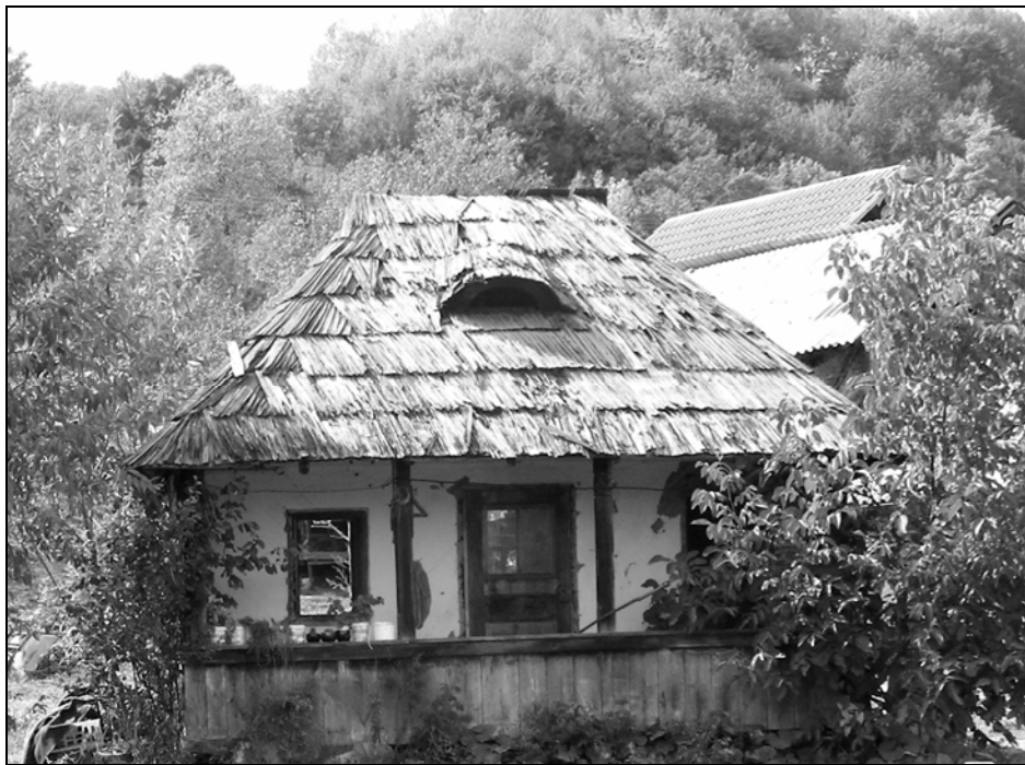
Fig. 11. Casă din județul Argeș