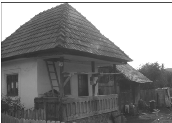
Fig. 10. Casă din județul Argeș