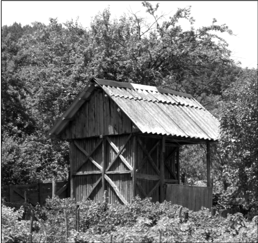
Fig. 4. Acaret din județul Dolj