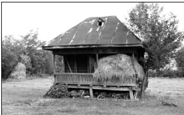
Fig. 5. Acaret din vatra satului Vulpeni – Olt