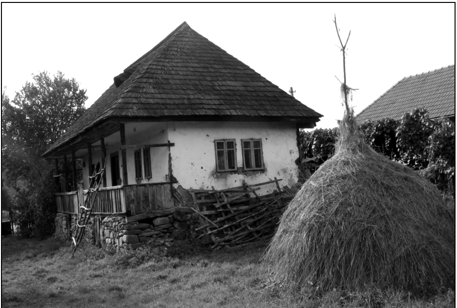
Fig. 14. Casă din județul Argeș