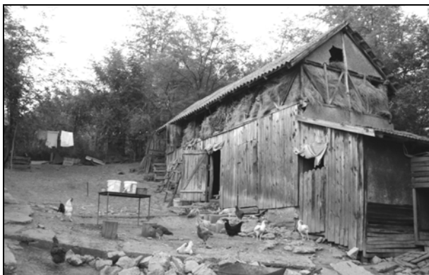
Fig. 7. Acareturi în curtea lui Dumitru Antonie (75 ani în 2013) din Vulpeni – Olt