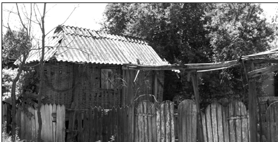
Fig. 2. Acareturi din județul Gorj