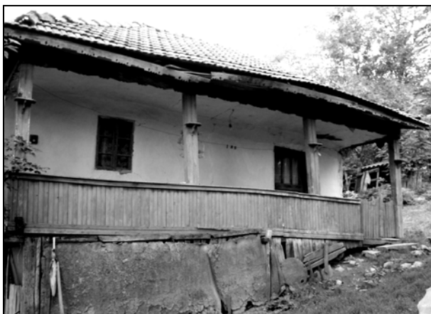
Fig. 6. Casa Mariei Bulacu (86 ani în 2013) din Vulpeni – Olt