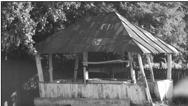
Fig. 9. Fântână din Motoci – Dolj