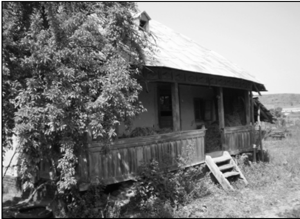
Fig. 8. Casă din Bulzești – Dolj