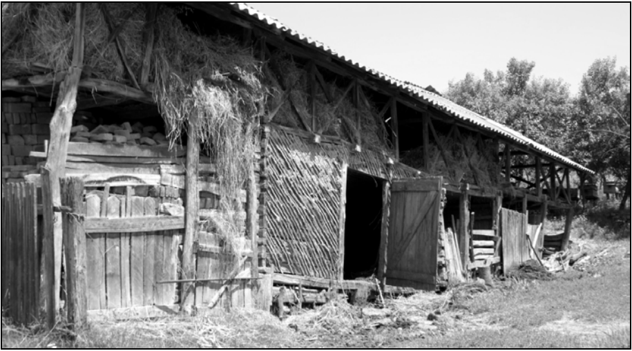
Fig. 3. Acareturi din județul Dolj