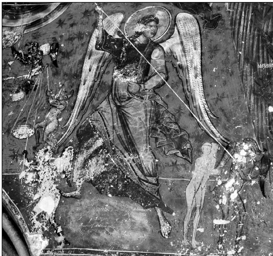
Fig. 1. Judecata de Apoi – extragerea materiei minerale de la diavoli. Mănăstirea Humor – pridvor, peretele estic