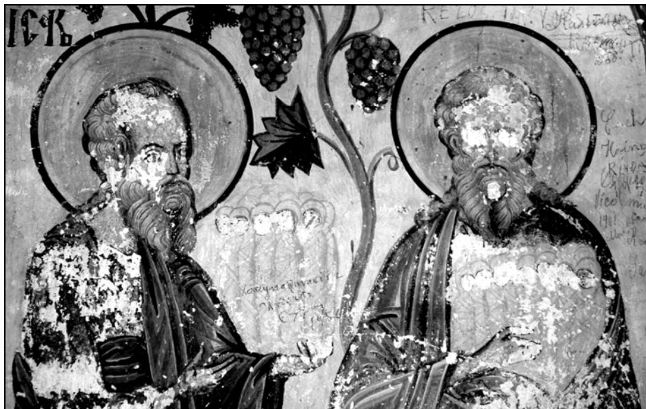
Fig. 3. Sânul lui Avram – extragerea „ochilor” de sfinți. Mănăstirea Sucevița – interior, pridvor, peretele estic