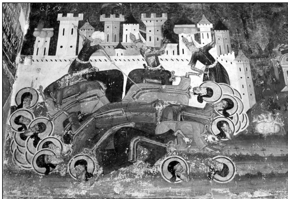
Fig. 4. Extragerea „ochilor” de sfinți. Mănăstirea Sucevița – exterior, peretele sudic