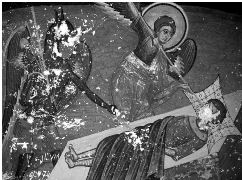
Fig. 6. Extragerea „ochilor” și a organelor sexuale de la diavol și păcătos. Mănăstirea Sucevița – interior, pridvor, peretele sudic