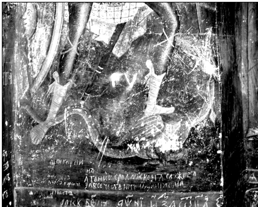
Fig. 5. Extragerea „ochilor” balaurului (ca simbol al diavolului). Mănăstirea Sucevița – interior, pridvor, peretele vestic