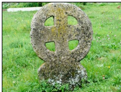
Fig. 16. Cruce înscrisă în cerc de tip celtic (Ariniș – Țara Codrului; secolul al XVIII-lea)