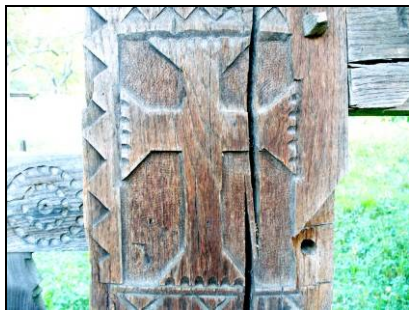
Fig. 15. Cruce latină pe stâlpul unei porți (Mara; 1935)