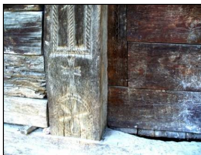
Fig. 12. Cruce latină pe ancadramentul ușii de acces a unei cămări (Chechiș – Țara Chioarului; 1794)