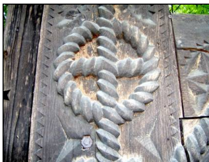
Fig. 7. Cruce înscrisă în cerc. Detaliu de pe o poartă (Breb – Țara Maramureșului; începutul secolului al XX-lea)