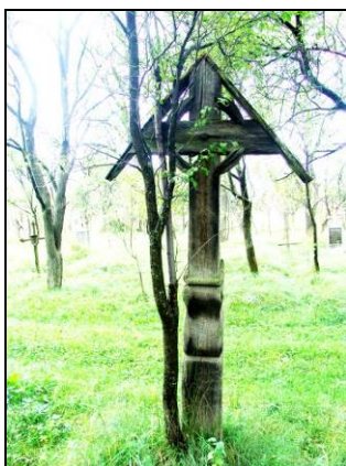
Fig. 17. Cruce înscrisă în cerc (Urmiș – Țara Codrului; începutul secolului al XX-lea)