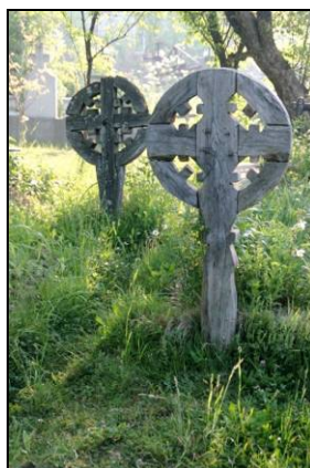
Fig. 18. Cruci înscrisă în cerc (Sat-Șugatag; începutul secolului al XX-lea)