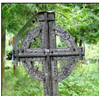
Fig. 19. Cruce exscrisă în cerc (Breb; prima parte a secolului al XX-lea)