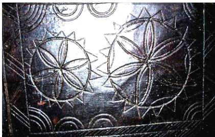
Fig. 21. Soare-rozetă pe o masă (Buteasa – Țara Chioarului; sfârșitul secolului al XIX-lea)