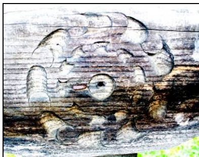
Fig. 9. Rozetă realizată cu ajutorul motivului unghiei. Detaliu de pe o poartă (Mara; 1935)