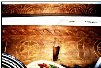
Fig. 22. Cuiier (Cupșeni – Țara Lăpușului; sfârșitul secolului al XIX-lea)