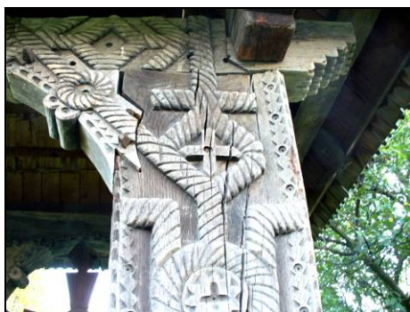
Fig. 14. Cruce înscrisă în romb pe o poartă (Mara; 1935)