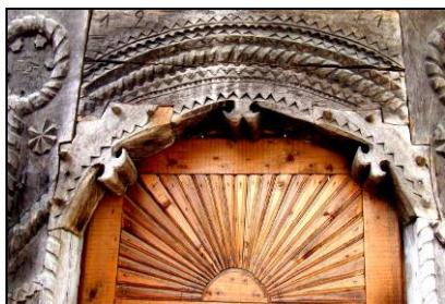
Fig. 5. Soarele, în asociere cu coarnele berbecului, pe o poartă (Budești – Țara Maramureșului; prima parte a secolului al XX-lea)