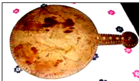
Fig. 23. Fund de mămăligă (Cupșeni; mijlocul secolului al XX-lea)