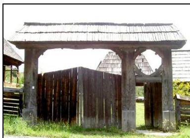
Fig. 6. Soare realizat prin îmbinarea unor piese de lemn pe o poartă (Petrova – Țara Maramureșului; mijlocul secolului al XIX-lea)