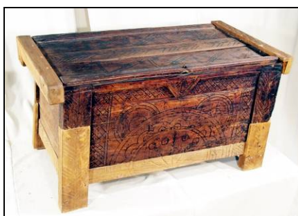
Fig. 20. Ladă de zestre cu „soare rupt” (Băița de sub Codru – Țara Codrului; a doua parte a secolului al XIX-lea)