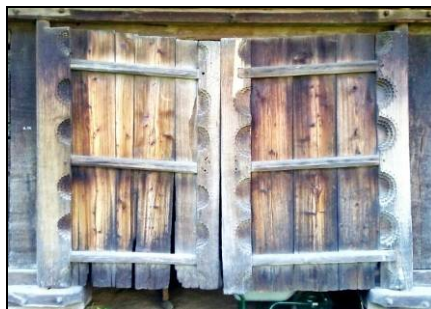
Fig. 2. „Soare rupt” realizat prin sculptare pe poarta unei șuri (Berbești – Țara Maramureșului; începutul secolului al XIX-lea)