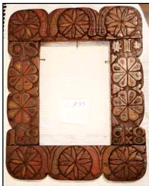
Fig. 24. Ramă de oglindă (Buteasa; 1898)