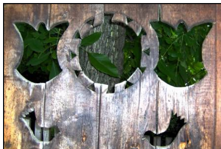
Fig. 4. Soare reprezentat ca cerc cu raze pe o poartă (Desești – Țara Maramureșului; a doua jumătate a secolului al XX-lea)