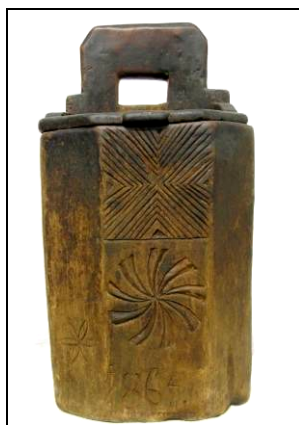
Fig. 26. Sălăriță decorată cu rozeta vârtėj (Aspra – Țara Lăpușului; 1864)