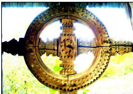
Fig. 10. Cruce excrisă în cerc pe o poartă (Mara; 1935)