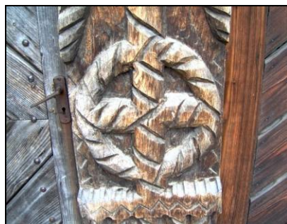
Fig. 8. Cruce înscrisă în cerc. Detaliu de pe o poartă (Sat Șugatag – Țara Maramureșului; mijlocul secolului al XX-lea)