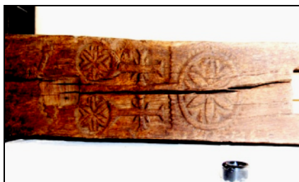
Fig. 13. Rozetă cu cruce pe deasupra (semn de mare meșter) pe un stâlp de fântână (Strâmtura – Țara Maramureșului; Muzeul Maramureșului din Sighetu Marmăției)