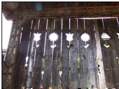
Fig. 3. Soare reprezentat ca floarea soarelui pe o poartă (Mara – Țara Maramureșului; a doua jumătate a secolului al XX-lea)