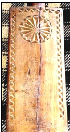
Fig. 25. Rozeta vârtėj pe un durgalău (Costeni – Țara Lăpușului; sfârșitul secolului al XIX-lea)