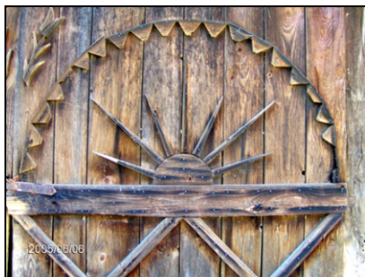
Fig. 1. „Soare rupt” realizat din șipci de lemn pe o poartă de șură (Negreia – Țara Chioarului; mijlocul secolului al XX-lea)