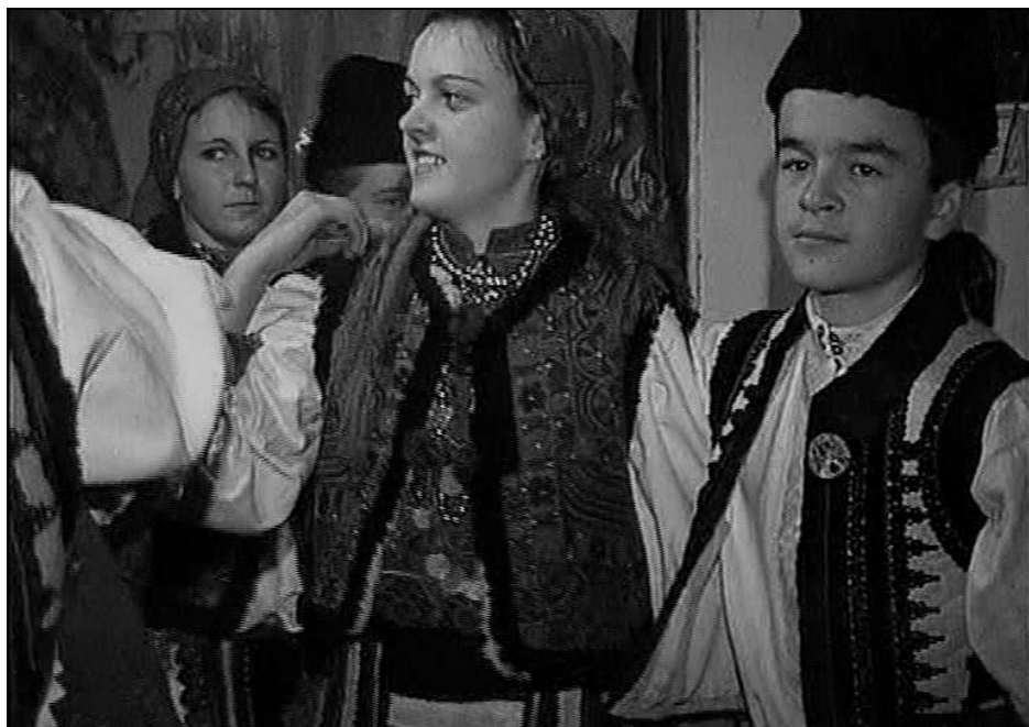
Fig. 16. Feciori jucând cu fetele într-o casă din Lelese după colindatul acestuia (1993)