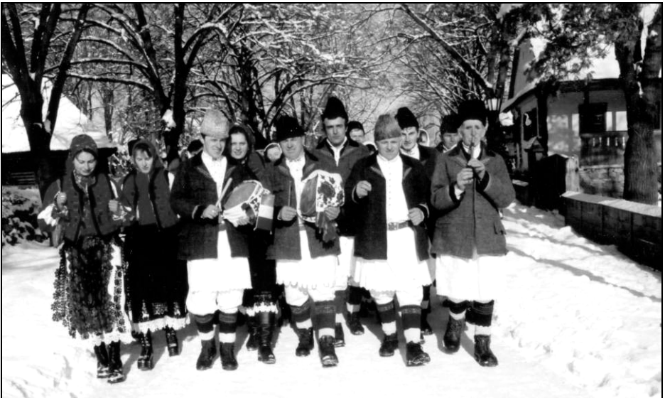
Fig. 19. Ceata colindătorilor din satul Feregi la Muzeul Satului din București