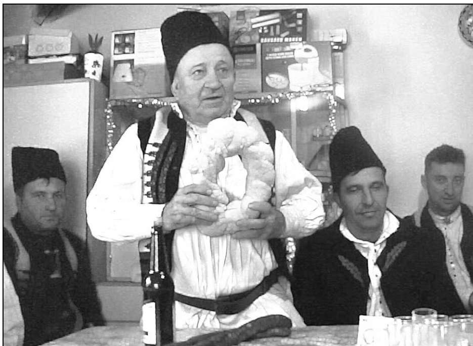
Fig. 11. Șeful cetei de colindători din Runcu Mare rostind orația colacului dăruit de gazda casei colindate (2014)