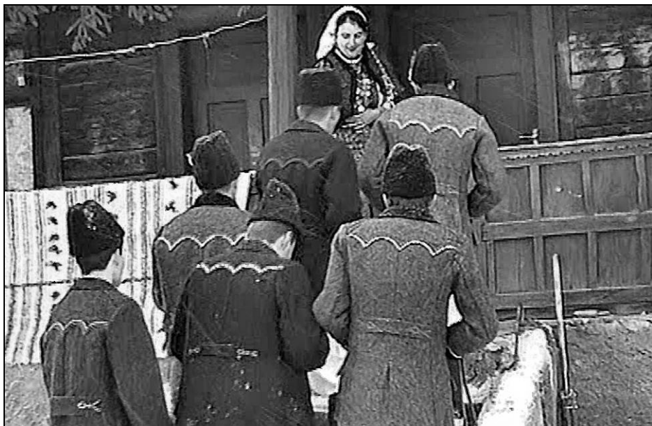
Fig. 10. Ceata colindătorilor din Lelese întâmpinată de gazda casei (2005)