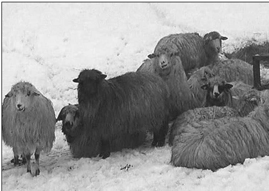
Fig. 3. Oi pe zăpadă în satul Dăbâca (2005)