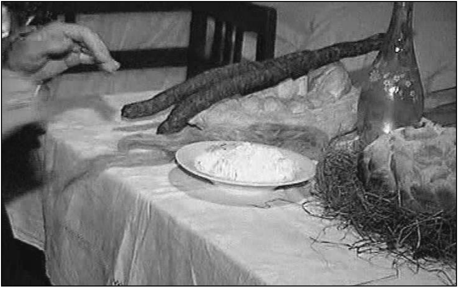
Fig. 8. Darurile pregătite pentru colindători într-o casă din Arăneș: colacul, cârnații, brânza, fuiorul de cânepă și vinarsul (țuica) în partea stângă a mesei, iar Crăciunița în partea dreaptă (2005)