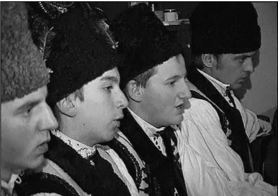
Fig. 13. Colindători într-o casă din Runcu Mare (2014)