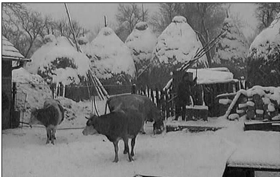
Fig. 4. Ocolul (curtea) vitelor într-o gospodărie din satul Cerișor (2005)