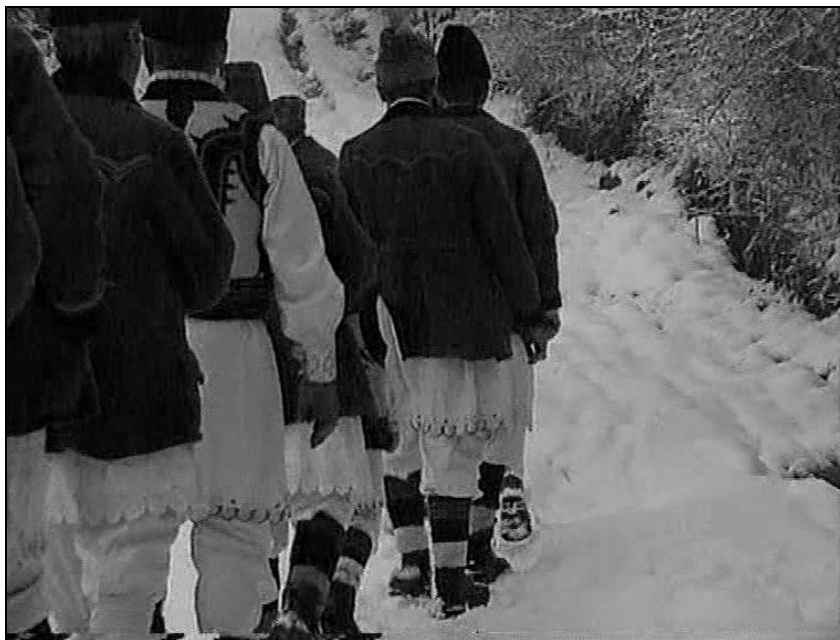
Fig. 14. Ceata de colindători din Arăneș pe o uliță a satului (2005)