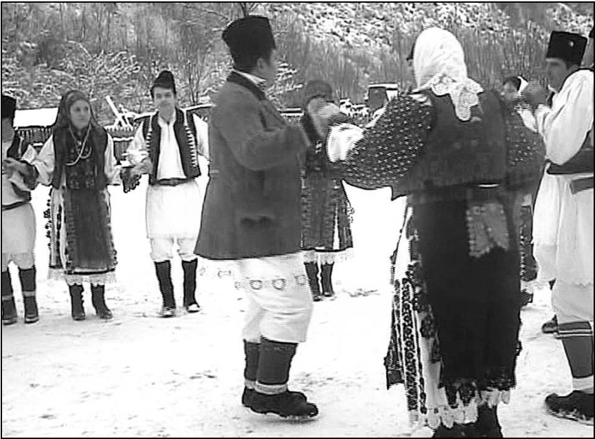
Fig. 12. Colindători din Runcu Mare jucând brâul după colindatul la o casă (2014)