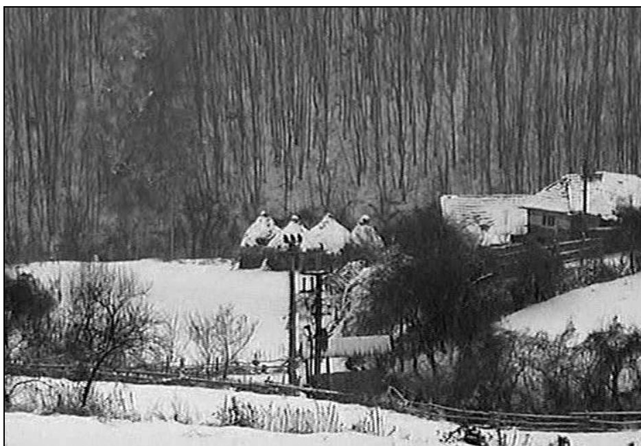
Fig. 2. Gospodărie din satul Arăneș (2005) 11