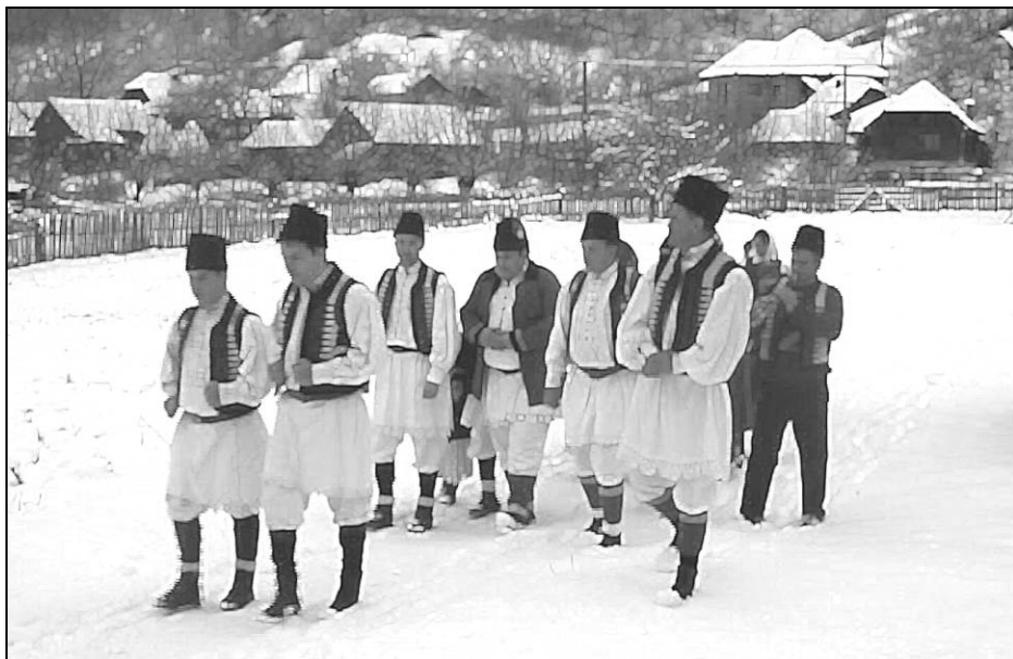
Fig. 6. Ceata colindătorilor din Runcu Mare (2014)