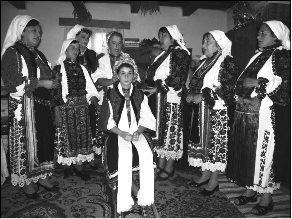
Fig. 18. Gătitul miresei și femeii cântând un cântec ritual specific momentului: „Cântecul miresei” (reconstituire) în satul Lelese (2015)