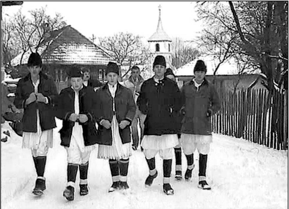
Fig. 9. Ceata de colindători din satul Lelese pe ulița bisericii (2005)