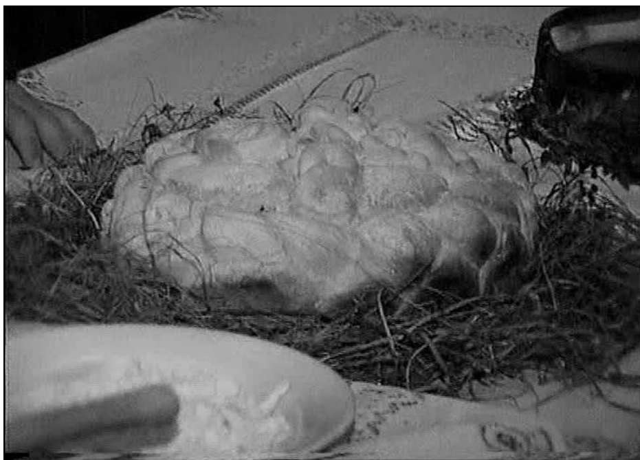
Fig. 7. Crăciunița – pâine rituală – așezată pe otavă în așteptarea lui Crăciun în satul Arăneș (2005)