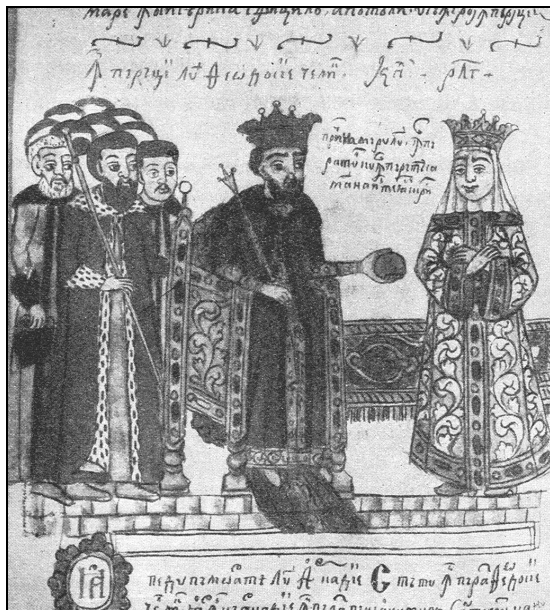
1. Pricina mărilor. Miniatură din secolul al XVIII-lea