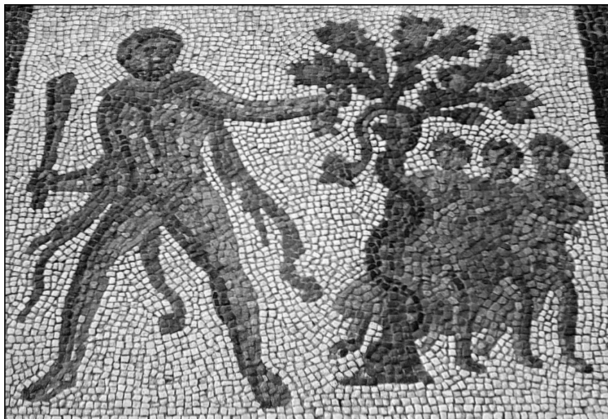
2. Hercule în Grădina Hesperidelor. Mozaic din secolul al III-lea