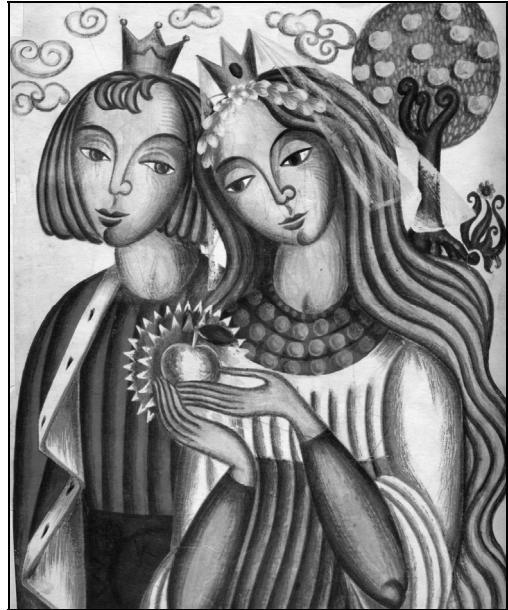
4. Prâslea cel Voinic și merele de aur (Done Stan)