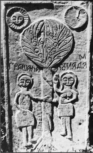
3. Piatră funerară. Șcheia – Iași