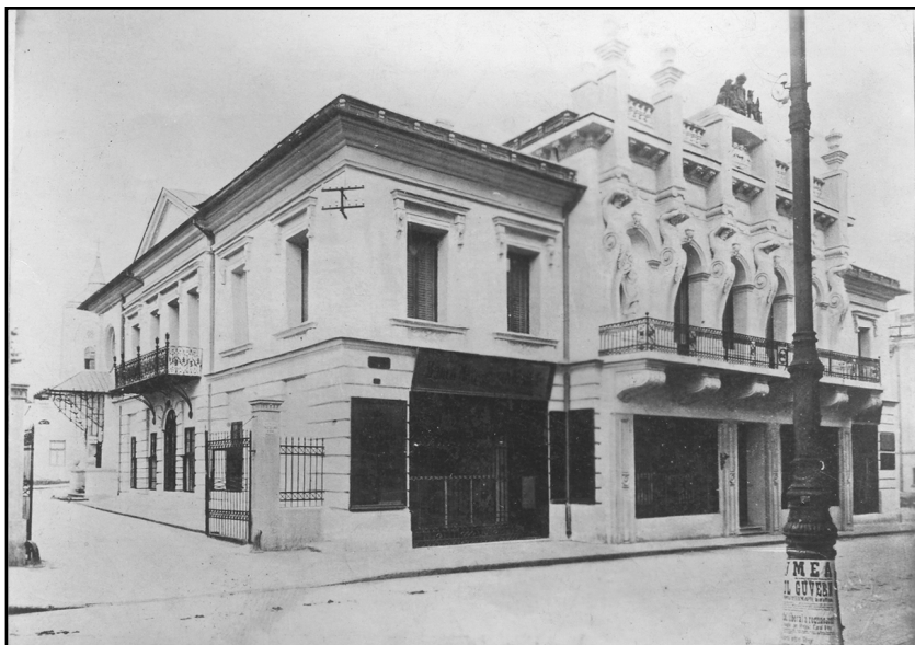
Fig. 2. Al doilea sediu: Palatul lui Al. I. Cuza, actualul Muzeu al Unirii (fotografie din 1951) (fototeca MEM)