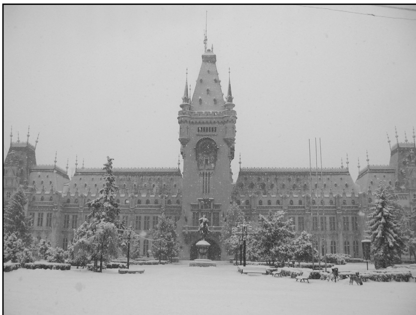
Fig. 3. Al treilea și ultimul sediu: fostul Palat Administrativ și de Justiție, actualul Palat al Culturii