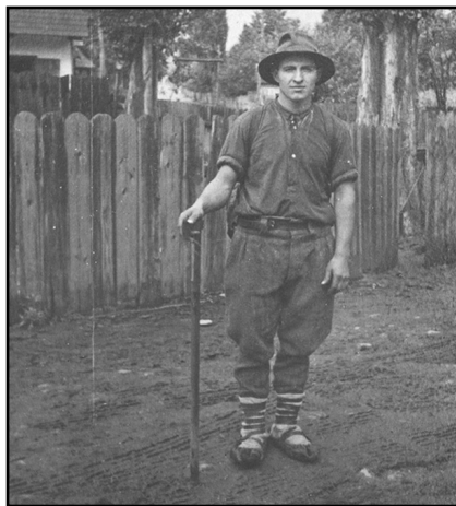
Fig. 15. Cioban din Galu-Neamț (1955)