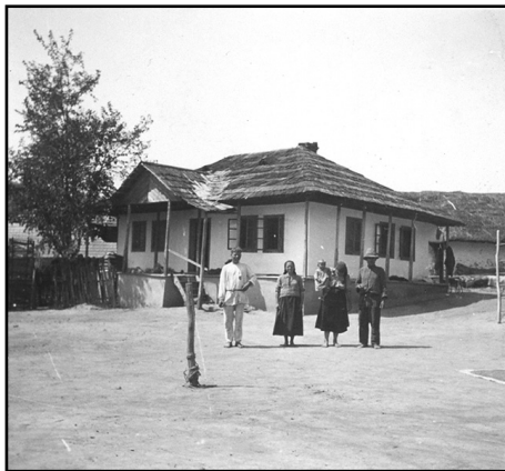
Fig. 11. Casă din Sadova-Lăpușna (1943; foto: I. Chelcea; fototeca MEM)