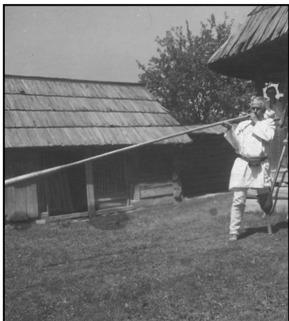
Fig. 14. Buciumaș din Moldova Sulița-Suceava (1954; foto: I. Chelcea; fototeca MEM)