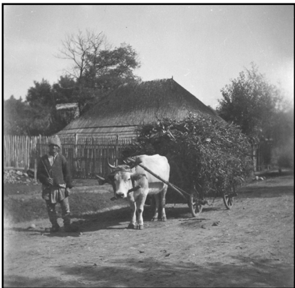
Fig. 12. Gheorghe Pătrașcu din Somușca-Bacău lângă carul tras de o vacă înjugată (1951)