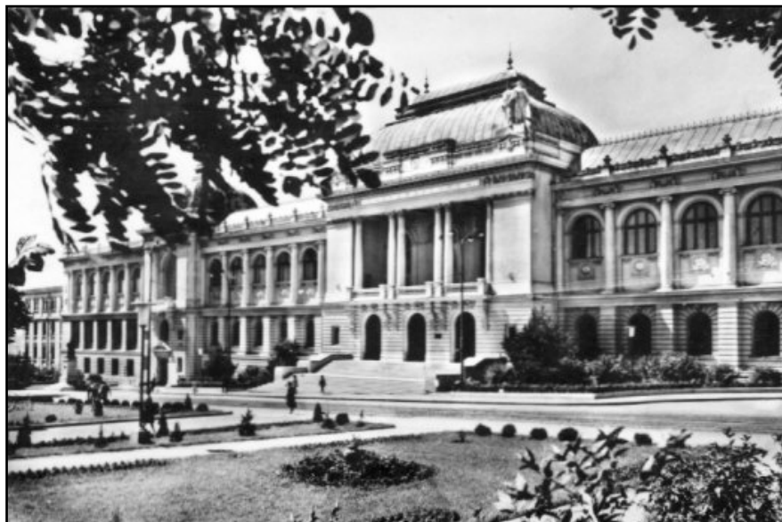
Fig 1. Primul „sediu” al Muzeului Etnografic al Moldovei: Universitatea „Cuza Vodă”