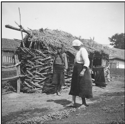
Fig. 10. Poiată din Călinești-Bălți (1943)