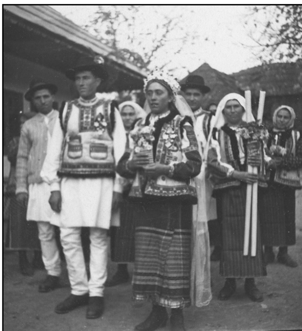
Fig. 18. Alai de nuntă din Luizi Călugăra-Bacău (1956)