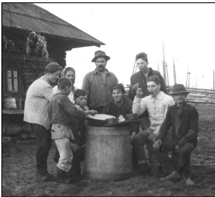
Fig. 16. Ciobani la masă; Brodina de Sus-Suceava (1956)