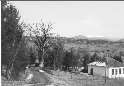
Fig. 5. Școala, gorunul și biserica din Vidra (locul de desfășurare al nedeii)