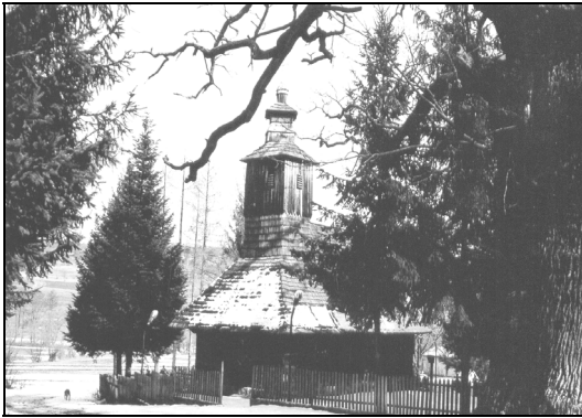
Fig. 4. Biserica și gorunul din Vidra (locul de desfășurare al nedeii)