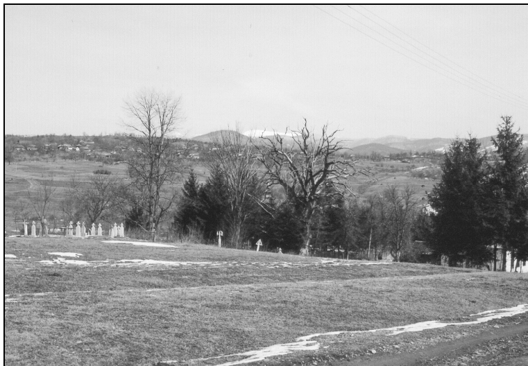
Fig. 3. Cimitirul și gorunul de lângă biserica din Vidra (vedere panoramică)