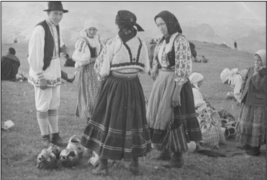
În târgul Găini, 21 Iulie 1935.