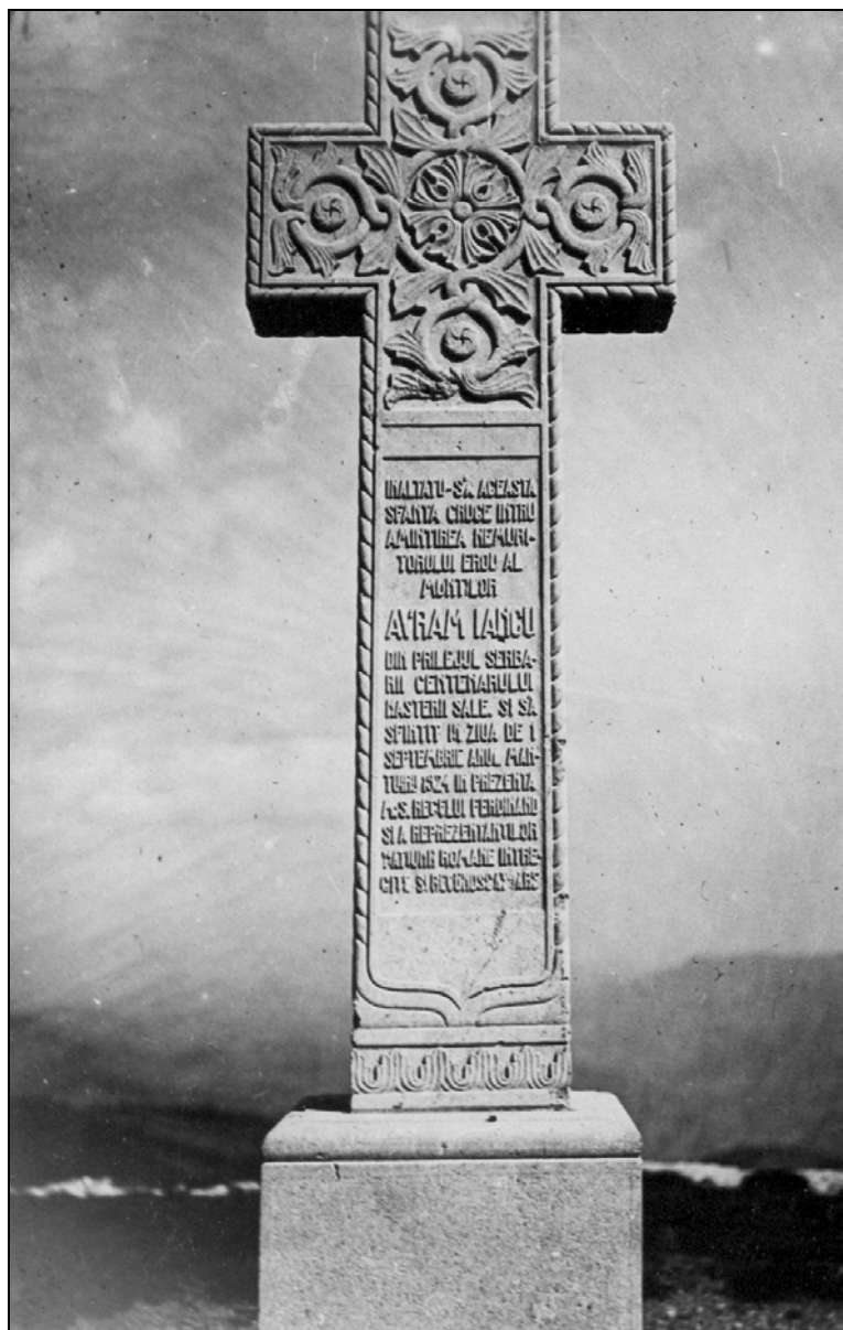
Croița lui Avram Iancu de pe muntele Găina, ridicată în 1924 Iulie 1933.