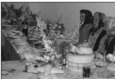
Capetele și trupul pomenii de 4 ani (se pot observa cinci capete după lumânările înfipte în ele, pentru 4 ani și al cincilea pentru toți morții)

Colacii, cu forme și reprezentări diverse, „conțin valori umane universale, care s-au păstrat aici într-un mod rar întâlnit în alte societăți și culturi!” după scrie Păun Es Durlîc în Albumul său dedicat colacilor. Prezentăm și noi câteva forme de colaci din Vlaole: