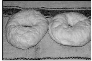
Capetele (merg câte două)