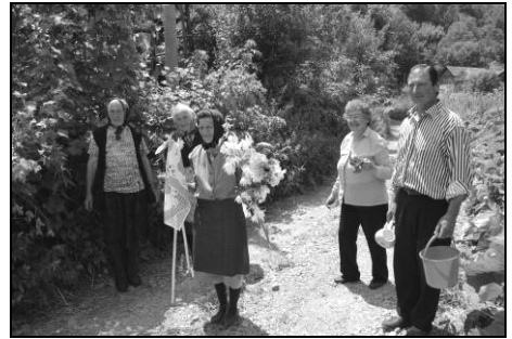
Bărbatul și cele patru femei, în drum spre pârâu

Ajungând la pârâu, femeile pregătesc pomana, întinzând colacii pe un ștergar așezat pe malul pârâului. Proțapul se înfige în pământ, iar pe punce se pune un alt ștergar.