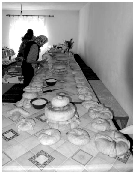
Aranjarea trupului pomenii

Întoarse acasă, femeile încep să așeze colacii pe masă, după o logică aparte, știută de către ele. Masa plină de colaci reprezintă trupul pomenii, având cap, coadă și umeri, fiind orientată cu capul către răsărit.