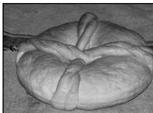
Pâinea de Dumnezeu

Colacii, cu forme și reprezentări diverse, „conțin valori umane universale, care s-au păstrat aici într-un mod rar întâlnit în alte societăți și culturi!” după scrie Păun Es Durlîc în Albumul său dedicat colacilor. Prezentăm și noi câteva forme de colaci din Vlaole: