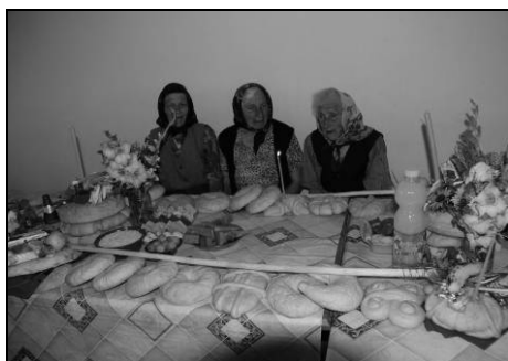
Bâtu este așezat de-a lungul mesei, sprijinit pe un colac numit umăr