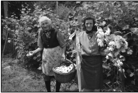
Două femei, una ducând coșul și lumânarea, alta ducând proțapul și punca

în Vlaole. „Se pune băt și colac și se chitește cu flori, cu dulcețuri [...] și se dă așa [...] la un copil, la o familie...” ca pomană. Un alt băț se pregătește pentru a servi de proțap, înfigându-se în malul pârâului, la slobozirea apei pentru mort: „Asta e proțap, când sloboadă apa, așa se pune [...] Și asta, bātu, iar așa se dă. Da ailalte (bețe) se pune în pomană, ete așa... [Despre culorile lânii (întâmplător roșu, galben, albastru)] așa mi-e drag, așa se face la noi la priveghi și mie mi-e drag așa, ete am pus așa. Se pune și mai multe soarte , ama eu n-am pus, baș atâtea, toate sorturile . Astea se pun și când moare omu, la cruce. Se duce și dincolo și dincolo [...] se pune la cruce, se zice la noi strămături ”.