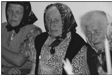
Cele trei femei cântând petrecătura