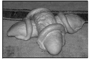
Cu capu legat