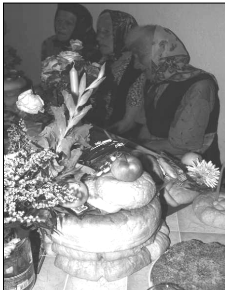
Capul pomenii, format din trei colaci, peste ei așezându-se cel numit vrumășel

În casă, trei femei cântă petrecătura timp de 13 minute 3 . La sfârșit rostesc: „Bogdaproste! Să fie lu tata de pomană!”. O femeie tămâie, cu mișcări circulare, având în mână un tămâielnic din lut ars.