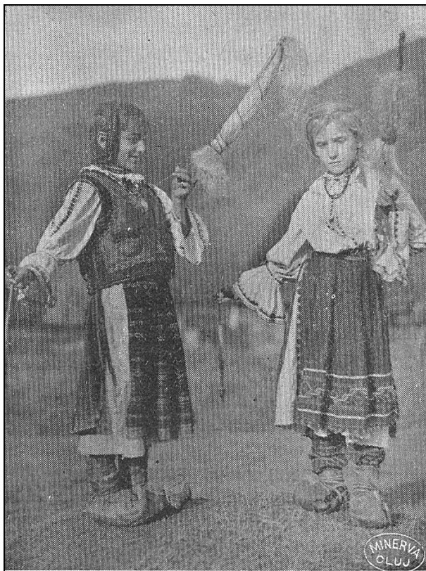
Fete din Hunedoara torcând

Rămâne stabilit: caracterul principal al însoțirii sub formă de împrumut, iar pe de altă parte, o ocazie nimerită a celor două sexe de aceeași vârstă de a se întâlni – ceea ce ne face să ne gândim și cu această ocazie la problema ceva mai complicată a asocierilor de tineri la poporul român, ținute în funcție de vârstă . Fără îndoială, hobștiile de tors, ce se făceau în Mușcel nu demult, au fost una din formele de însoțire care vizează această problemă. Un mod de trai în comun și una din acele forme de întovărășire cu un scop practic și totodată distractiv care atrage pe cei de o vârstă – fete și băieți. Se satisface, astfel, una din acele forme de asociere simpatetică , așa cum etnografiile-sociologii obișnuiesc a le numi. În felul acesta ia naștere o instituție socială de seamă în lumea din partea locului, care umple un gol simțit în sărăcia de relații mai strânse a lumii rurale. Neîntrebuințarea cânepii, bumbacului, a dislocat și această înjghebare socială de ordin popular – apoi prefacerile de tot felul care ne inundă, ceea ce îmi prilejuiește încheierea de mai jos.