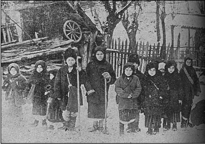
Colindatul în satul Boteni – Mușcel.