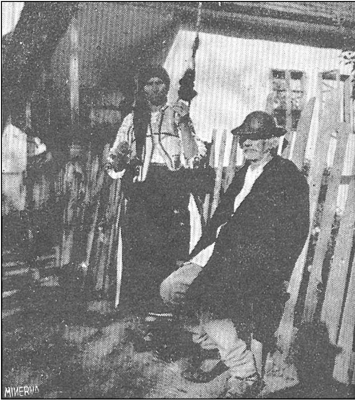
În fața casei. Comuna Corbi, Mușcel

Se înțelege, părăsind vechile deprinderi din moși-strămoși, formele de viață streină se înstăpânesc printre noi ca la ele acasă, pentru a rămâne desfigurați în imaginea pe care va trebui să o aducem ca ofrandă posterității – în raport cu celelalte popoare care înțeleg nu numai să-și păstreze ceea ce au, dar, ce-au pierdut, să-și refacă . Oare hobștiile de tors , așa cum au dispărut cu desăvârșire în unele părți, nu ne-ar putea servi ca exemplu de starea în care ne aflăm în privința instituțiilor noastre sociale? Bunele românce cred că vor avea ceva de făcut .