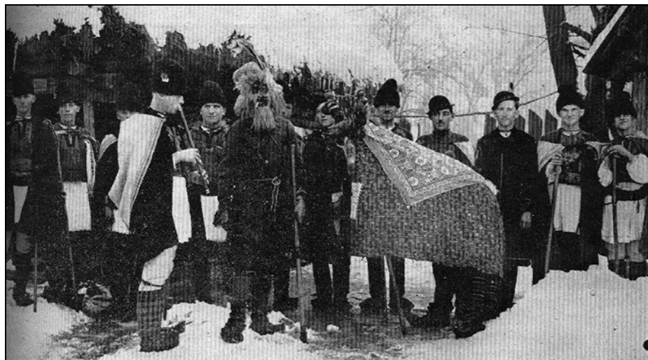
Turca (capra, brezaia).

E adevărat; omul se duce la biserică, la care ia parte întreaga comunitate; ascultă slujba religioasă și se întoarce mulțumit acasă că și-a făcut datoria față de el și de Dumnezeu. Acasă se înfruptă numaidecât din ce mereu același și același Dumnezeu a dat în cursul anului; altceva însă îi înflorește sufletul, cu această ocazie. Biserica îl leagă de existența divină; îl transpune într-o lume eternă – de pace și „bună învoire” – altceva face însă farmecul sărbătorilor!