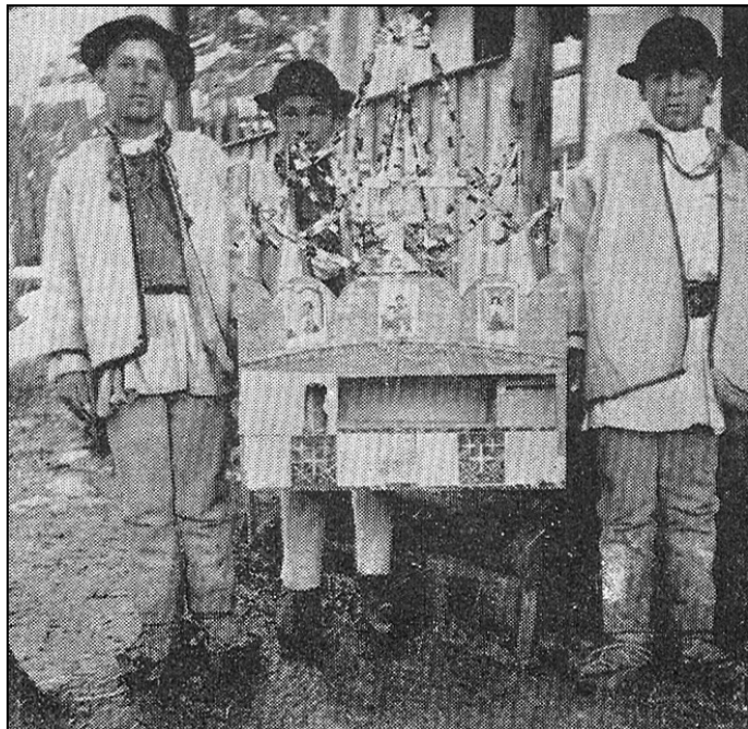
Vifleim cu papuși (Țara Hațegului). Colecția Muzeului Etnografic, Cluj

așeze la locul lor în societate. Influența modernă a deformat pur și simplu societatea în care se găsea încadrat tineretul acesta.