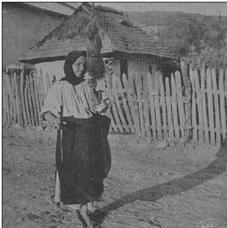
Țărană din Mușcel, comuna Corbi, torcând