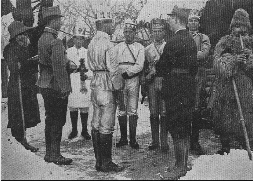
Irozii din Peșteana (Țara Hațegului). Colecția Muzeului Etnografic, Cluj