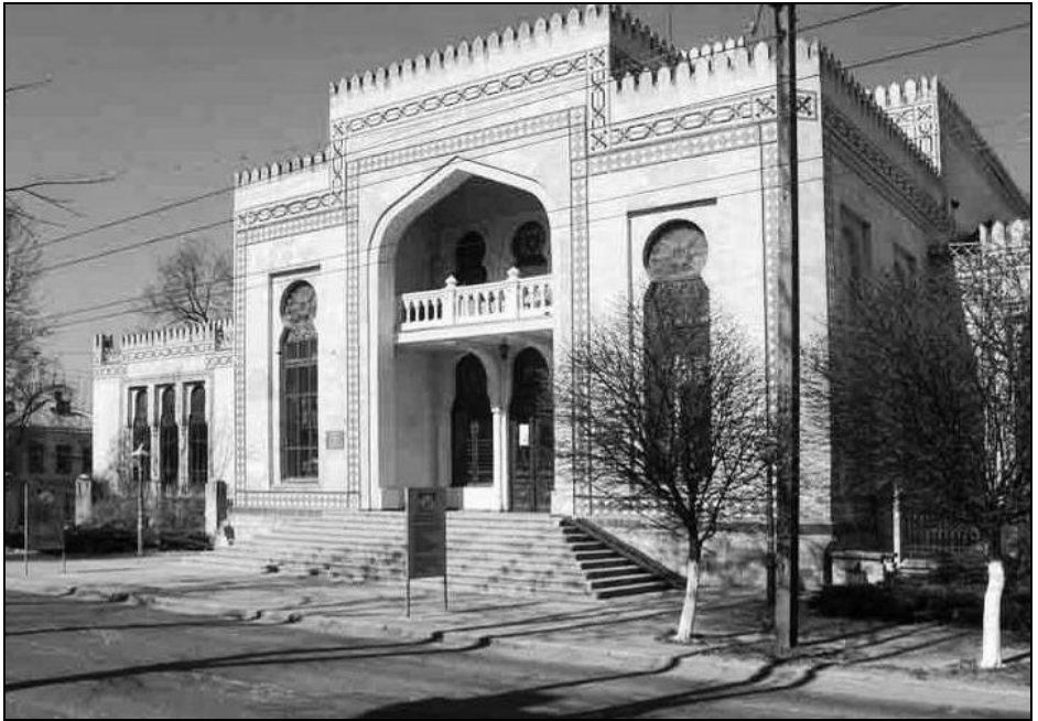
Muzeul Național de Etnografie și Istorie Naturală, Chișinău – 125