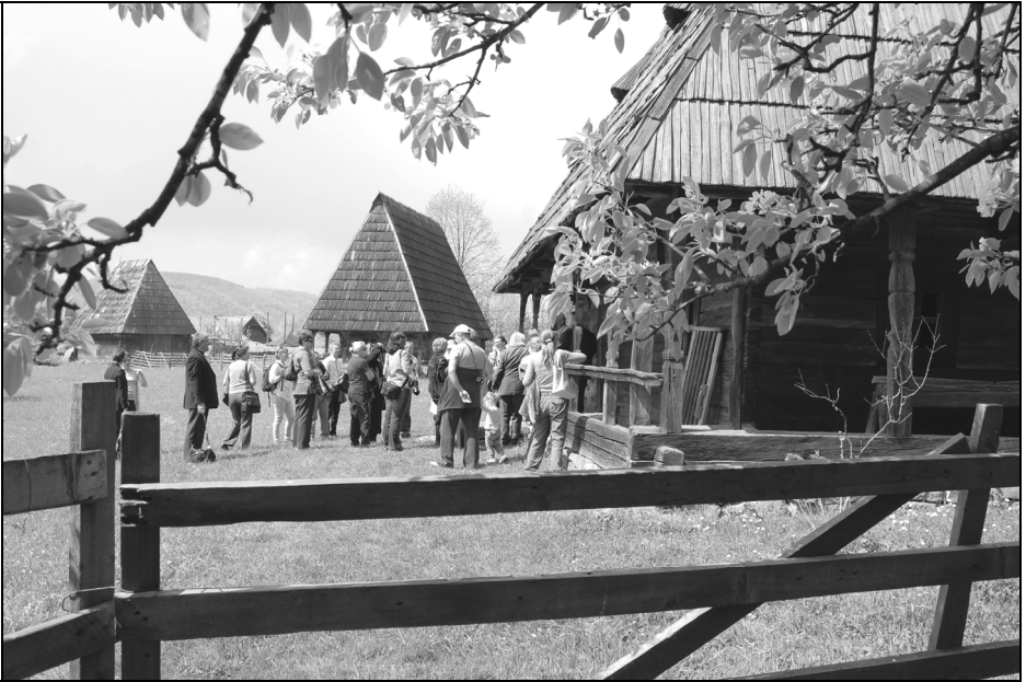
Imagini din Muzeul Satului Maramureșean