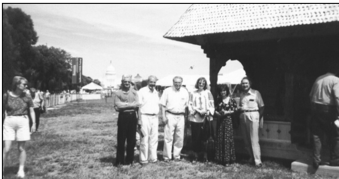
La Smithsonian Folklife Festival (Washington, 1999)