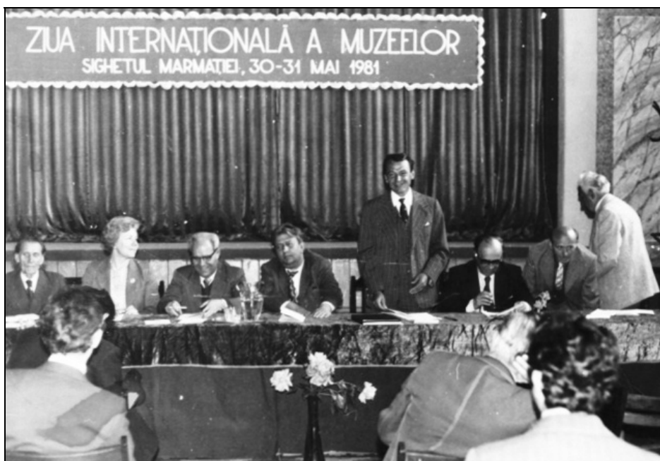
Sesiunea solemnă de deschidere a Muzeului Satului Maramureșean (30 mai 1981)