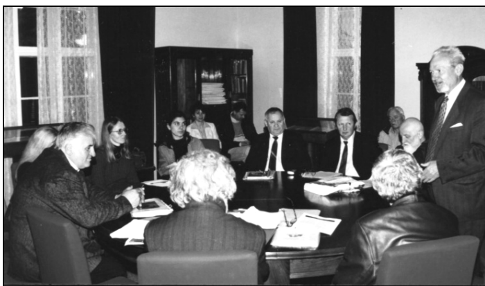
Vorbind la un simpozion la Sala Societății „Dragoșiana” din Casa Mihalyi de Apșa