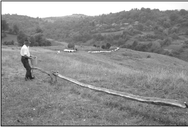
6. Păcurar punând sare pentru oi în vălău (jgheab). Stâna satului Bunila, Ținutul Pădurenilor; august 2009.