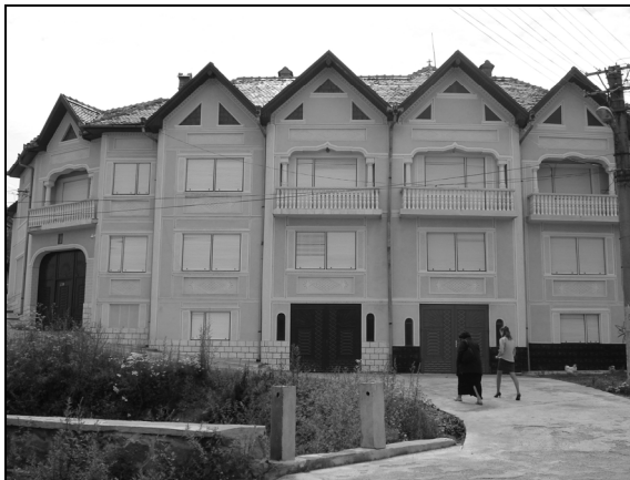
8. Casă de oier transhumant din Poiana Sibiului; iunie 2009.