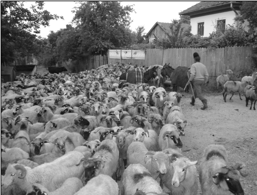
1. Turma lui Al. Oprescu din Novaci, în dimineața plecării la munte (Parâng); iunie 2009.