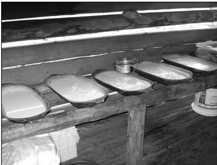
4. Lapte pus la smântănit în celarul stâniei Puru, Masivul Șureanu; iunie 2009.