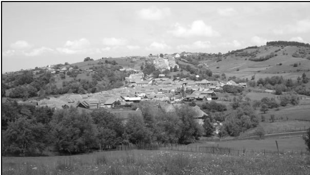
7. Satul de oieri Jina – Sibiu, 1.000 m altitudine; iunie 2009.