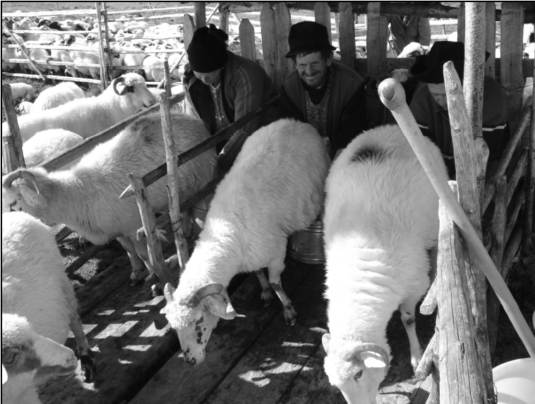
3. Mulsul oilor la stâna Puru din Masivul Șureanu, aparținătoare oierilor din Căpâlna – Alba; iunie 2009.