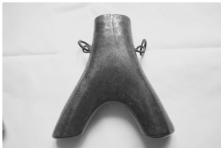
Fig. 4. Corn de praf de pușcă din Straja – Rădăuți cu decor solar, fitomorf (lalea), antropomorf și zoomorf (coarne de berbec) pe colierul de alamă din partea superioară și dinte de lup la baza țevii de scurgere.