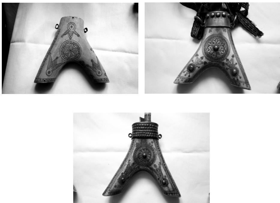
Fig. 2. Alături de rozeta solară apare pe aceste recipiente și motivul lalelei. Se remarcă, de asemenea, prezența bumbilor de alamă în relief.