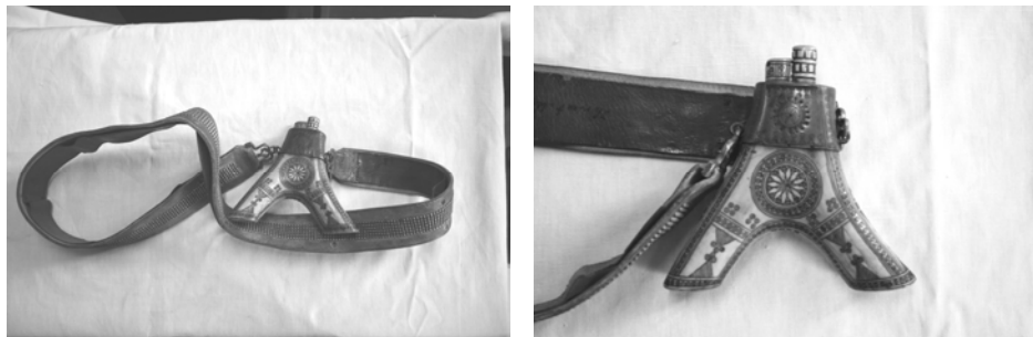
Fig. 1. Corn pentru păstrarea prafului de pușcă din Brodina – Suceava pe care se observă motivul solar, țeava de scurgere din os și brățara de aramă în partea superioară. Pe partea inferioară apare motivul antropomorf specific Moldovei de nord, triunghiul cu trei cerculețe în vârf. Aceleași motive apar ștanțate pe colierul de aramă care fixează țeava de scurgere. Cureaua din piele este ținută cu cositor.