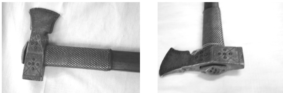
Fig. 6. Baltag din bronz din Ulma – Rădăuți cu motive incizate dintelui de lup, crucea solară din patru bumbi în relief și unul central. Orificiul de înmănușare este fixat cu o țesătură din fire de alamă (solzi).