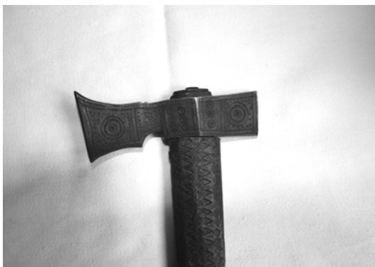
Fig. 7. Baltag din Breaza – Suceava. Prezintă ca ornamentalică spirala și dintelui de lup pe colierul de înmănușare.