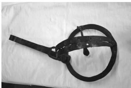
Fig. 5. Curse din fier pentru prins jderi și lupi provenind din Pârâul Fagului – Neamț. Se observă pârghia de susținere a arcului și dinții de pe ambele laturi ale capcanei, precum și suportul de tablă pentru momelă.