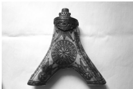
Fig. 3. Corn de praf de pușcă din zona Bacău. Un alt motiv ornamental incizat este simbolul solar reprezentat sub formă de melc sau de spirală.