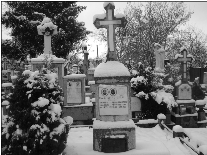
7. Mormântul familiei Neculau de la Cimitirul Eternitatea din Iași