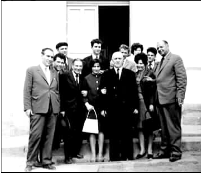
6. Sărbătorit la Ungureni, la 40 de ani de la înființarea Universității Populare (1967)