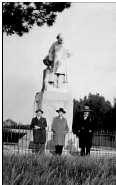
4. La Paris (1930) între doi prieteni