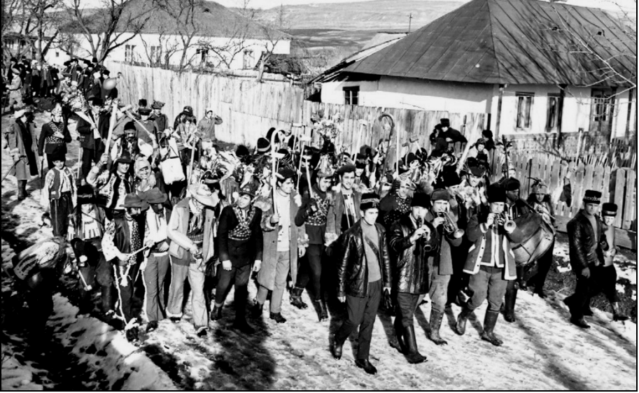
1. Partia (alai de mascați). Hârtop – Suceava