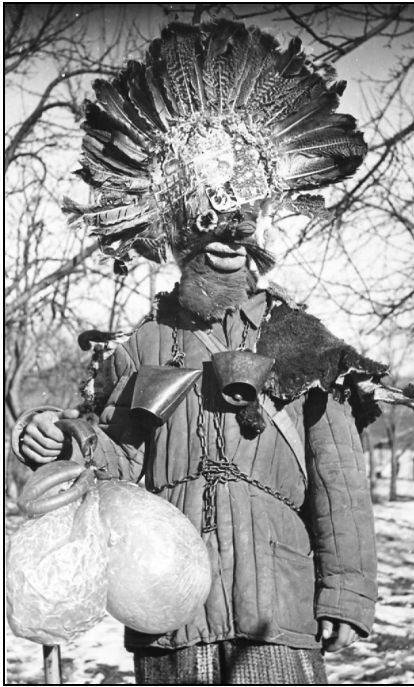
7. Căldărar. Preutești – Suceava