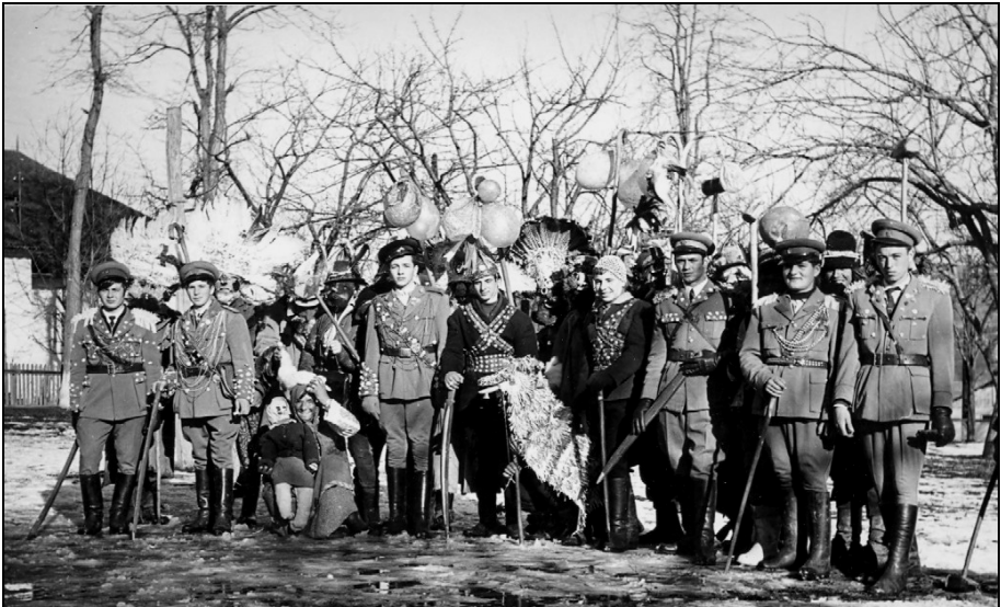
9. Alaiul Caprei. Leucușești – Suceava