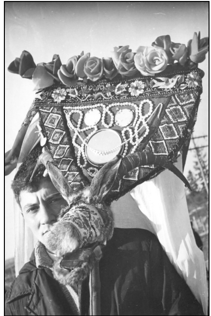
3. Mască de capră. Preutești – Suceava