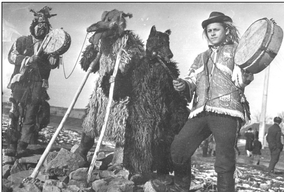
6. Măști de lup și urs. Preutești – Suceava