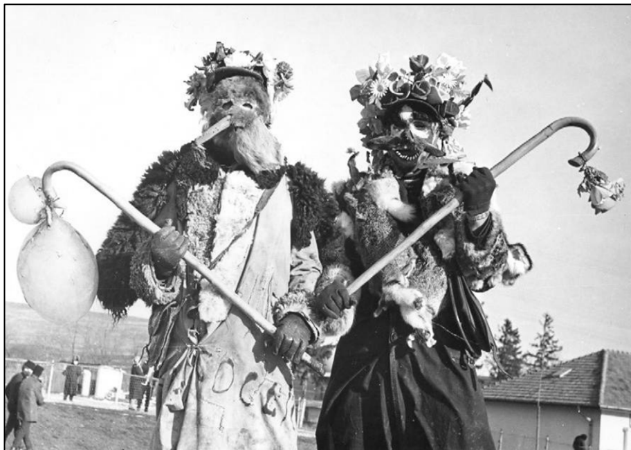
5. Mascăți la Urs . Preutești – Suceava