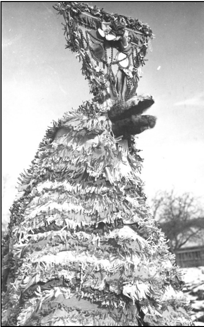
2. Mască de capră. Arghira – Suceava