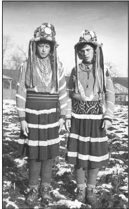
8. Mascăți. Leucușești – Suceava