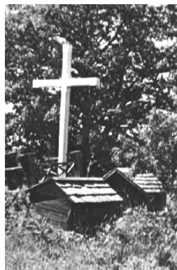
Căsuțe pe morminte , Madeline Island (Wisconsin), S.U.A.

Într-adevăr, căsuțele pe morminte și sicriile cu ferestre – pe care autorul le prezintă doar prin intermediul celor câteva exemple existente în lucrarea lui Simeon Florea Marian 22 – erau cândva mult mai