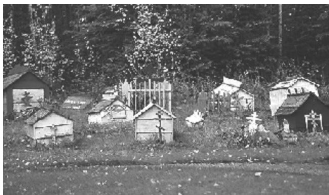
Căsuțe pe morminte , Eklutna, Municipality Anchorage, Alaska. Se observă crucile ortodoxe – ale rușilor de rit vechi – semn că practica era, la un moment dat, foarte răspândită

Noutatea studiului în discuție constă în relația ce se stabilește între structura porților monumentale și cea a mormintelor pe stâlpi . Conștient de impactul demersului său științific, Petru Caraman aduce cât mai multe dovezi care să-i susțină aserțiunile. Urmărindu-le cu atenție, ne dăm seama că acestea nu se limitează la analiza diferitelor tipuri de înmormântări suspendate, ci iau în discuție și succedaneele unor asemenea practici.