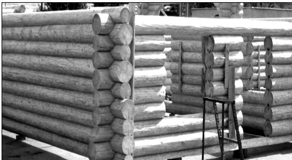
Etapă intermediară în ridicarea unei case din bârne îmbinate „stânește”