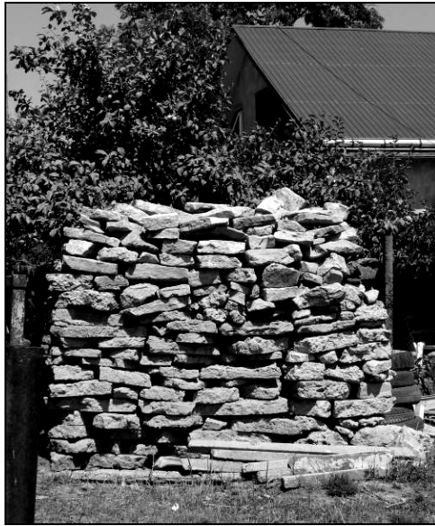
Piatră pregătită pentru temelie într-o gospodărie din Iazu Nou – Iași (2017)