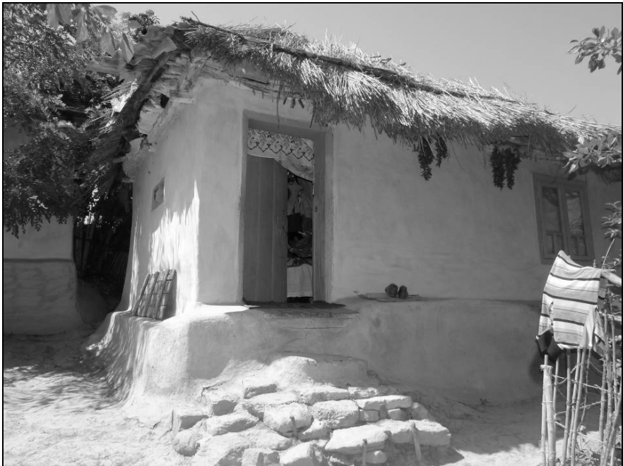
Construcție din Chișcăreni – Iași, în temelia căreia a fost pusă o găină vie (2017)