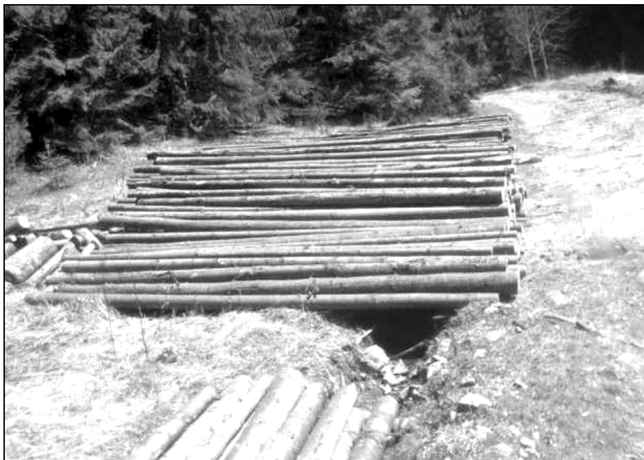
Trunchiuri de copaci pregătite în pădure pentru a fi folosite la construirea caselor