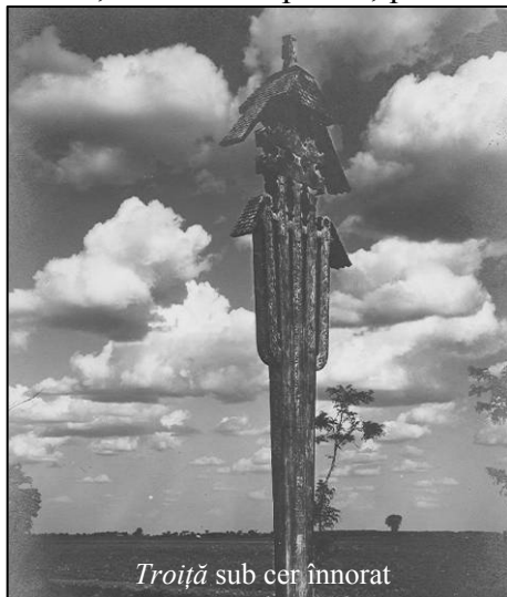
Troiță sub cer înnorat

Sunt și cazuri în care norii par să asculte de vrăjile făcute de cei care vor să alunge seceta. Într-un cântec pentru Dodolă , o variantă de Paparudă sârbească, fetele spun: „Străbaterm satul,/ norii aleargă pe cer,/ mergem mai repede,/ mai repede aleargă și norii;/ acum ne-au întrecut/ și-au udat grâul și vița” 58 . Dierii din Australia