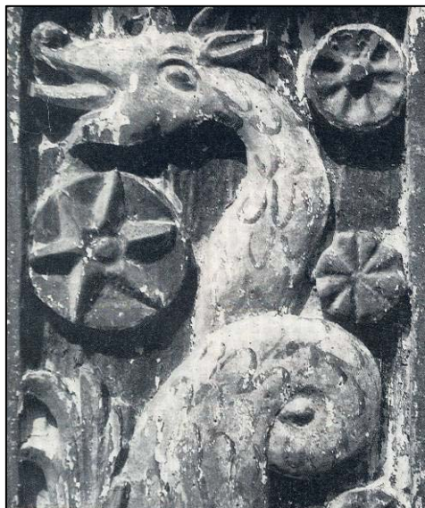
Balauri înlănțuiți . Detaliu. Apud Paul H. Stahl, Folclorul și arta populară românească , București, Editura Meridiane, 1968, pl. 10

În basmele fantastice, unde balaurul este cel care beneficiază de ajutorul voinicului, apare motivul îngurgitării și regurgitării acestuia de către demonul ofidian. În povestea Copilul și puiul de balaur , din