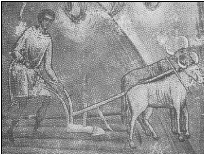
Fig. 3. Voroneț. Pictură exterioară, fațada nordică