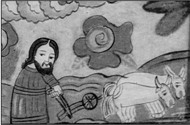
Fig. 4. Icoană pe sticlă. Detaliu (Irimie-Focșa, 1969, 60)