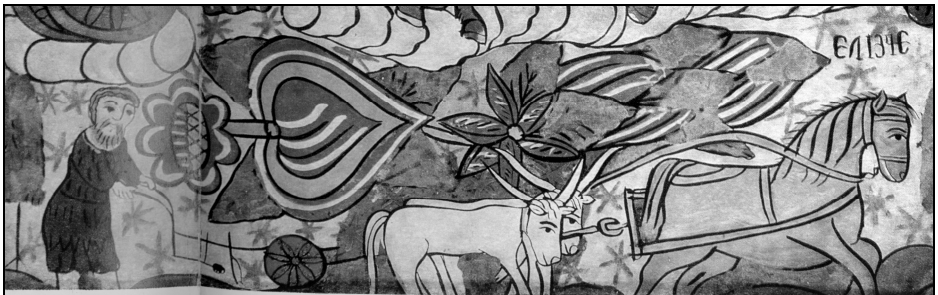
Fig. 5. Icoană pe sticlă. Detaliu (Irimie-Focșa, 1969, 130)