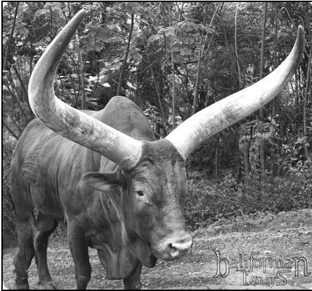
Fig. 1. „Să-și de-audă Boul Negru,/ Să-și de-audă și să-mi vie,/ Să-m formăm de pluguri dalbe...”