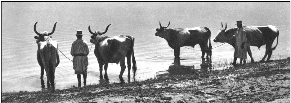
Fig. 6. La Dunăre (Kurt Hielscher, România , 1933, p. 57)