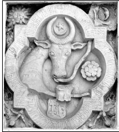
Fig. 2. Stema Moldovei (Claudiu Paradais, Comori , p. 611)