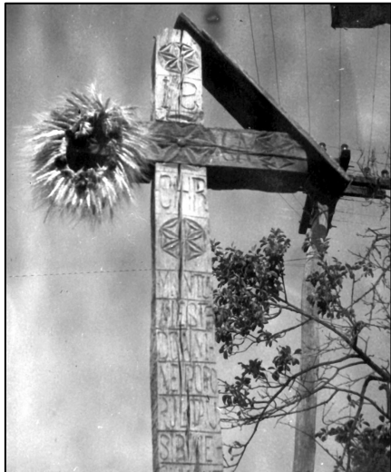
Fig. 5. Cruce cu cunună (Brazi – Gura Honț, județul Arad)

unde a tras plugul cea din urmă brazdă, având aceeași semnificație de continuitate 31 . În alte părți, cununa este prinsă de brațul unei troițe (cruci) aflată în aer liber (fig. 5).