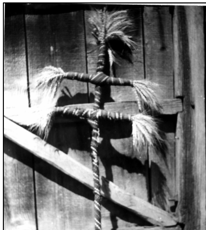
Fig. 3. Buzdugan (Drăguș, Țara Făgărașului)

Nu numai cununa astfel „alduită” reprezintă simbolul unui an bogat, ci și „buzduganul”, așa cum se obișnuiește a i se spune aceluiași obicei în Streza – Cârțișoara, de exemplu 30 . Probabil, s-a făcut și în alte părți (de exemplu, în Viștea de Sus, Făgăraș). Buzduganul se păstrează în podul casei până anul viitor. De astă dată, spicele de grâu nu mai sunt aranjate în cunună, ci în formă de cruce, cu spicele în afară (fig. 3).