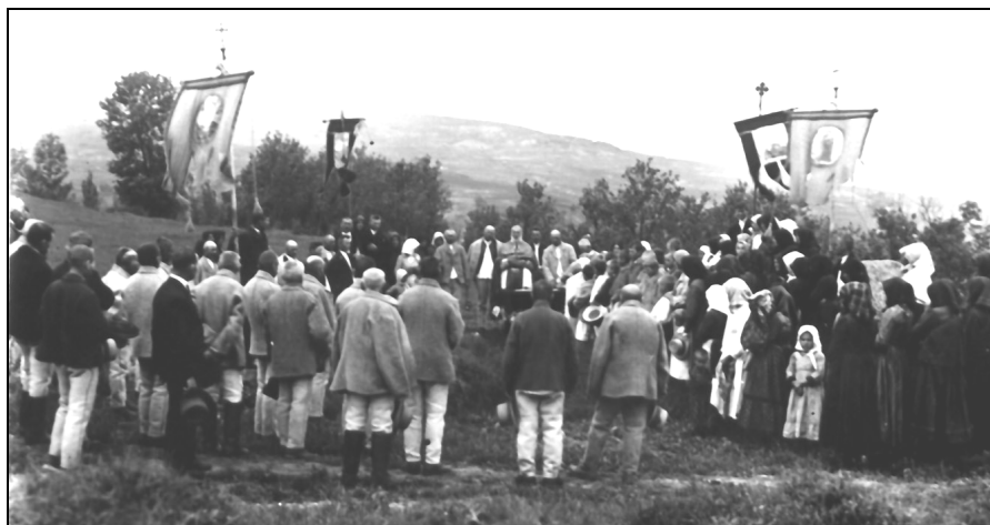
Fig. 2. Slujbă religioasă în aer liber (Lujerdiu – Someș) (foto: Ion Chelcea, 1932)

În multe locuri, pentru asigurarea unei recolte bogate, se recurgea și la alte practici, de multe ori combinate (contaminate) – ca origine și chiar ca funcțiune –, conținând elementele creștine și precreștine în același timp. Astfel, în satele de prin părțile Aradului, a doua zi de Rusalii, ieșea preotul cu crucea la holde, cu „baldachin” și „prapori”, purtați de cei mai de frunte feciori din sat. Cu această ocazie se împleteau cununi de grâu, ce erau agățate pe crucea praporilor și de baldachin 20 . La fel se întâmpla și în Lujerdiu (Someș) 21 (fig. 2). În Mehedinți, aceste procesiuni erau cunoscute sub denumirea de „rugă” și se organizau, de regulă, la un râu sau o fântână pentru a aduce ploaie.