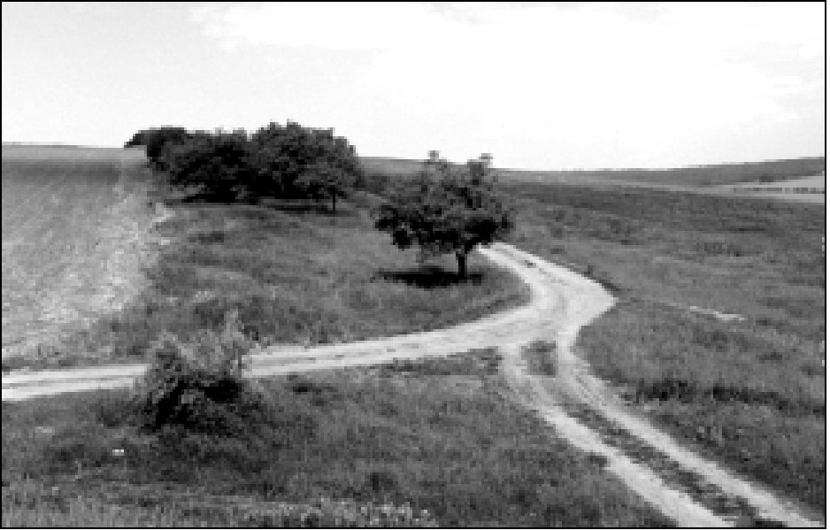
Fig. 1. Tabu spațial – întreținerea drumurilor