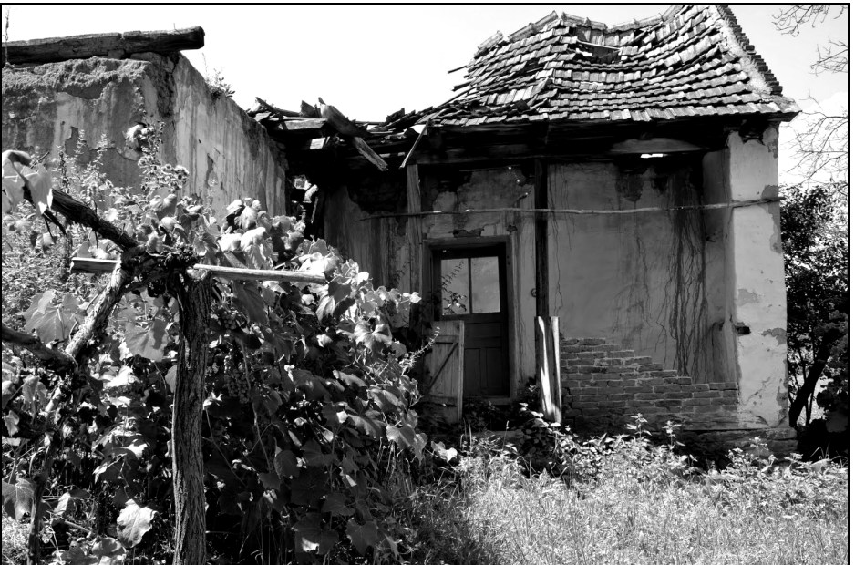
Fig. 2. Tabu spațial – casa părăsită