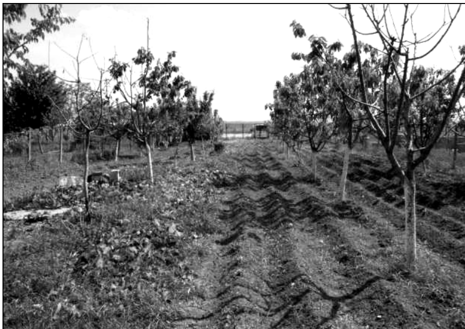
Fig. 3. Tabu spațial – livada