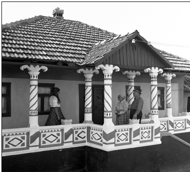
1. Brănești, Orhei – Republica Moldova