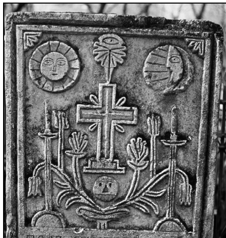
3. Chișinău. Cimitirul din str. Armeană (Foto E. Bâzgu, 1984)