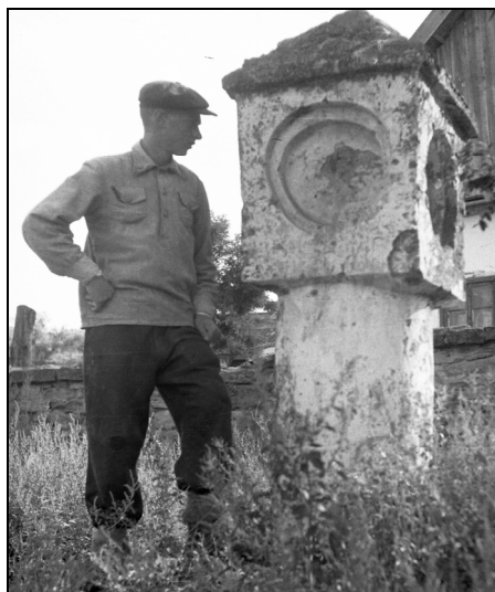
4. Căușeni, Republica Moldova (Foto I. Suhov, 1954)