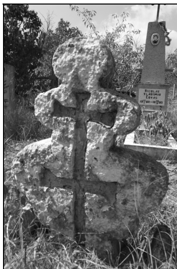
5. Purcari, Ștefan Vodă –Republica Moldova