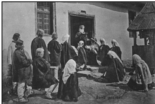
Molifta premergătoare botezului colectiv în Drăguș.

Noul născut, după ce moașa îi tăia buricul pe un „resteu de jug” („ca să fie tare, «trăgător» cum trage boul la jug” 18 ), era ridicat spre cer și i se făcea o urare de către moașă cu referire la viitorul ce-l așteaptă. Acest act simbolic reprezenta de fapt primirea, „încadrarea noului născut în colectivitatea socială căreia îi aparține și anume – neamul” 19 . Chiar dacă