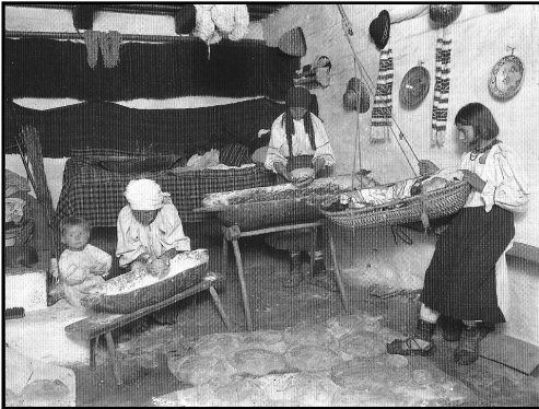
Leagăn la grindă. Drăguș. Colecția Muzeului Țăranului Român

Copilul nou născut era ținut în leagăn sau în copaiie. Leagănul descris de Del Chiaro este același tip ce se găsea și în casele țărănești, doar calitatea pânzeturilor folosite fiind alta. Având puteri apotropaice, culoarea roșie este folosită și pentru apărarea nou născutului, fie că este un fir de lână roșie prins de mânăța micuțului sau de scufiță, fie scutece și învelitori ce conțin decorații de culoare roșie. Și în foaia de zestre a domniței Maria, fiica lui Petru Șchiopu, apare trecut un „acoperământ de leagăn din pânză lucrată cu mătăsă roșie și altele de-aceeași