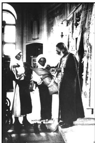
Prima împărtașanie a copilului la botez. Colecția Muzeului Țăranului Român

Noul născut era integrat în colectivitatea tradițională și prin petreceri care implicau întreg neamul. Este împământenit obiceiul ca noul născut să fie botezat de nașii de cununie ai părinților. Prin Moldova se mai practica și obiceiul „nașului din drum” mai ales pentru familiile în care copiii mureau de mici. Moașa lua pruncul și-l ducea la poartă, iar prima persoană care trecea pe drum era întrebată dacă nu dorește să-l boteze. Legat de sănătatea copilului se mai practica și ritul de „vindere a copilului pe fereastră” unei femei cu copii sănătoși, act prin care i se schimba totodată și numele. De Ovidenie (Intrarea Maicii Domnului în