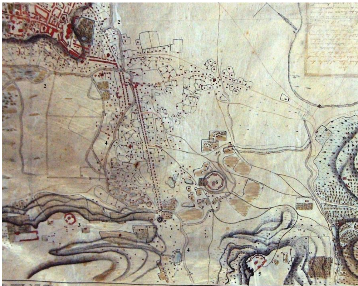
Fig. 2. Zona de sud a orașului Iași la începutul secolului al XIX-lea. Prelucrare după planul orașului întocmit de inginerul Joseph de Bajardi, în anul 1819: 1. Curtea domnească; 2. Râul Bahlui, 3. Mănăstirea Galata; 4. Râul Nicolina; 5. Mănăstirea Cetățuia; 6. Mănăstirea Frumoasa; 7. Probabil palatele domnești de la Frumoasa