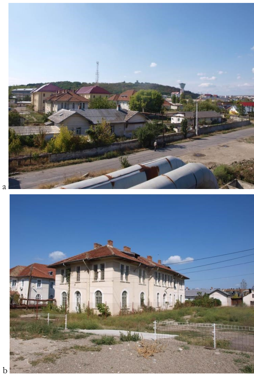
Fig 5. Grup de clădiri aflate la răsărit de mănăstirea Frumoasa și la poalele dealului Cetățuia. Vedere generală (a) și detaliu (b)