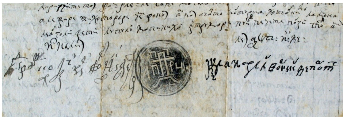
Fig. 4. Documentul din 1780 iunie 25 (detaliu)