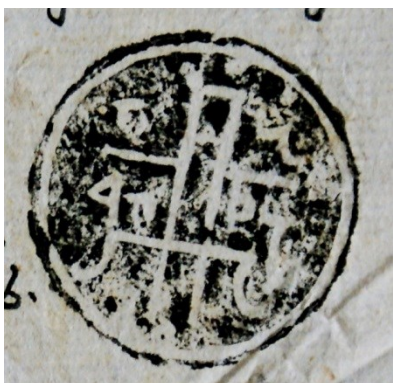
Fig. 2. Documentul din 1780 mai 22 (sigiliul Porții Domnești)