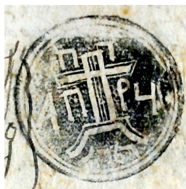
Fig. 3. Documentul din 1780 iunie 25 (sigiliul Porții Domnești)