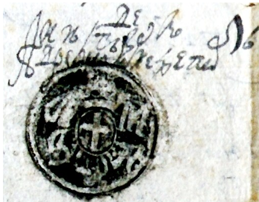
Fig. 7. Documentul din, 1785 iulie 24 (sigiliul lui Andrei, vornicul de poartă)