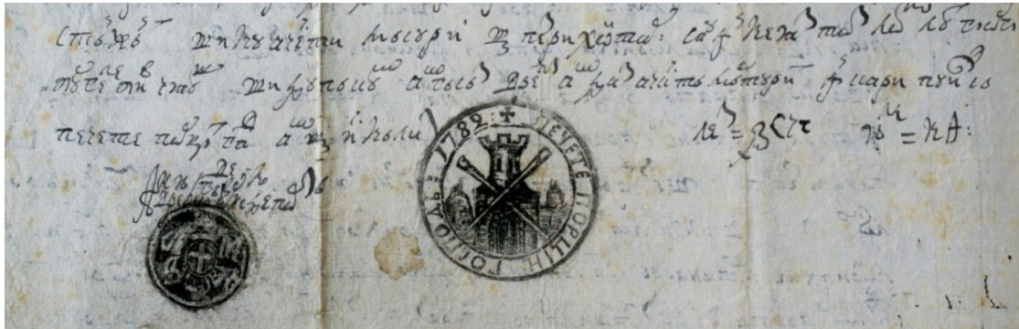
Fig. 6. Documentul din, 1785 iulie 24 (detaliu)