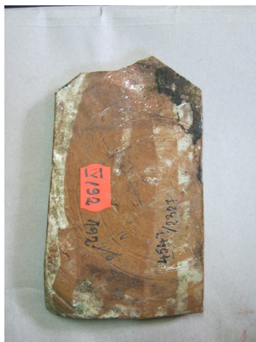
Fig. 2. Pomelnicul de la biserica din Rediu