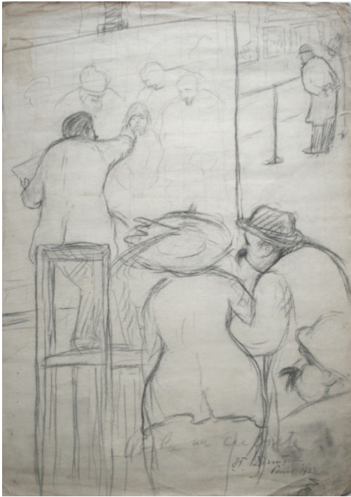
Fig. 9. Desen (Paris, 1913)