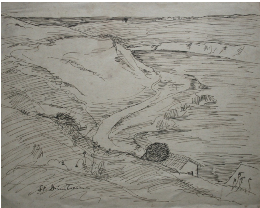
Fig. 21. Valea Bahluiului (2)