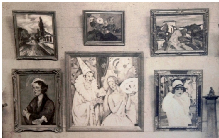
Fig. 17. Lucrări expuse în Sala „Ileana” (1926)