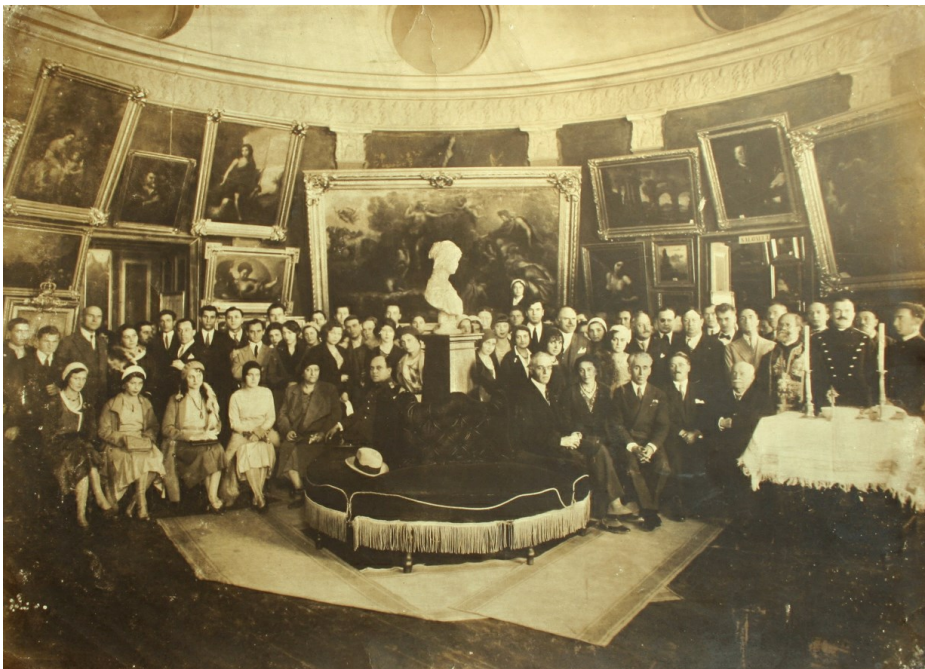
Fig. 6. Inaugurarea Academiei de Belle Arte Iași, 1927 (Rotonda Academiei Mihăilene)