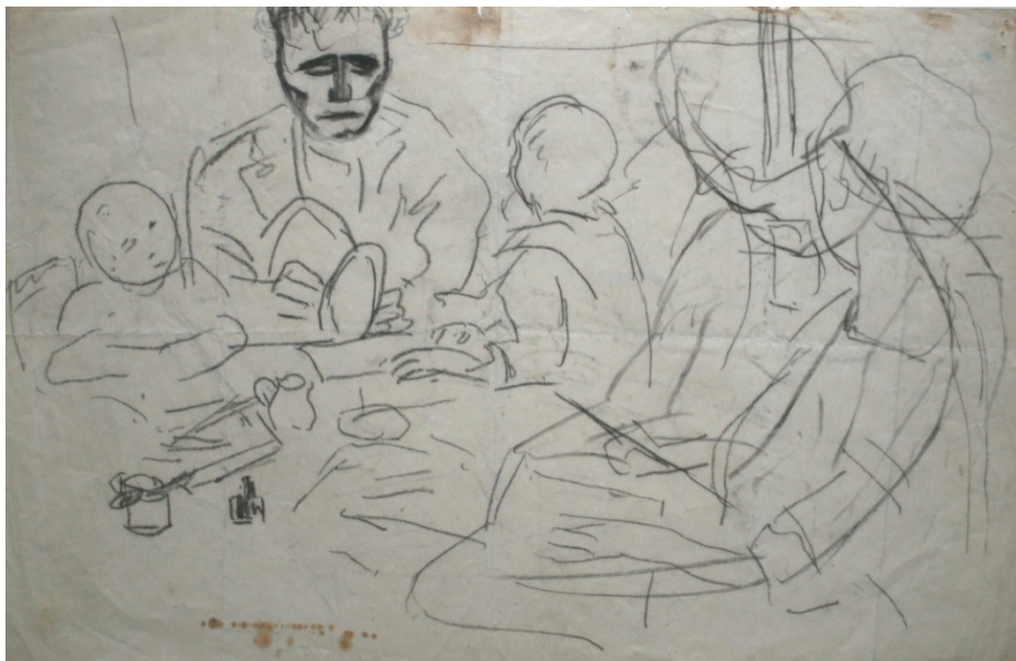
Fig. 19. Șt. Dimitrescu, Cină în familie