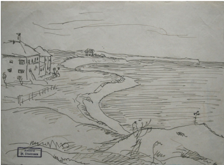
Fig. 20. Valea Bahluiului (1)