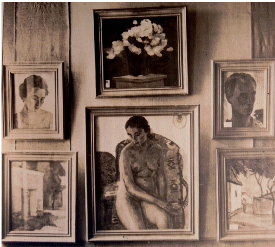
Fig. 18. Lucrări expuse în Sala „Ileana” (1926)