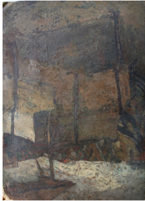
Fig. 10. Morții de la Cașin – schiță de culoare (detaliu)