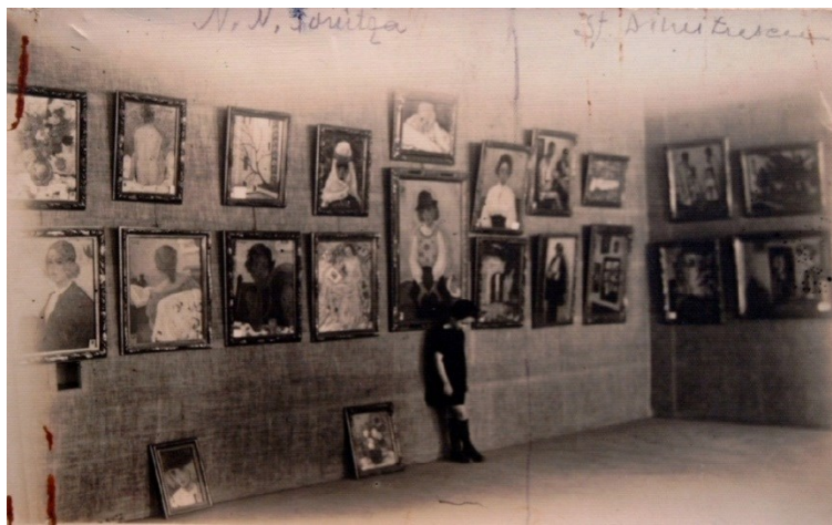
Fig. 16. Lucrări de Șt. Dimitrescu și N. Tonitza, Sala „Ileana” (1926)