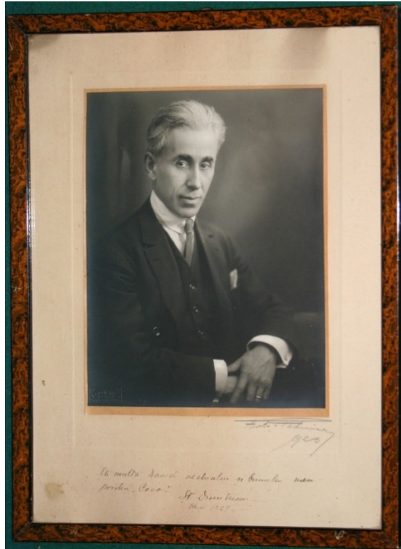
Fig. 5. Șt. Dimitrescu foto (1920) cu autograf