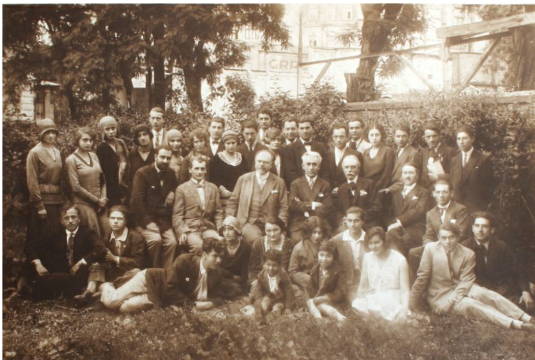
Fig. 7. Artistul împreună cu un grup de studenți și elevi în grădina Academiei de Belle-Arte Iași