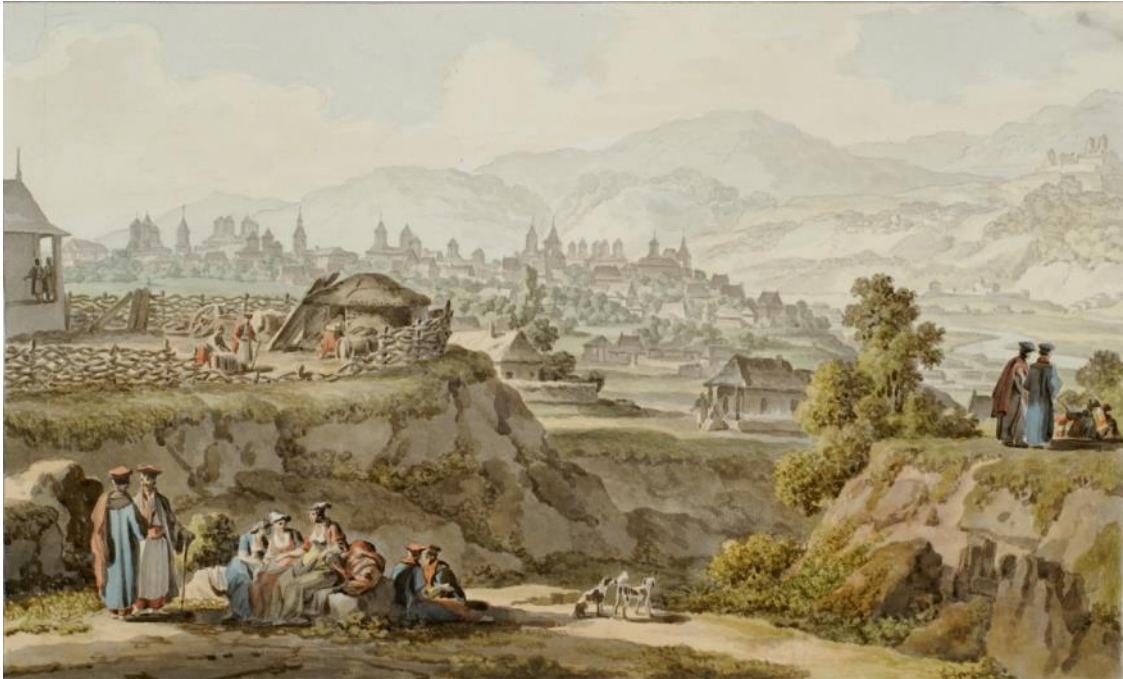
Fig. 1 – M.M. Ivanov, Orașul Iași văzut dinspre vest. Râpa Galbenă (1790)