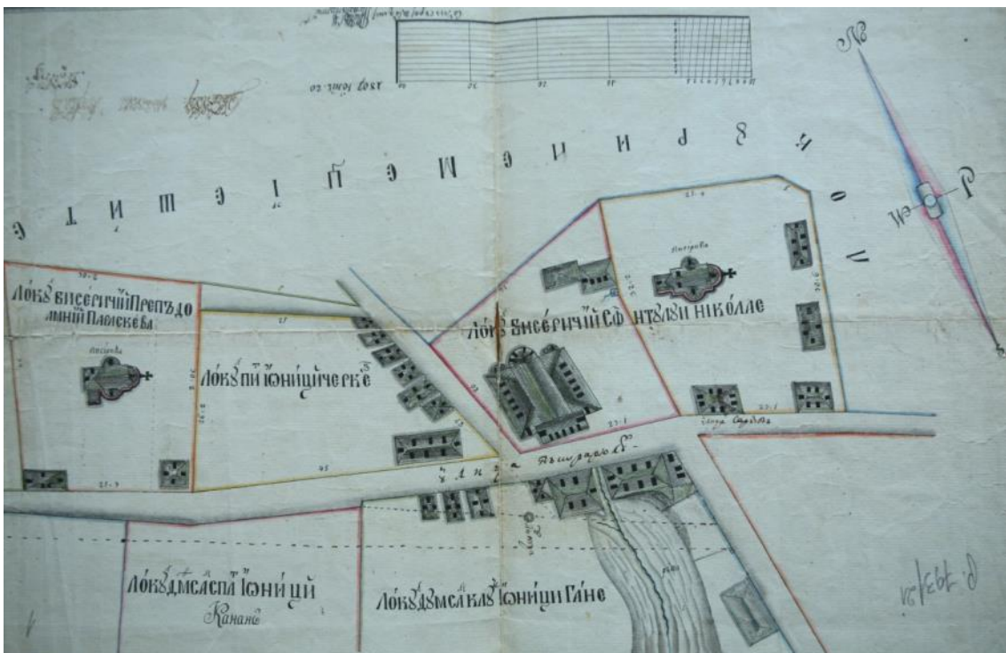
Fig. 2 – Proprietățile Bisericii „Sf. Nicolae cel Sărac“ la 1807. Piața „Mihai Eminescu“