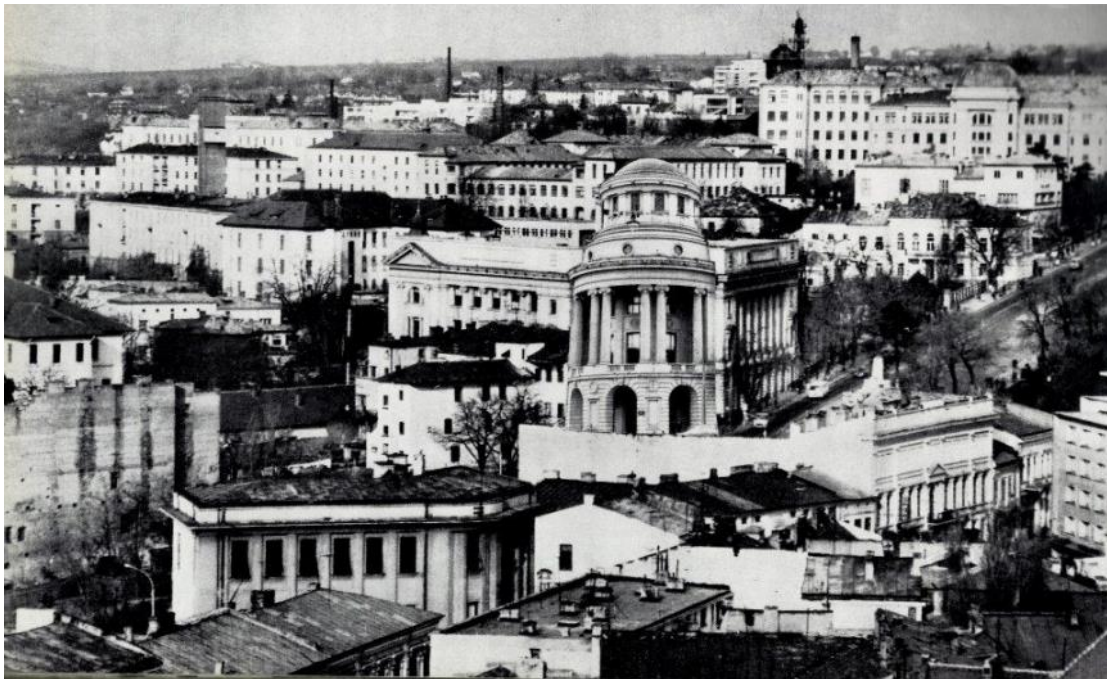
Fig. 4 – Piața Tineretului din Iași, 1971