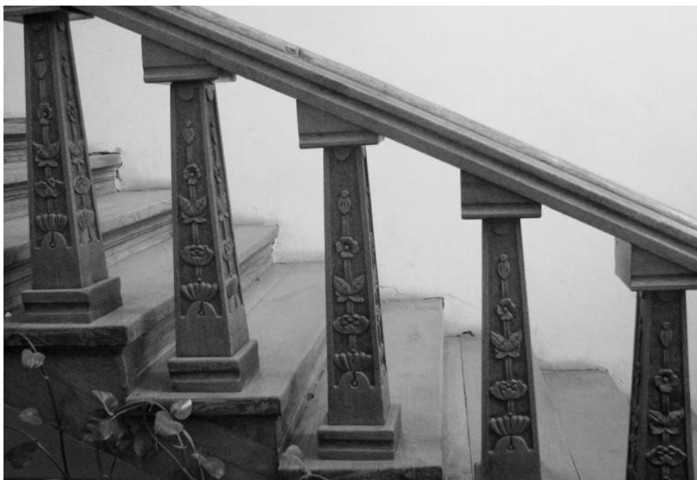
Fig. 7 – Ornamentația scării interioare