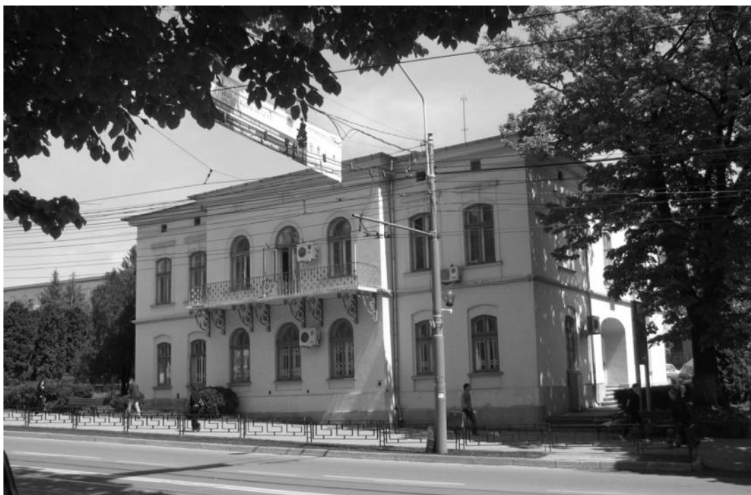
Fig. 2 – Casa Mârzescu, fațada dinspre Bd. „Carol I” (Copou)