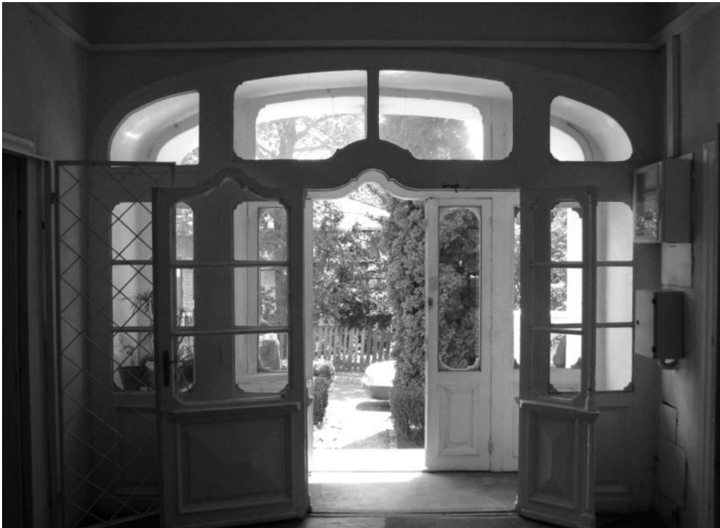
Fig. 6 – ieșirea principală, dinspre vestibule