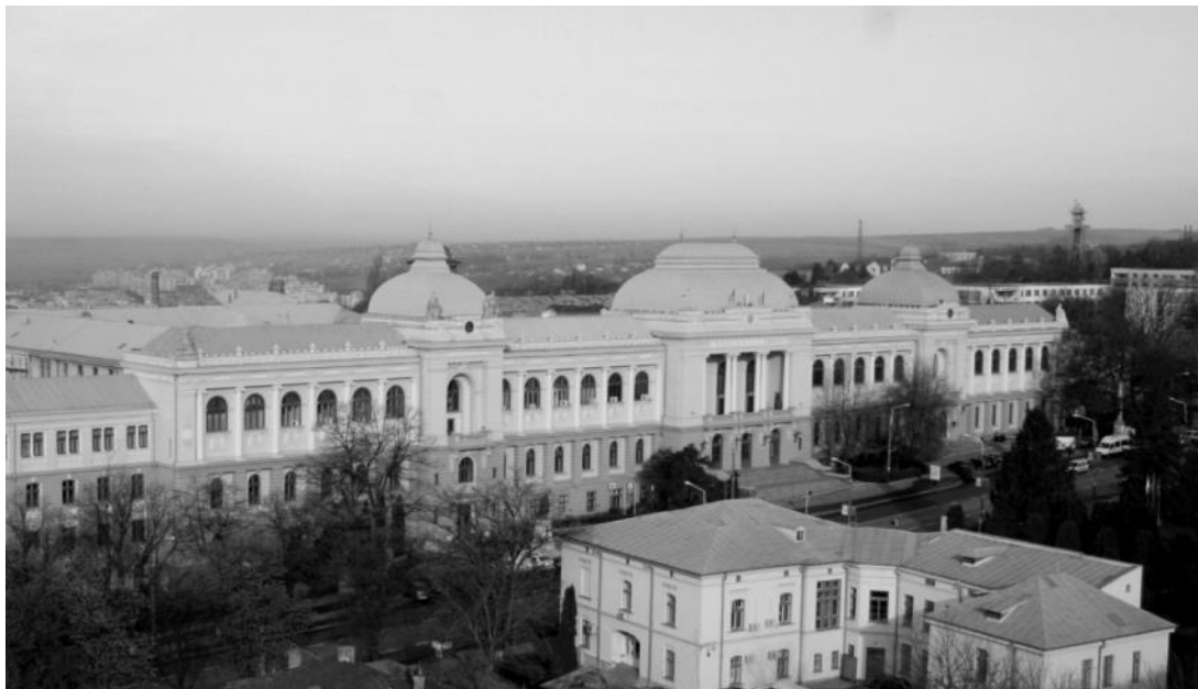
Fig. 1 – Casa Mârzescu, Corpul „G” al Universității „Alexandru Ioan Cuza” din Iași