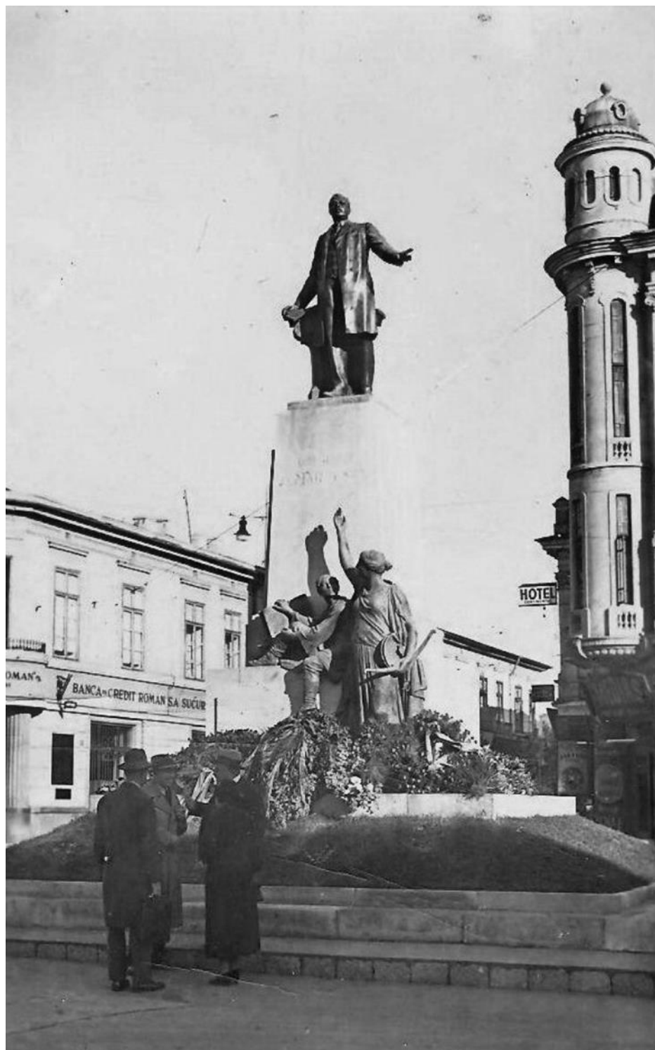
Fig. 10 – Statuia lui George Mârzescu, astăzi dispărută