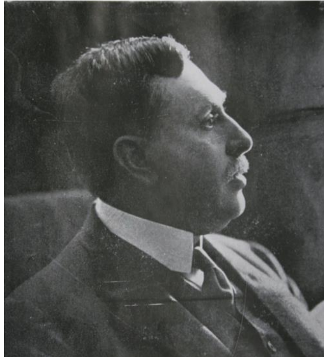
Fig. 3 – George Gh. Mârzescu, fost primar al Iaşului și ministru de Justiție