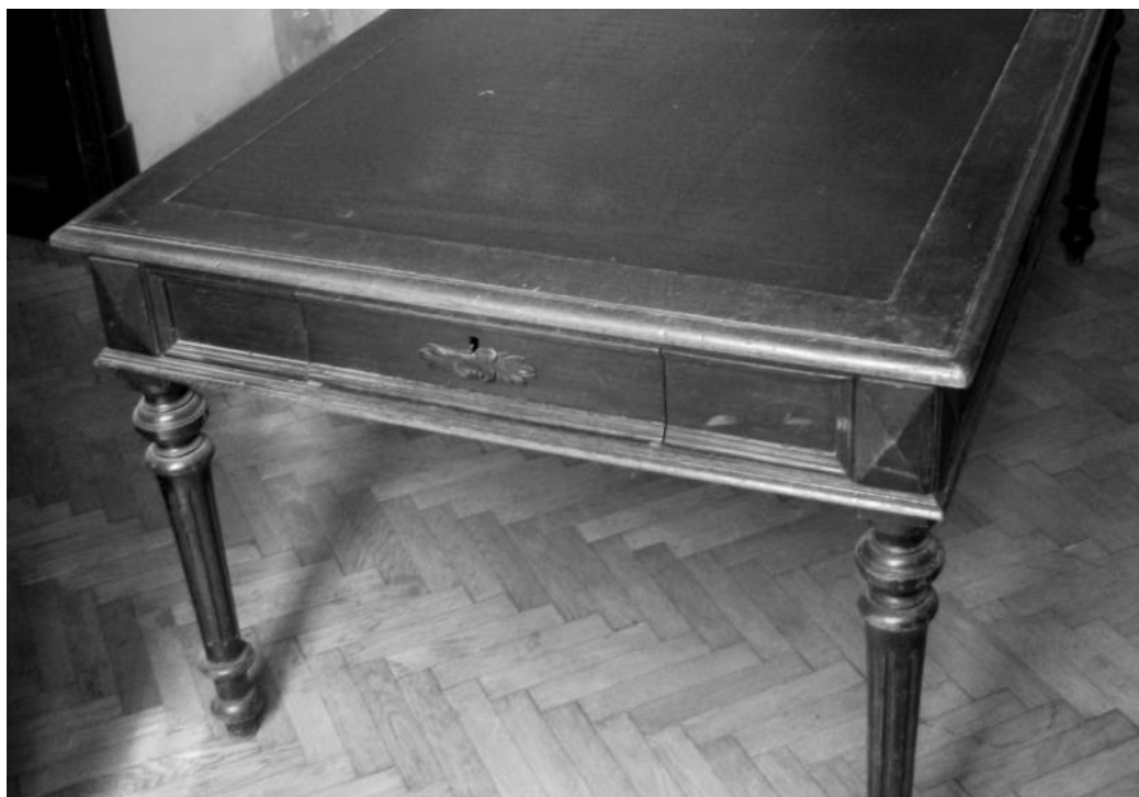
Fig. 8 – Masa-birou a lui G. Marzescu, aflată în colecția Muzeului de Istorie Iași