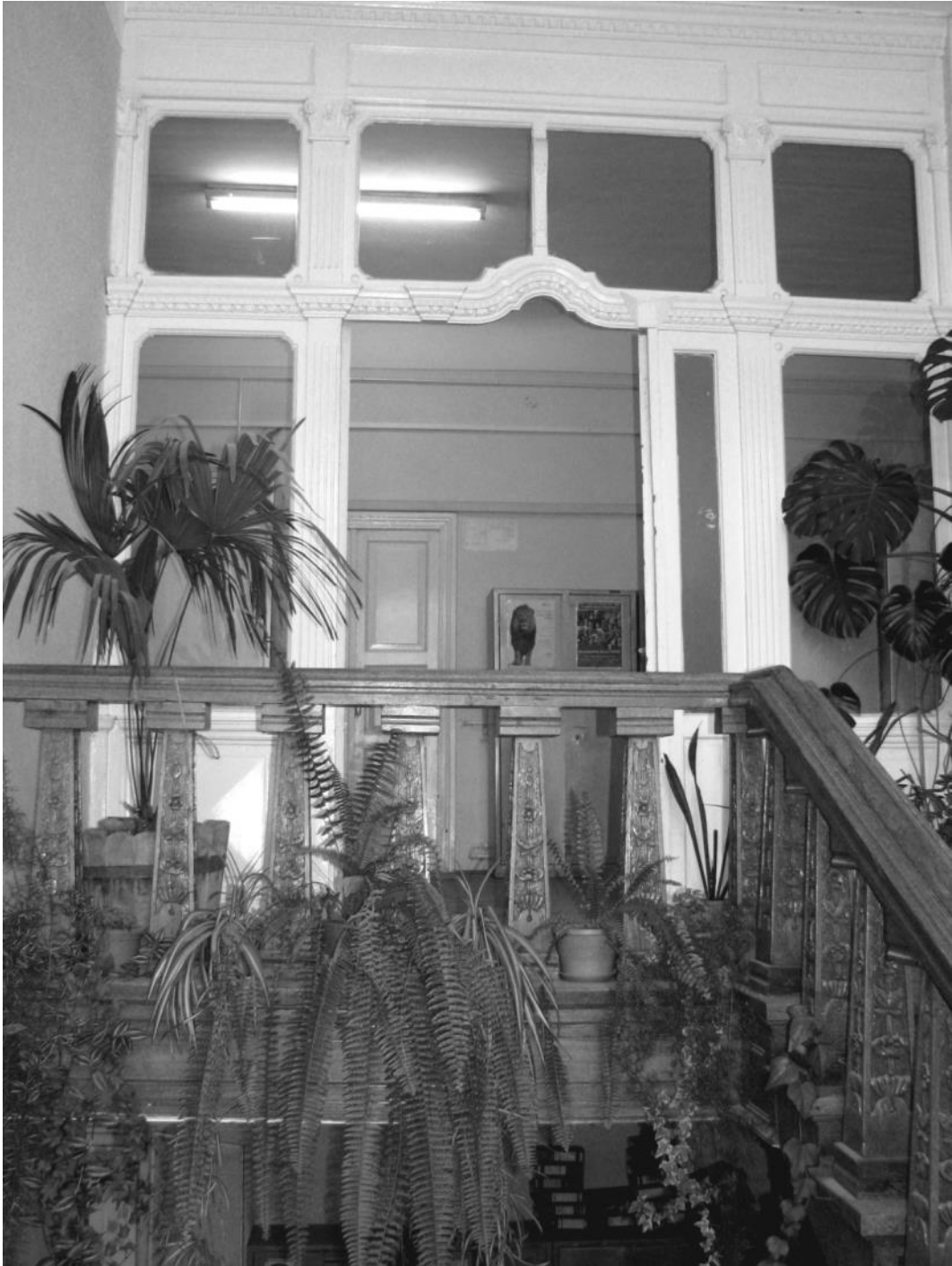
Fig. 9 – Casa Mârzescu, vedere spre etaj