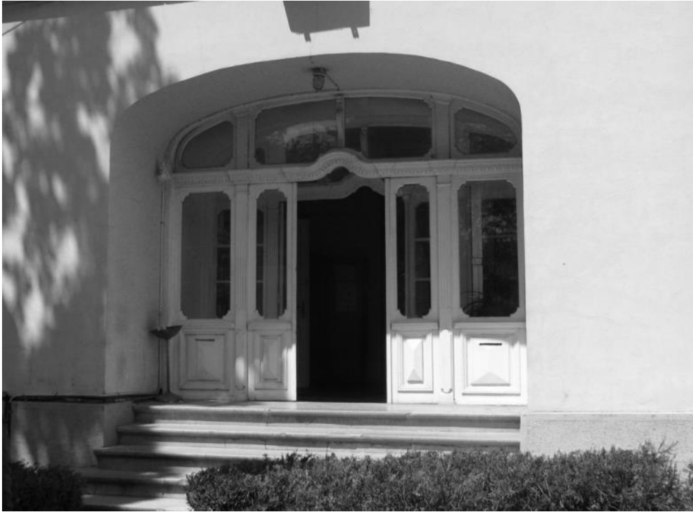
Fig. 5 – Intrarea casei, pe fațada de est