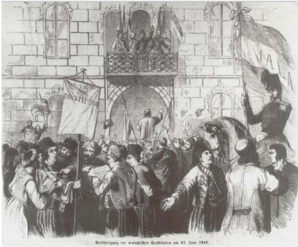
Fig. 1 – Scenă din Revoluția de la 1848, în fața palatului Bibescu, de pe Dealul Mitropoliei