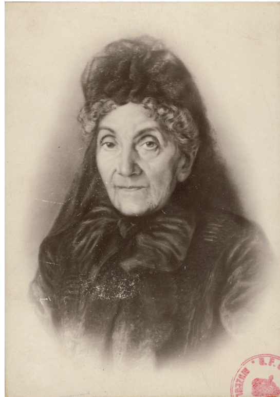
Fig. 2- Portretul Doamnei Elena Cuza