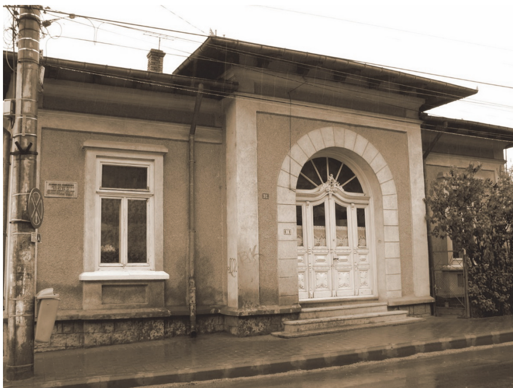
Fig. 4- Casa din Piatra în care a locuit Doamna Elena Cuza