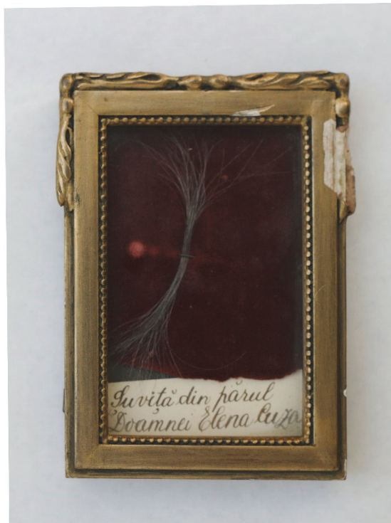
Fig. 3- O şuviță din părul doamnei Elena