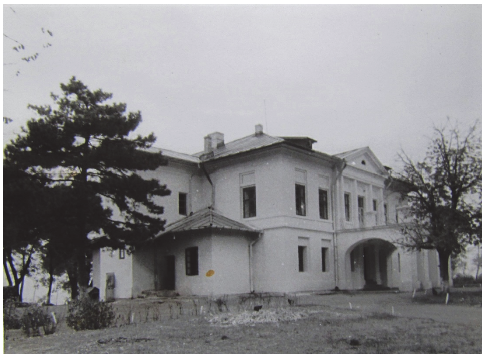
Fig. 4- Conacul de la Solești-Vaslui, casa natală a doamnei Elena Cuza