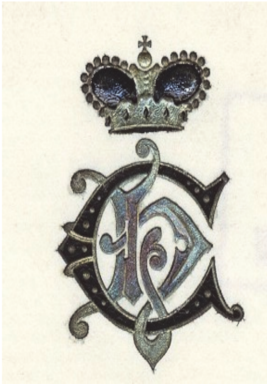
Fig. 1- Monograma Doamnei Elena