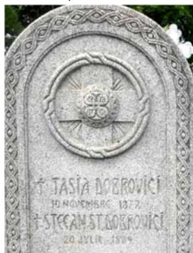
Mormânt al familiei Dobrovici la cimitirul Eternitatea din Bârlad