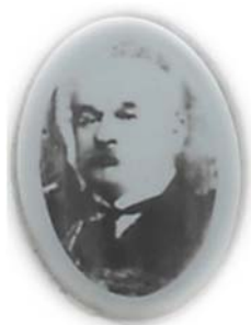
Gheorghe Munteanu (n. 1859 - † 15 iunie 1935)