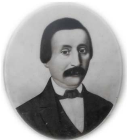
Gavril Hași Vasiliu (1836 – 1867)