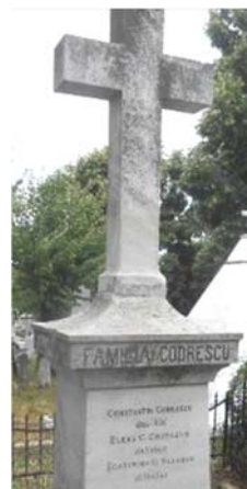
Monumentul funerar al familiei Codrescu