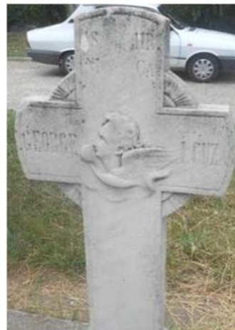
Mormântul lui George Ion Cuza (n. 4 octombrie 1842 – † 27 decembrie 1881), la cimitirul Eternitatea din Bârlad