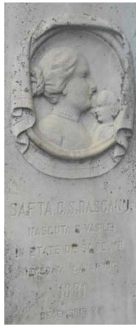
Morminte ale familiei Rășcanu, la cimitirul Eternitatea din Bârlad