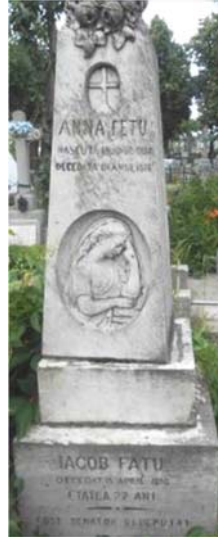
Monument funerar al familiei Fătu,