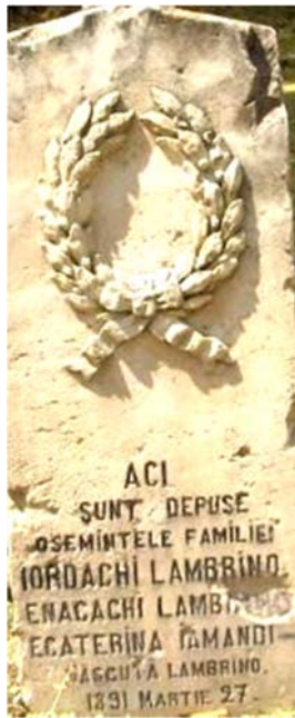
Mormânt al familiei Lambrino la cimitirul Eternitatea din Bârlad