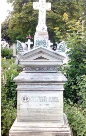
Monument funerar (iulie 1898) al familiei Costache Neculau

este numit asesor la Tribunalul din Bârlad. În anul 1851, domnul moldovean Grigore Alexandru Ghika îl ridică la rangul de serdar 98 , iar în anul 1867 devine președinte al Tribunalului din Bârlad. A mai deținut funcțiile de primar în Bârlad, prefect de Tutova, deputat și senator, fiind decorat cu medalia „Apărătorii Independenței”. A fost căsătorit (1849) cu Ana Fătu (n. 1821 – † 1874), fiica comisului Pavel Cerchez 99 , legătură din care se nasc un băiat și două fete 100 , dintre care una s-a căsătorit cu căpitanul Văleanu, cu care a locuit la Iași.