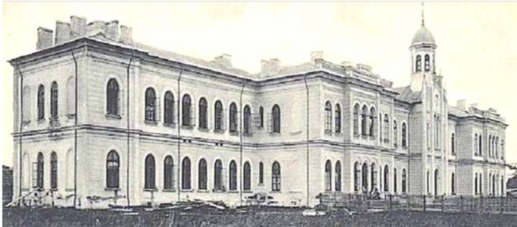
Clădirea Spitalului „Elena Beldiman” din Bârlad