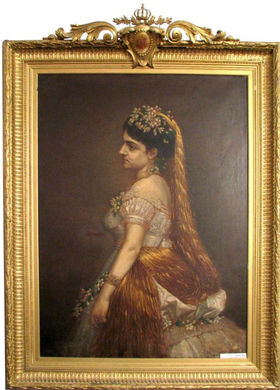
Fig. 1 – Portretul Nataliei Suțu-Mavrocordat (c. 1868) Muzeul Literaturii Române Iași