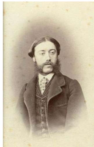
Fig. 4 – Nicolai Al. Grigore Suțu Muzeul Literaturii Române Iași