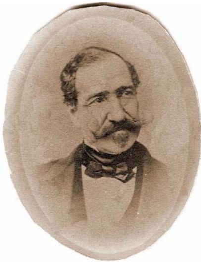
Fig. 3 – Gen. Nicolai Mavrocordat Muzeul Literaturii Române Iași