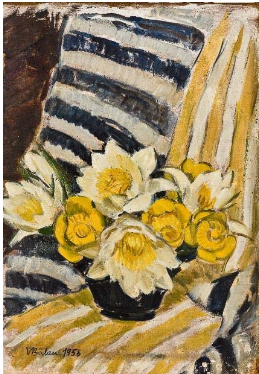
Fig. 3 - Viorica Balan, Nuferi (1956)