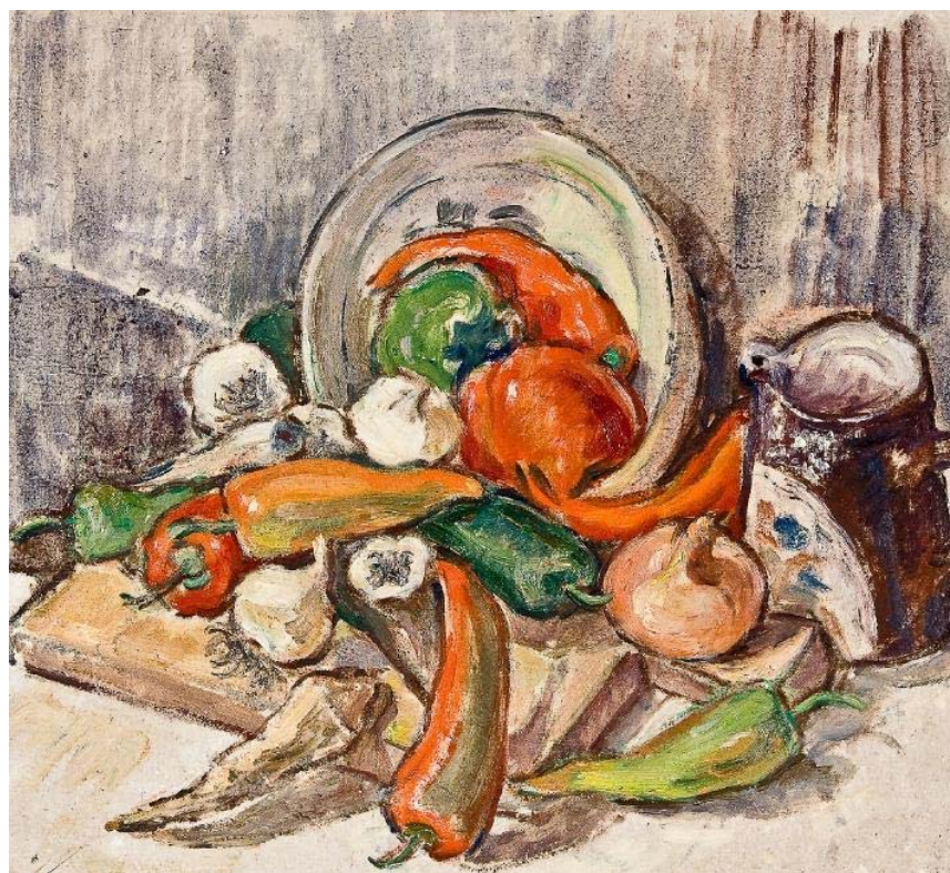
Fig. 4 - Viorica Balan, Natură statică