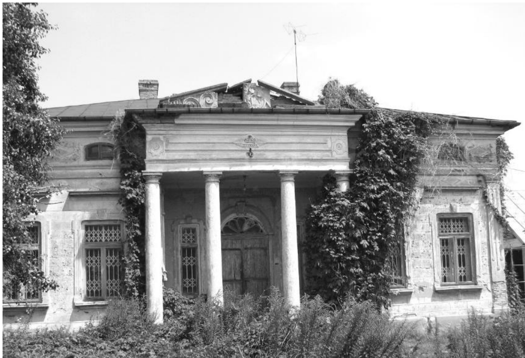
Fig. 5 – Casa „Stoicescu-Mărculescu”, sediul revistei „Viața Românească” (foto 2015)