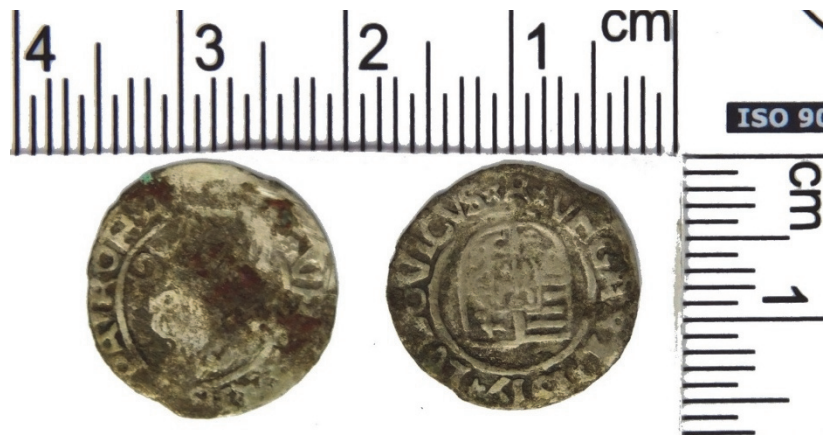
Fig. 5. Monedă emisă de regele Ungariei Ludovic II în anul 1517