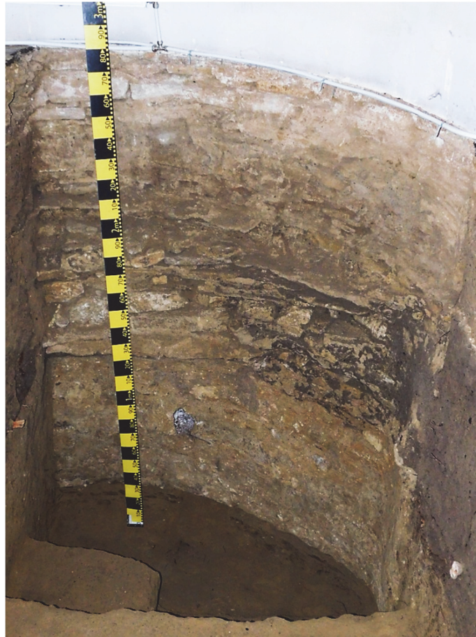
Fig. 2. Caseta 1, fundația absidei de S