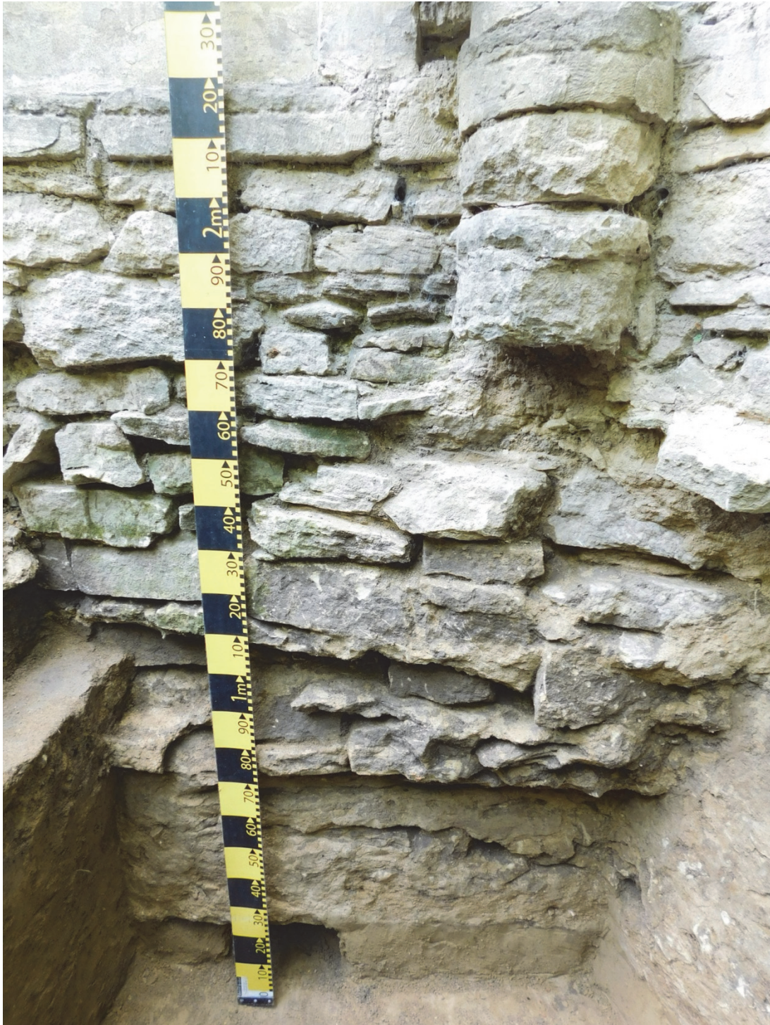
Fig. 9. Caseta 4, fundația bisericii pe latura de N