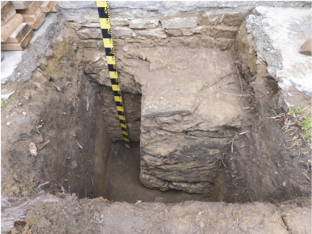
Fig. 6. Casetă 2