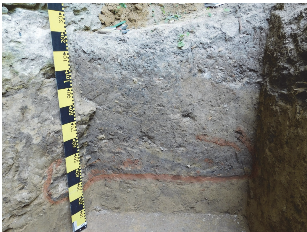
Fig. 8. Caseta 4, profilul vestic