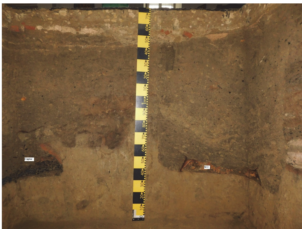
Fig. 4. Caseta 1, profilul nordic cu M2 și cuptorul