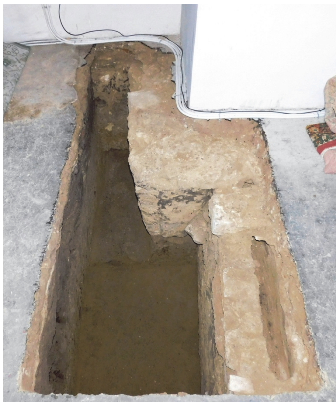
Fig. 7. Caseta 3