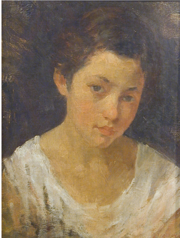
Fig. 5. Portret de fată. Muzeul de Artă Iași