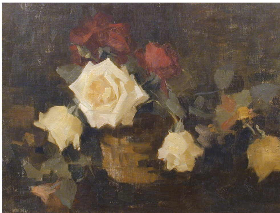
Fig. 2. Trandafiri, 1915, 42,5 x 32,5 cm. Muzeul de Artă Iași