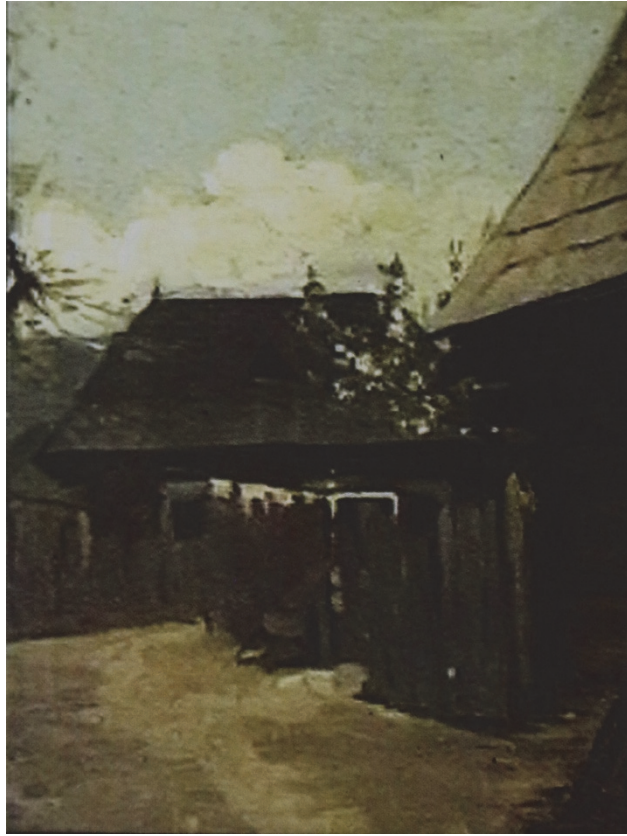
Fig. 3. Casă la țară, 40 x 30 cm. Muzeul de Artă Iași (nr. inv. 1221)