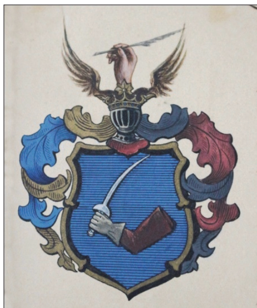
Fig. 3. Blazonul familiei Gherghelly