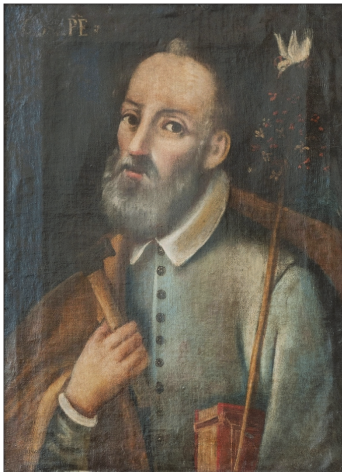
Fig. 2. Portret din colecția familiei Gherghelly