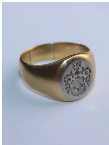
Fig. 4. Inel cu blazonul familiei Gherghelly