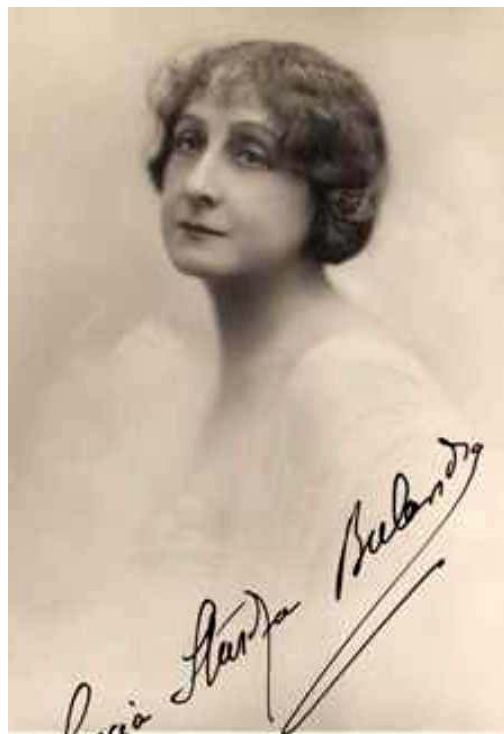
Lucia Sturdza Bulandra