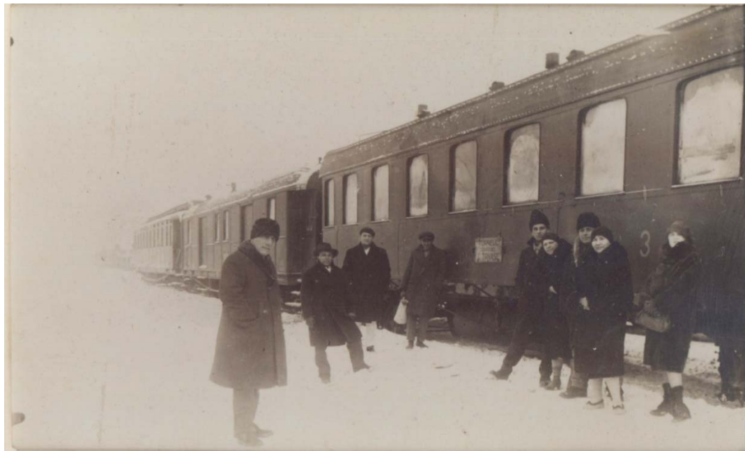
Trupa lui Constantin Tănase în turneu

Tony Bulandra (1881-1943) a fost foarte apreciat ca actor, organizator, director de trupă, animator, director de scenă. El a studiat la Conservatorul Dramatic din București și a făcut parte din trupa Teatrului Național. În 1909 a plecat de la Teatrul de stat pentru a juca în trupa lui Alexandru Davilla. În 1914 a înființat Teatrul „Regina Maria”, cunoscut mai târziu ca Teatrul „Bulandra”. În 1916, când s-a refugiat la Iași, el nu mai făcea parte din trupa Teatrului Național din București, ci avea propriul teatru. Soții Bulandra au întocmit un repertoriu valoros, au atras regizori și actori de prestigiu, în frunte cu Maria Ventura de la Comedia Franceză din Paris.