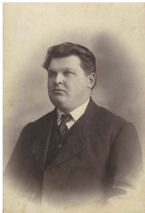
Mihail Sadoveanu, director