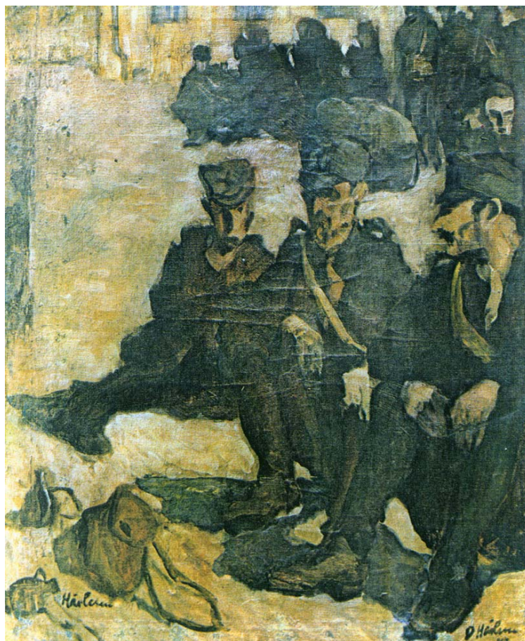
Fig. 18. Dimitrie Hârlescu, Prizonieri