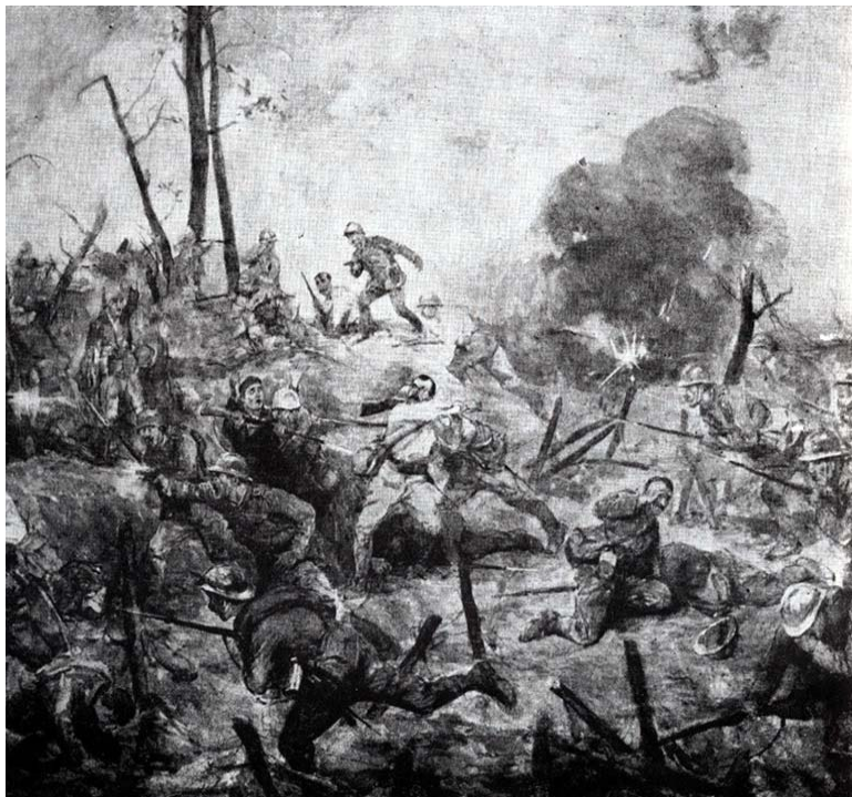
Fig. 17. Ion Stoica-Dumitrescu, Lupta de la Mărășești