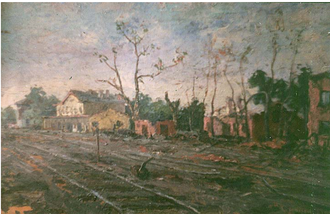
Fig. 2. Doru Ionescu, Gara din Tecuci (bombardată n.n.) (Muzeul Militar Național „Regele Ferdinand I”, București)