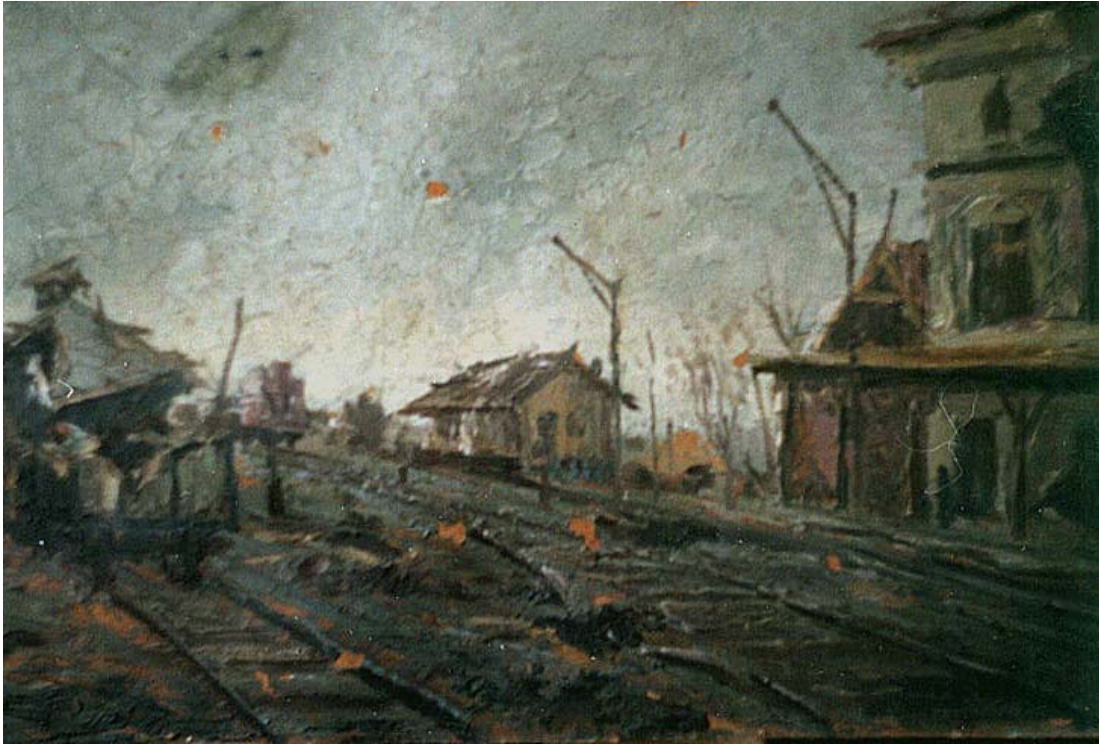
Fig. 1. Doru Ionescu, Gara din Târgu Ocna (bombardată n.n.) (Muzeul Militar Național „Regele Ferdinand I”, București)