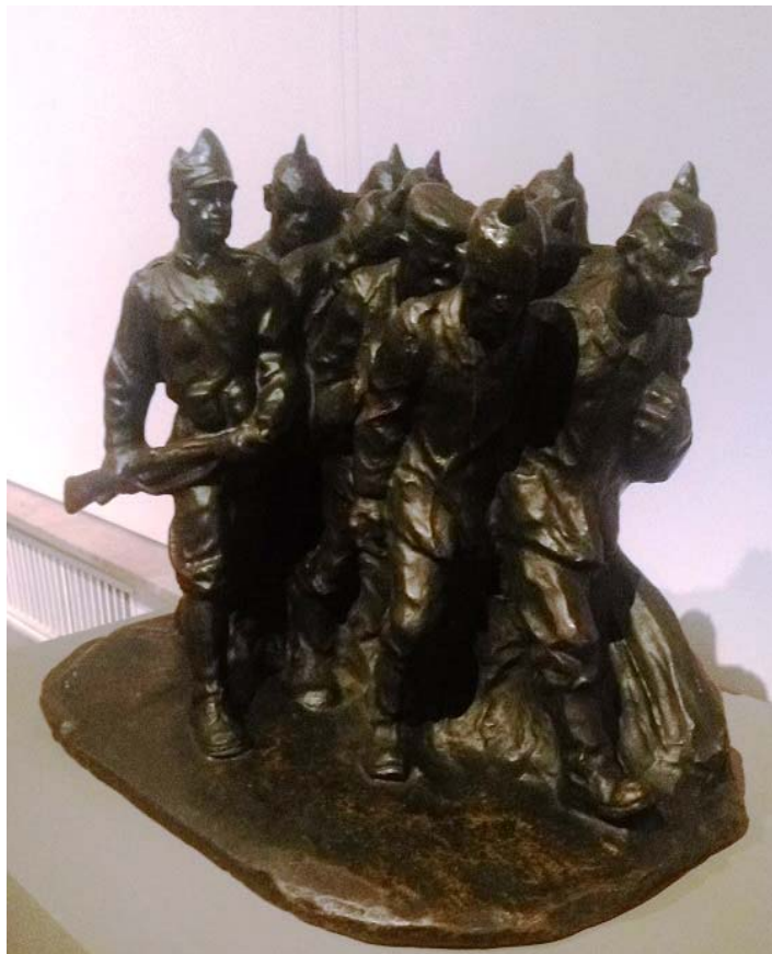
Fig. 16. Cornel Medrea, Prizonieri germani