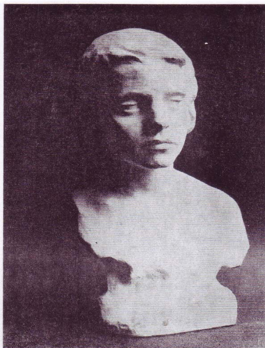
Fig. 11. Alexandru Călinescu, Fetiță tristă