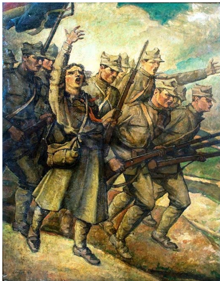
Fig. 14. Camil Ressu, Ecaterina Teodoroiu