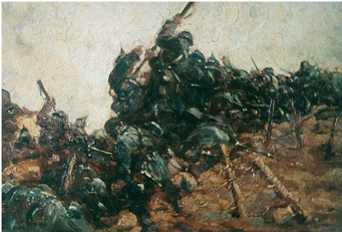
Fig. 3. Emilian Lăzărescu, La atac (Mărășești) (Muzeul Militar Național „Regele Ferdinand I”, București)