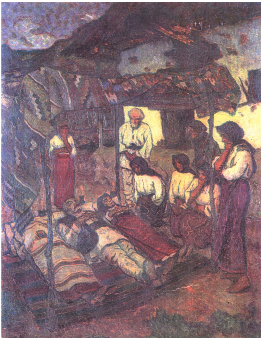
Fig. 21. Ștefan Dimitrescu, Un cămin din Cașin