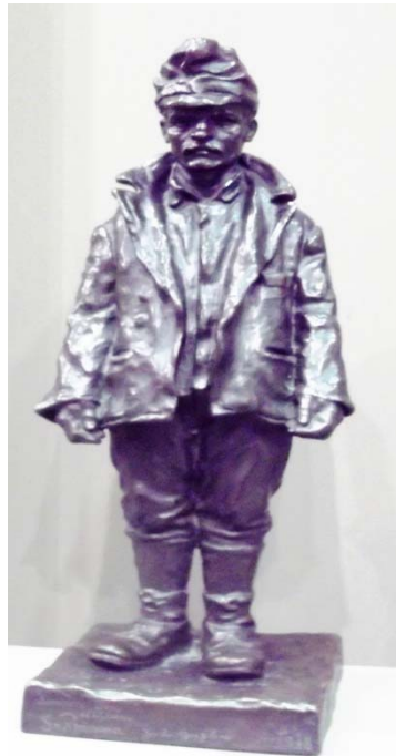
Fig. 13. Alexandru Călinescu, Un milițian