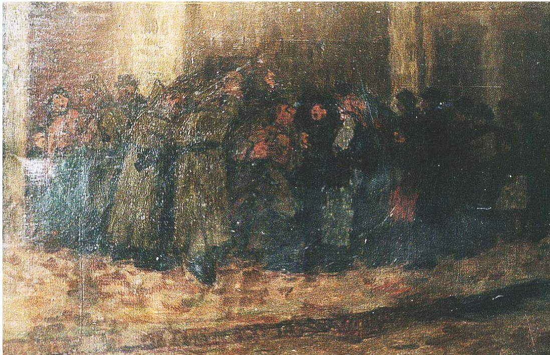
Fig. 5. Ștefan Dimitrescu, Coadă la pâine , (Muzeul Militar Național „Regele Ferdinand I”, București)