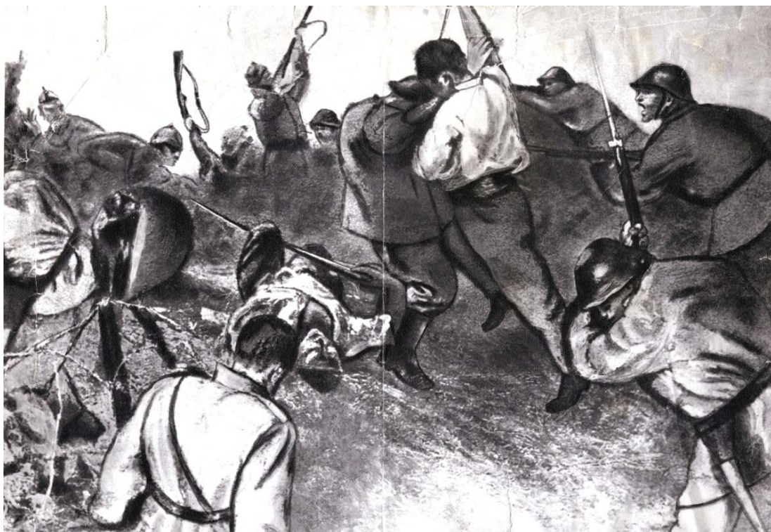
Fig. 6. Petru Remus Troteanu, Atacul regimentului 32 infanterie (La Răzoare)