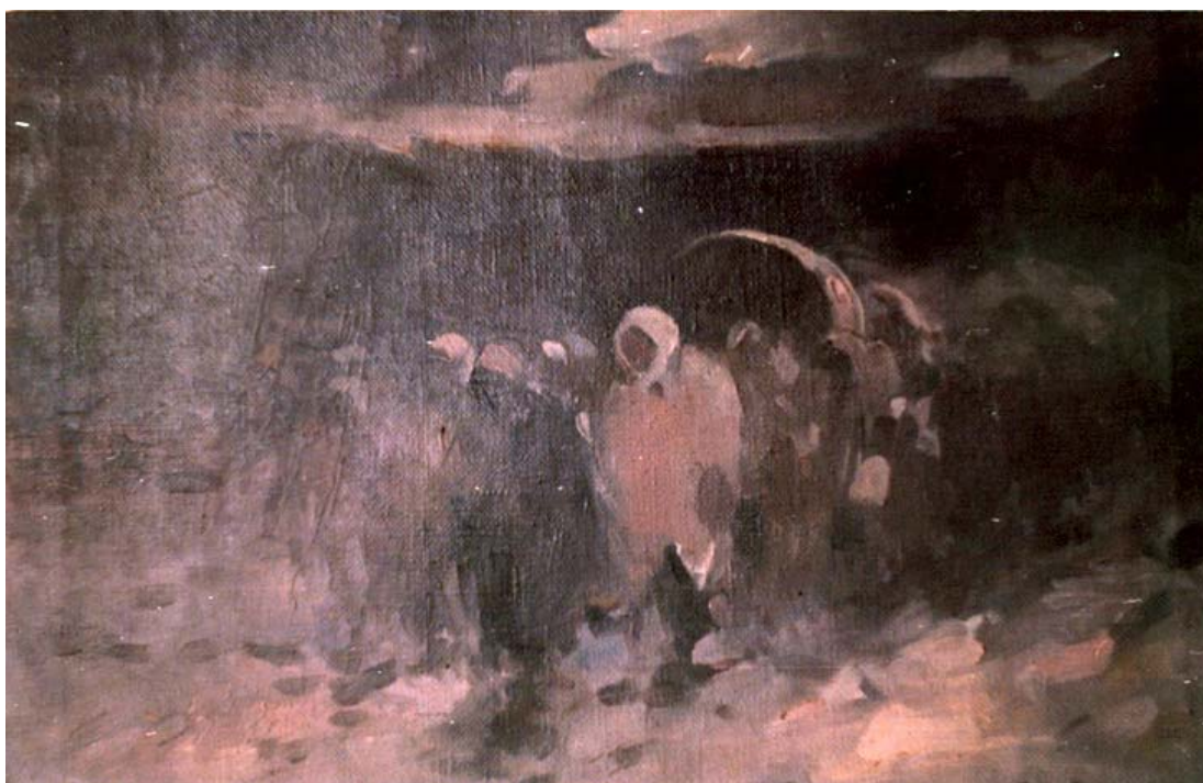
Fig. 4. Dumirtru Brăescu, Refugiați (Muzeul Militar Național „Regele Ferdinand I”, București)