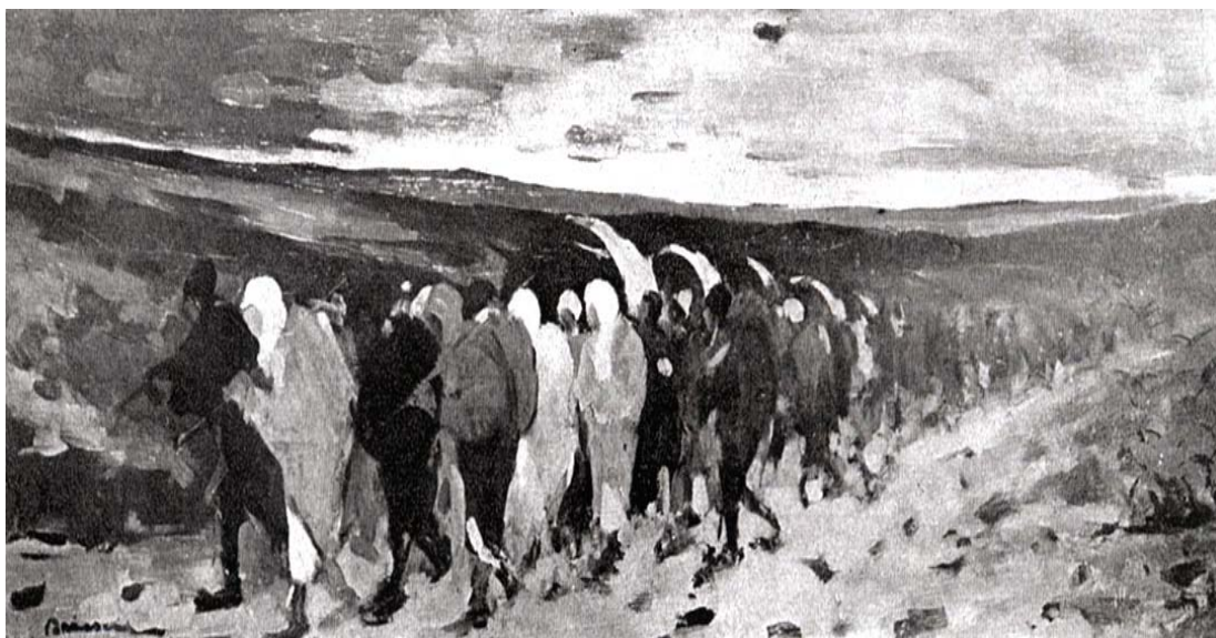
Fig. 7. Dumitru Brăescu, Refugiați