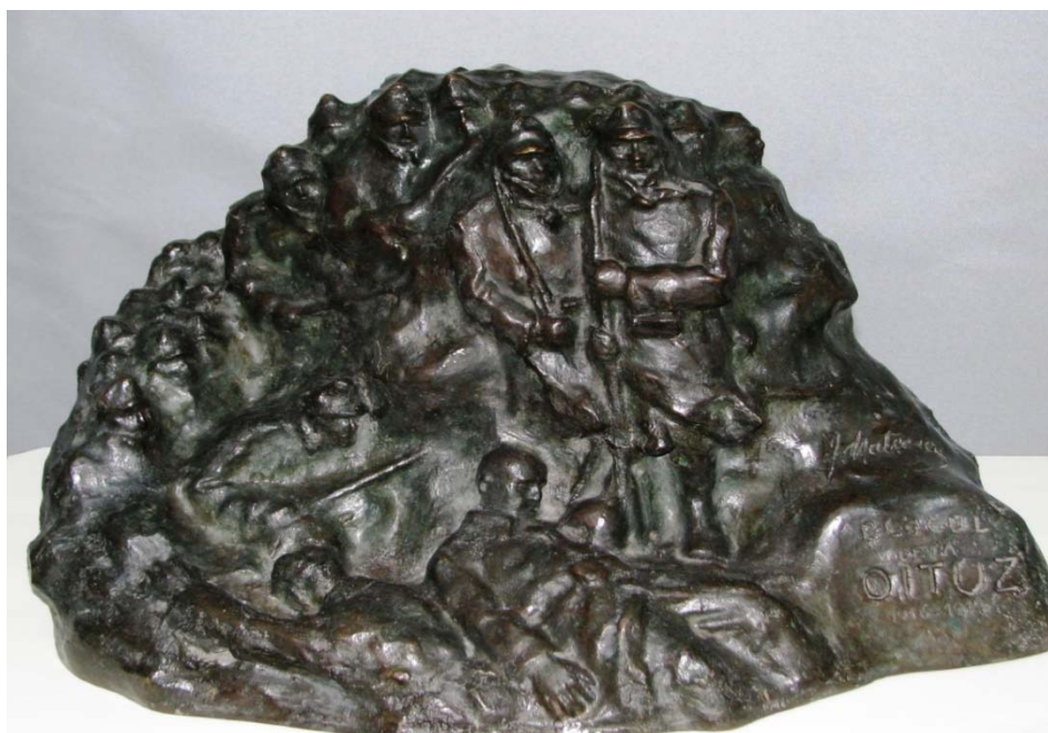
Fig. 9. Ion Mateescu, Blocul de la Oituz (Muzeul de Istorie a Moldovei, Iași)