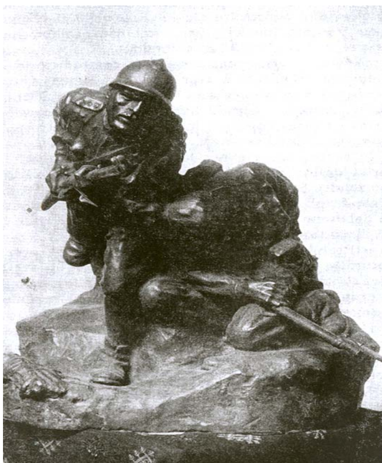
Fig. 12. Alexandru Călinescu, La baionetă