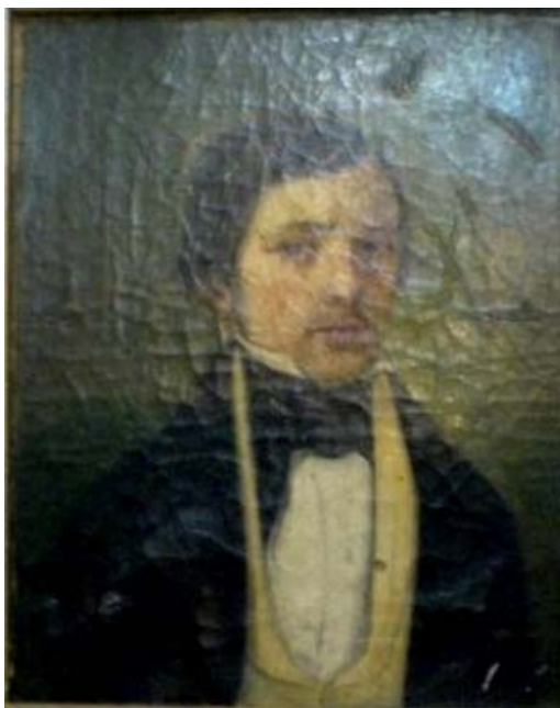
Fig. 4. Portret de bărbat (Colecție particulară)