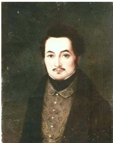
Fig. 3. Portret de tânăr (Muzeul Național de Artă al României)