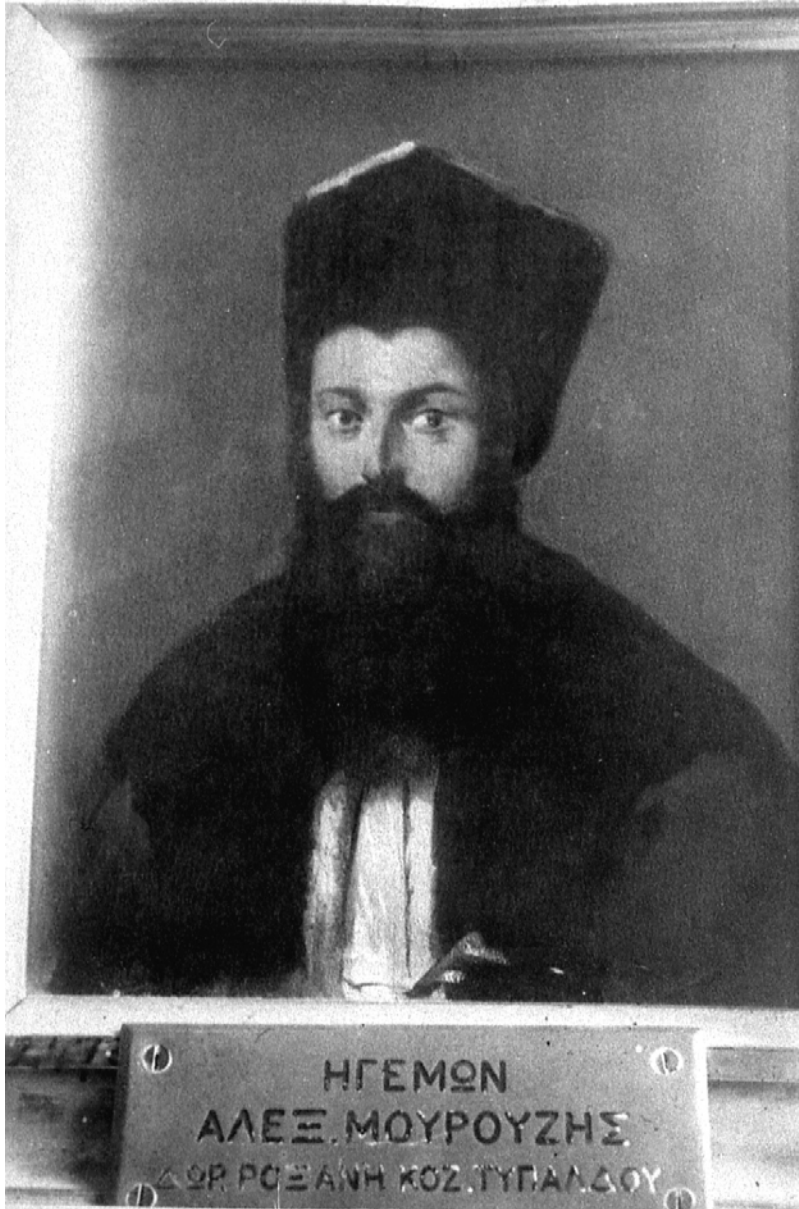
Fig. 19. Portretul lui Alexandros Mourouzis. Centrul de Studii Neoclene din Atena