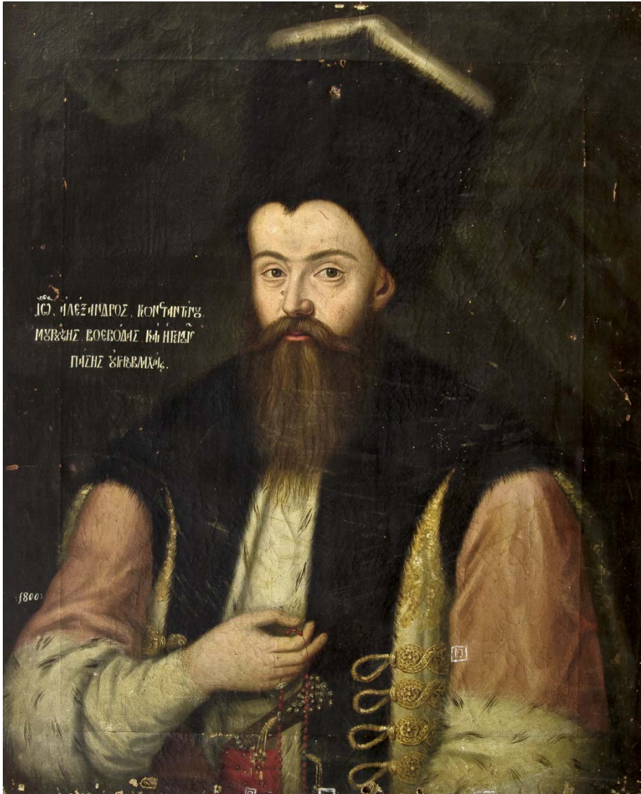
Fig. 11. Alexandru Moruzi voievod al Ungrovlahiei, 1800. Muzeul Național de Artă al României