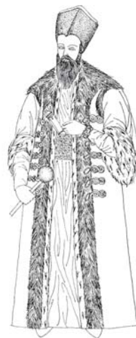
Fig. 8. Alexandru Moruzi portret întreg (reconstituire)