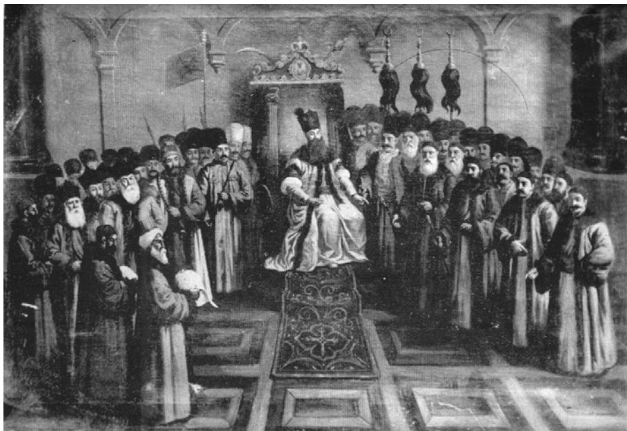
Fig. 6. Instalarea pe tron a lui Nicolae Mavrogheni (1786). Pictură atribuită venețianului Giorgio Venier