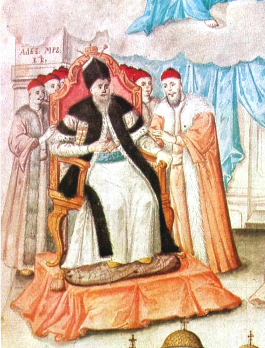
Fig. 9. Alexandru Moruzi vodă. Portret din Condica Mănăstirii Radu Vodă (1794)