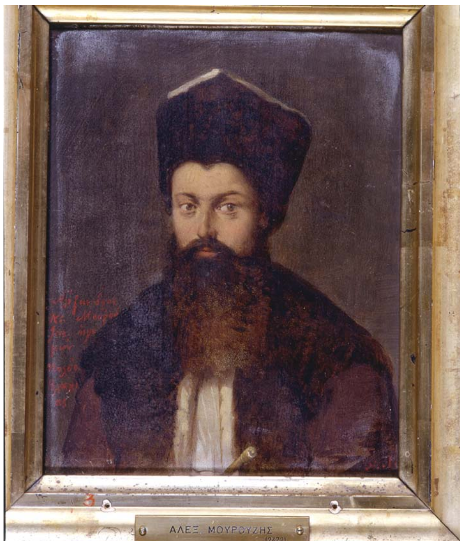
Fig. 18. Nikiforos Lytras, Portretul lui Alexandros Mourouzis . Muzeul Național de Istorie din Atena