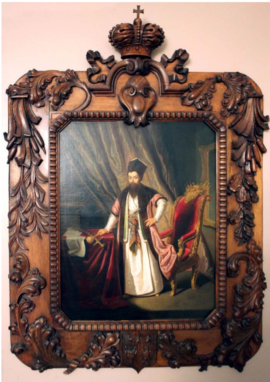
Fig. 1. Principele Alexandru Moruzi. Portret din colecția domnului Mihai Dim. Sturdza (Paris)