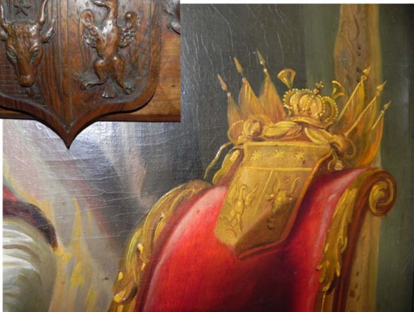
Fig. 3. Stema Moruzi pe spătarul tronului (detaliu)