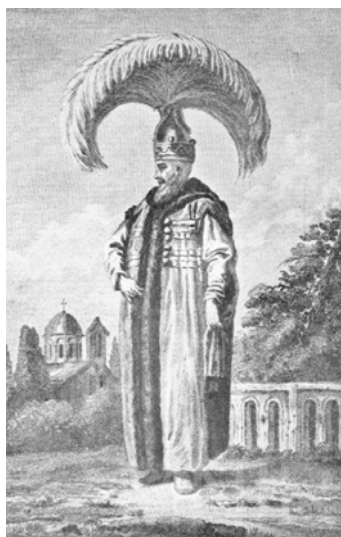
Fig. 7. Alexandru Moruzi în costum de ienicer (1791). Desen de L. M. Halbon