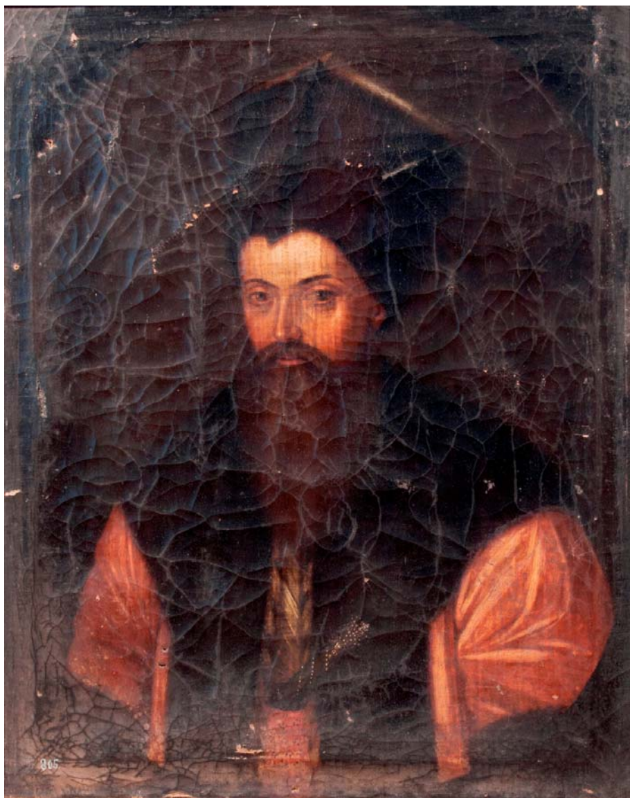
Fig. 13. Alexandru Moruzi voievod al Moldovei (1803-1806).