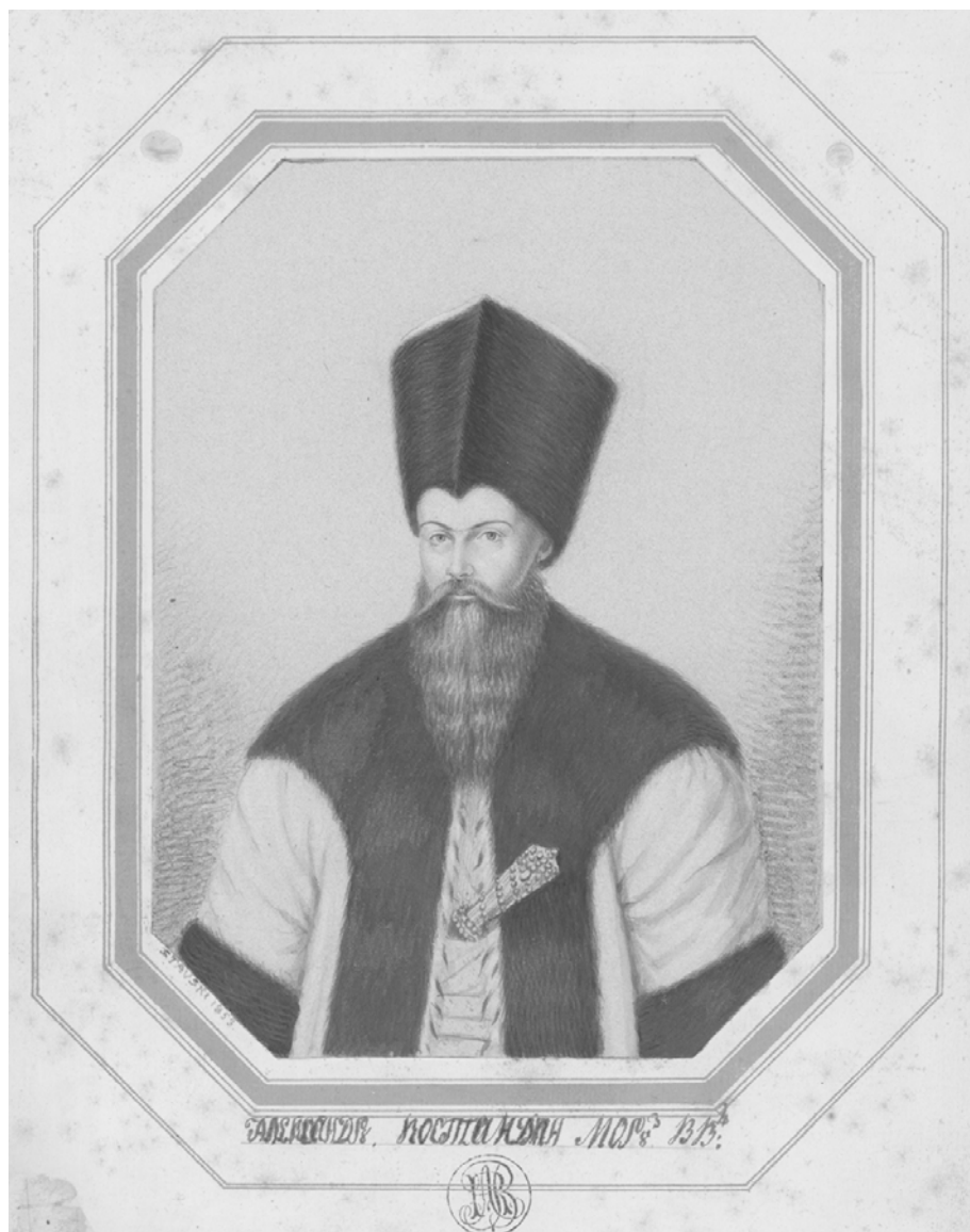
Fig. 16. Alexandru Costandin Moruzi VV. Portret de Ludovic Stawski, 1853. Biblioteca Academiei Române