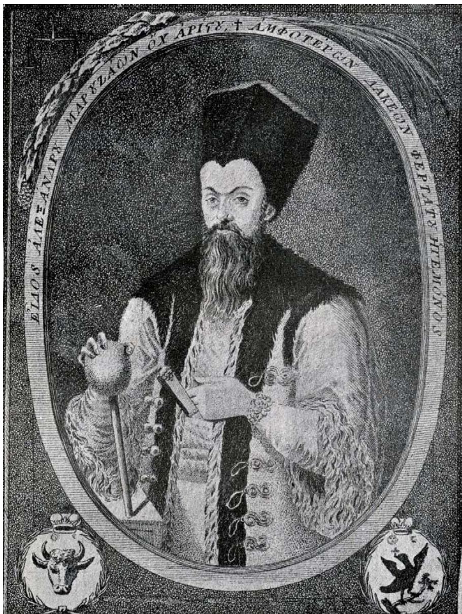
Fig. 12. Portretul principelui Alexandru Moruzi pe Harta Valahiei publicată de Iordache Golescu la Viena (1800)