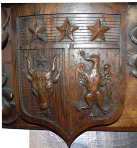
Fig. 2. Stema Moruzi pe rama portretului (detaliu)