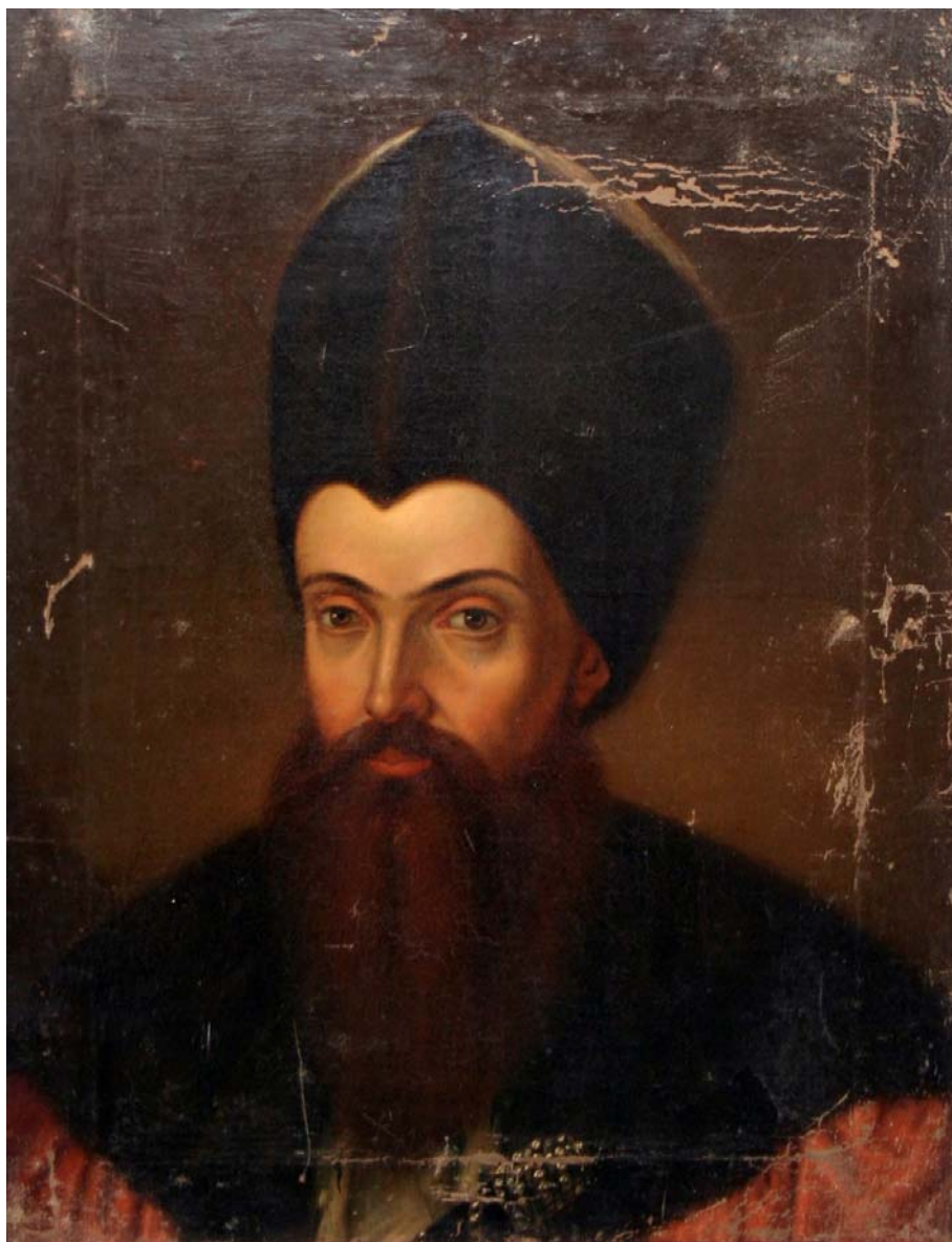
Fig. 14. Alexandru Moruzi domnitorul Moldovei. Portret din Galeria Epitropiei Sf. Spiridon-Iași. Muzeul de Istorie a Moldovei