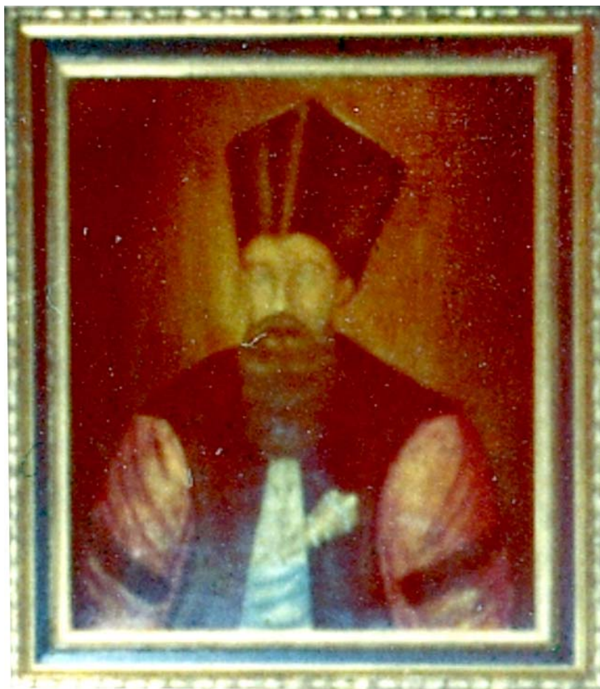
Fig. 17. Alexandru Moruzi, portret în ulei pe pânză. Colecția C. Moruzi (Paris)