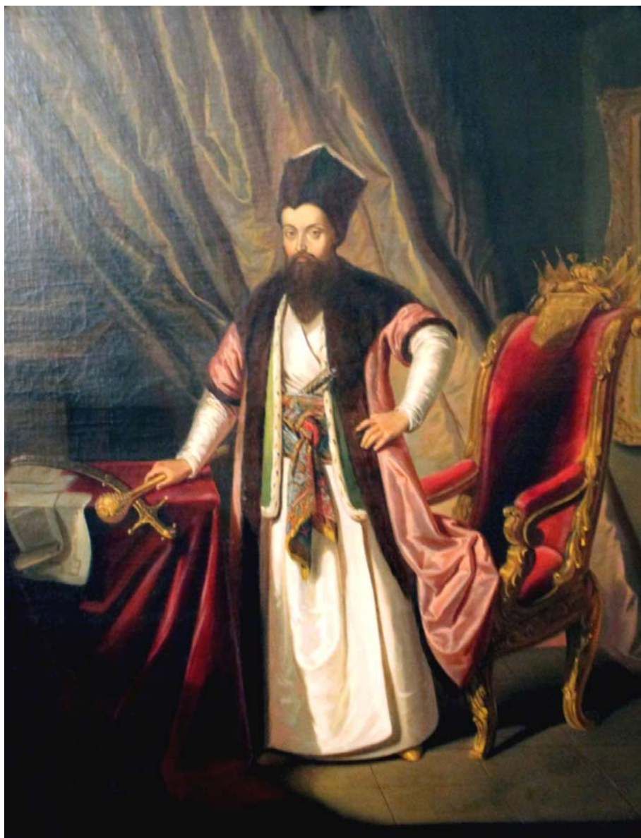
Fig. 10. Principele Alexandru Moruzi. Portret din colecția domnului Mihai Dim. Sturza